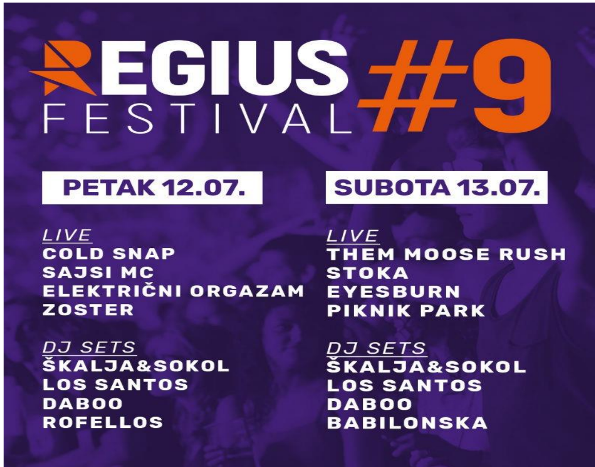
Slika 4. Deveto izdanje Regius festivala