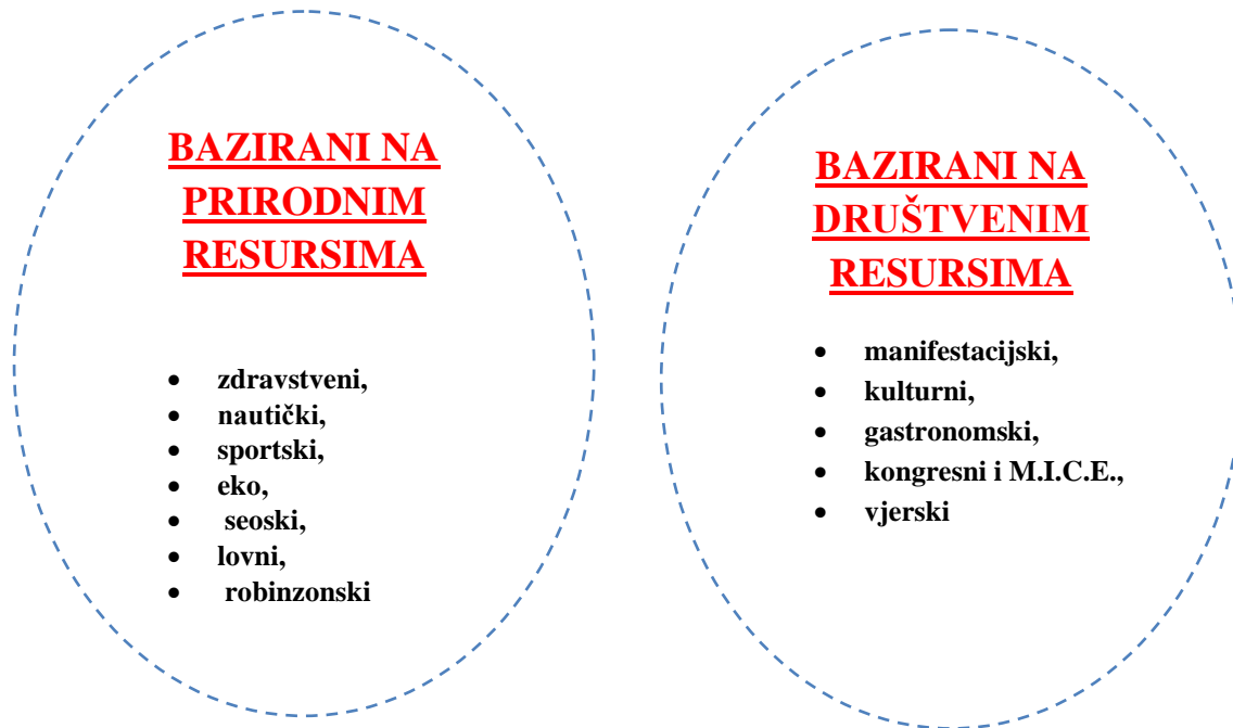
Slika 1. Specifični oblici turizma

Kada je riječ o turizmu, razlikuju se određeni specifični oblici, s obzirom na one koji su bazirani na prirodnim resursima te onih koji su bazirani na društvenim resursima.