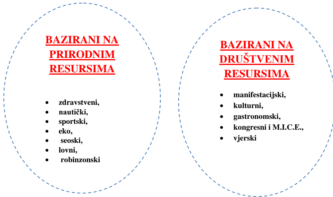
Slika 1. Specifični oblici turizma

Kada je riječ o turizmu, razlikuju se određeni specifični oblici, s obzirom na one koji su bazirani na prirodnim resursima te onih koji su bazirani na društvenim resursima.