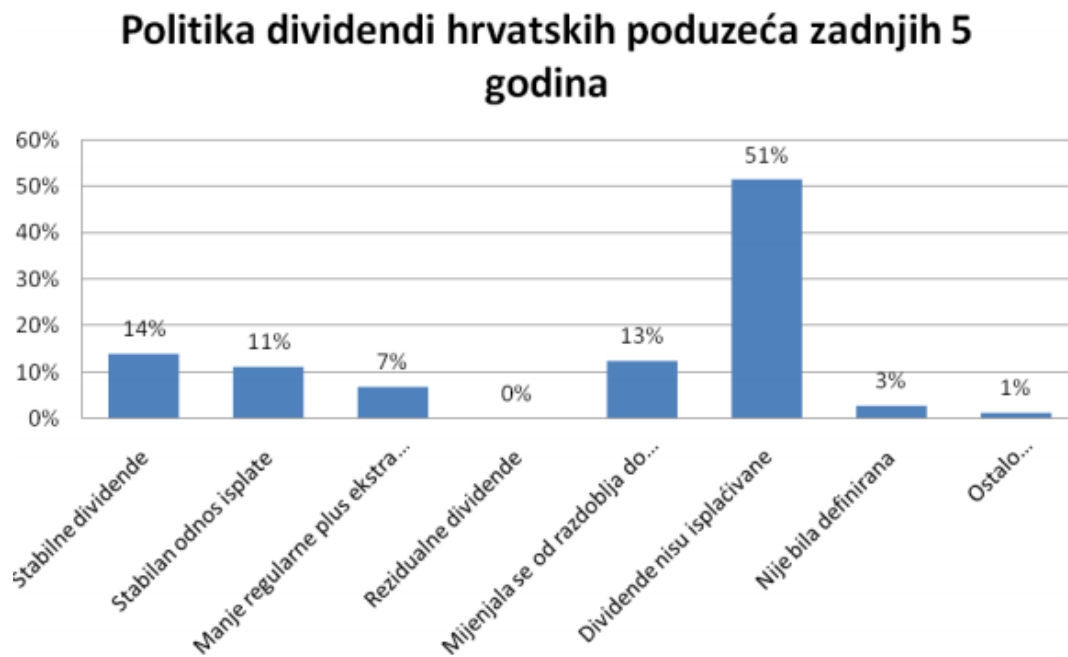
Slika 1: Politika dividendi hrvatskih poduzeća zadnjih pet godina

Autor 1: Kožul Antonija, 2009, "Politika dividendi"