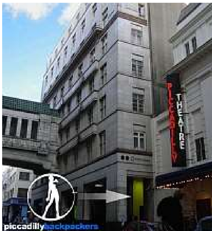
Slika 1 – Piccadilly Hostel, London, UK; https://www.letsbookhotel.com/en/uk/london/hotel/piccadilly-backpackers-hotel.aspx

Piccadilly hostel je veliki hostel za mlade smješten u Londonu. U punom je vlasništvu tvrtke Piccadilly Hotel Ltd. Ima 7 katova i 300 soba sa spavaonicama za 4 ili 6 osoba kao i privatnim sobama. Može smjestiti 700 gostiju u isto vrijeme.