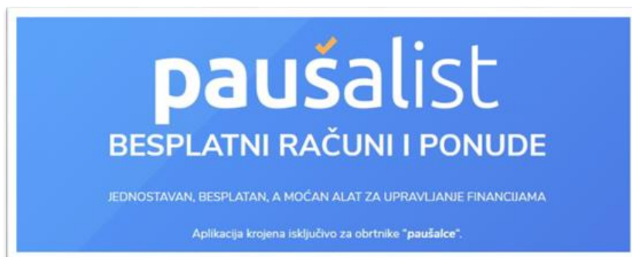
Slika 7. Logo aplikacije za obrtnike paušalce