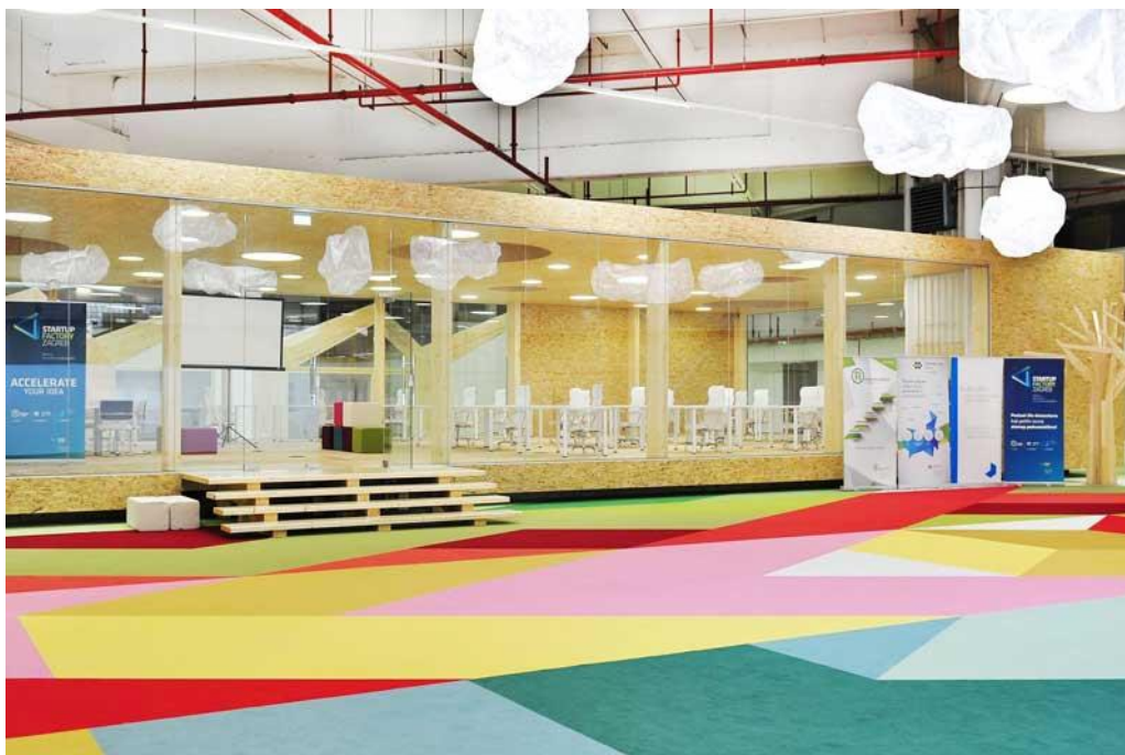
Slika 2: ZICER