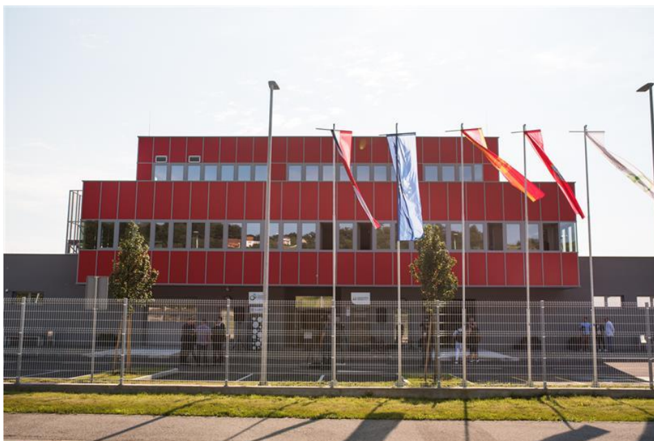
Slika 1. Poslovno tehnološki inkubator KZZ