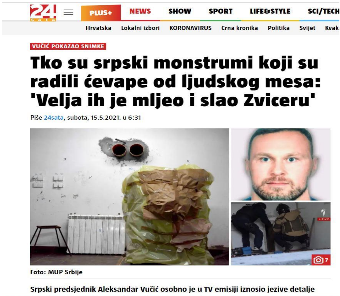
Fotografija 2. Snimka zaslona članka na portalu 24sata.hr, (18.5.2021)

U promatranom razdoblju mediji u kojima se provelo istraživanje pisali su i o više prometnih nesreća, između ostalog u jednoj 24sata.hr koristi glagol „pokosio“ 61 govoreći o naletu automobila na dvojicu pješaka, u kojima se kao posebno negativan primjer izvještavanja ističu članci o prometnoj nesreći, za čije se izazivanje sumnjiči mladić od 18 godina koji je, prema istrazi, automobilom upravljao pod utjecajem alkohola, a koja za posljedicu ima smrt njegova suvozača. U naslovima su prevladavali podaci o tome da nije imao vozačku dozvolu, vožnja pod utjecajem alkohola, smrt suvozača te prijašnje kažnjavanje zbog vožnje prije stjecanja