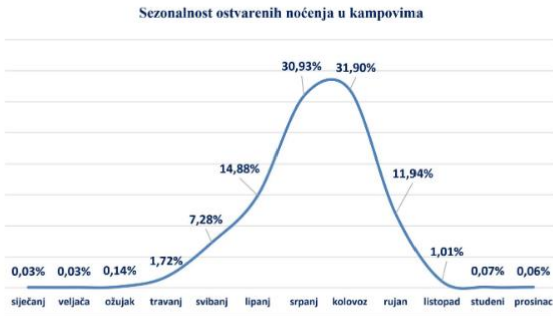
Graf 1. Sezonalnost ostvarenih noćenja u kampovima