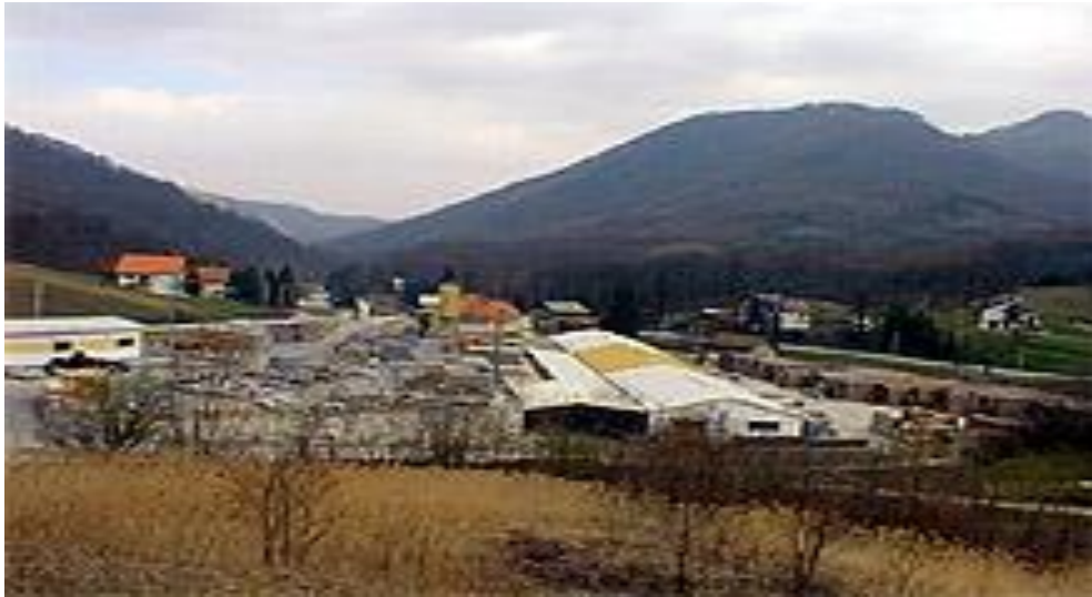
Slika 1 - Tvrtnka Schiedel u Golubovcu