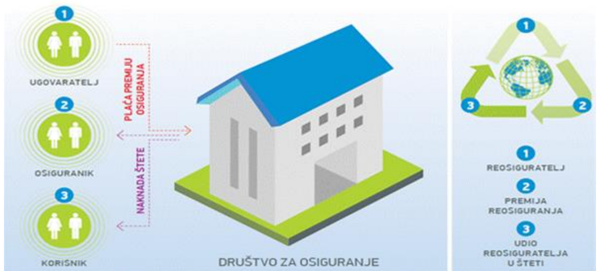
Slika 3. Kako funkcionira osiguranje?

Kao što je već nekoliko puta navedeno, društva za osiguranja prikupljaju sredstva od svojih osiguranika. Plaćanje premije osiguranja glavna je obveza ugovaratelja osiguranja. Plaćanje premije osiguranja regulirano je Zakonom o osiguranju, ali treba napomenuti da obveza osiguratelja postoji prema svakom osiguraniku pojedinačno i u slučaju kada ugovaratelj osiguranja nije uplatio premiju u predviđenom roku, ako nesretni slučaj nastane za vrijeme trajanja osiguranja. (Matijević B., 2010.) Za korisnika osiguranja, visina premije je izuzetno bitna. To znači ako je iznos premije pristupačniji klijentu samim time će i društva za osiguranje bilježiti rast. Na temelju toga se može zaključiti da bez korisnika, osiguranja ne mogu uspjeti i bilježiti rast, jer je prvenstveno njihov cilj pružiti zaštitu korisnicima te u trenutku nastanka osiguranog slučaja isplatiti osigurninu.