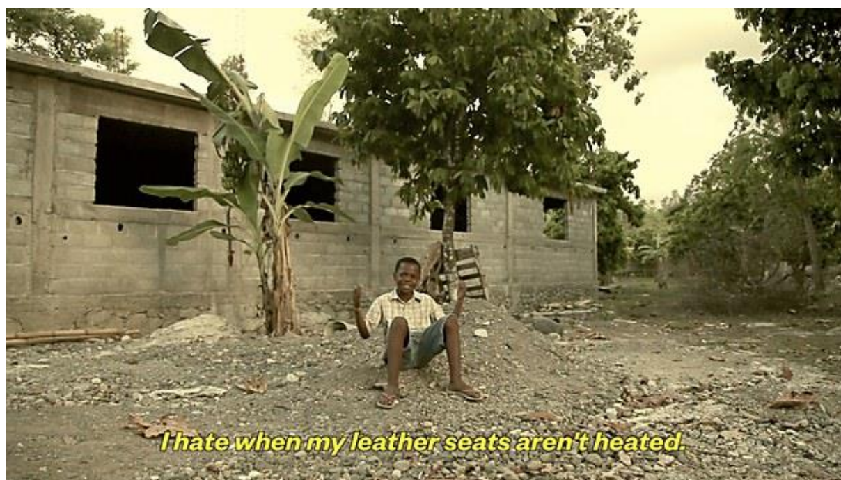
Slika 5. Kadar iz videa First World Problems Anthem

prikazuje djecu i osoblje sirotišta koji žive u nehumanim uvjetima dok istovremeno govore, primjerice, kako ne vole kada im je kuća toliko velika da im trebaju dva routera ili kako im smeta kada im kožna sjedala nisu grijana (YouTube, 2021.). Smisao ovoga je prikazati kontrast između visokog životnog standarda i uvjeta ljudi koji žive u tzv. zemljama prvog svijeta i siromaštva i svakodnevne borbe za preživljavanje s kojom se suočavaju mnogi ljudi u zemljama trećeg svijeta. Stoga je organizacija kreirala svoj hashtag naziva #HelpSolveRealProblems kako bi bar privremeno zamijenio onaj drugačije konotacije #FirstWorldProblems. Tako je kampanja i dobila naziv „Hashtag Killer“. Cilj ovog oglasa bio potaknuti ljude na akciju u vidu doniranja novca organizaciji koja, kao što je ranije spomenuto, osigurava pristup pitkoj vodi siromašnima.