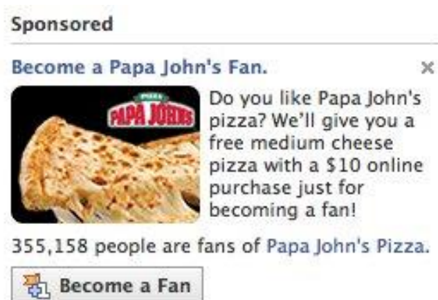
Slika 3. Papa John's promotivna kampanja

Izvor: http://ryanspoon.com/blog/2009/11/05/incentivizing-facebook-fans-papa-johns-doubles-fans-with-free-pizza (15. prosinca 2021.)