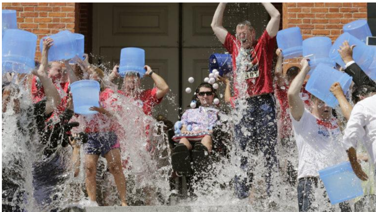
Slika 1. "ALS Ice Bucket Challenge" promotivna kampanja

Postoji mnoštvo primjera uspješnih kampanji viralnog marketinga. Jedan od najpoznatijih i najpopularnijih je „ALS Ice Bucket Challenge“. Pokrenut kao kampanja za podizanje svijesti o amiotrofičnoj lateralnoj sklerozi (ALS), teškoj neurološkoj bolesti koja se manifestira pogoršanjem motoričkih vještina pacijenta. Glavna ideja kampanje je bila da osoba koja prihvati izazov mora snimiti i podijeliti na društvenim mrežama video gdje sebe polijevaju kantom ledeno hladne vode. Nakon toga osoba koja je odradila izazov ima pravo javno nominirati bilo koju drugu osobu da napravi isto i također podijeli na društvenoj mreži i izazove nekog trećeg. Tu su najviši učinak imale poznate osobe od kojih je mnoštvo odradilo izazov i predložilo neku drugu poznatu osobu da ga prihvati. Kao alternativu odradi izazova, izazvana osoba mora donirati novac udruženju oboljelih od ALS-a. Kampanja je postala viralna i u nju su se uključili milijuni ljudi diljem svijeta, bilo odrađivanjem izazova ili dijeljenjem sadržaja vezanog uz njega. Bila je pokrenuta 2014. godine i tada je je bilo gotovo nemoguće izbjeći na društvenim mrežama. Prikupila je čak 115 milijuna dolara i gotovo utrostručila godišnja ulaganja u istraživanje bolesti (ALS Association, 2019.).