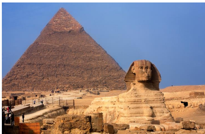
Slika 4. Velika sfinja i Keopsova piramida

je otkriće važno za egipatsku arheologiju. S obzirom da se broj turista u Egiptu smanjio zbog utjecaja globalne pandemije COVID-19 virusa, kako prenosi portal N1 (2021), egipatski arheolozi nastoje otkrivati što više lokaliteta kako bi privukli što veći broj posjetitelja i na taj način spriječili negativnu tendenciju u turizmu. Posjetitelje svakako privlači i Keopsova piramida, uvrštena u sedam svjetskih čuda svijeta, ujedno je i „najstarije svjetsko čudo te jedino koje je očuvano u potpunosti“ (Janjanin i Beban-Brkić, 2017:55). Poznata je i pod nazivom Velika piramida te se nalazi u Gizi, a posebna je po tome što je sagrađena tako da njena svaka strana okrenuta prema jednoj o četiri strane svijeta. Ovakvu preciznost, smatraju Janjanin i Beban-Brkić (2017) danas je moguće ostvariti uz pomoć moderne tehnologije i dobrog poznavanja astronomije, a kako su je Egipćani tako precizno izgradili, ostaje misterija. Ispred piramida u Gizi se nalazi Velika sfinja (slika 4) koja drži status najvećeg kipa napravljenog od jednog kamena.