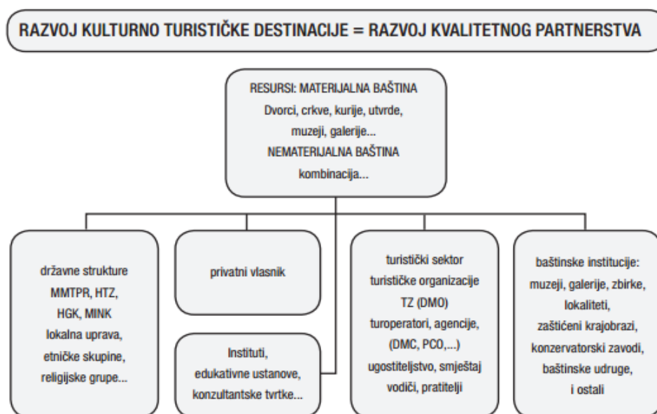
Slika 1. Tijela i elementi kulturne destinacije

Kulturni resursi se trebaju nuditi kao proizvod na tržištu kojeg će posjetitelji doživjeti te će na taj način doći do promocije turističke destinacije, a turistička destinacija kao takva će biti globalno prepoznata. „Nije dovoljno ponuditi samo razgledavanje kulturno-povijesnih znamenitosti, muzeja, galerija i sl. resursa, potrebno je formirati kulturni „proizvod“, - od resursa stvoriti atrakciju. Svaki kulturni resurs mora pružiti doživljaj, mora omogućiti turistu da osjeti „povijest“ znamenitosti i da uživa u posjetu” (Vrtiprah, 2006:288).