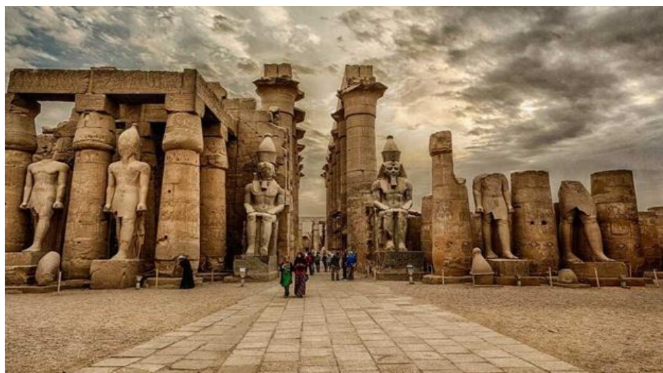
Slika 5. Nalazište u Luksoru

(Slika 5) krase brojni ostaci crkava i muzeji, te je u gradu razvijen turizam baš kao i u Edfu. Problemi s kojima se suočavaju ovi gradovi je prisilno preseljenje populacije kako bi se prilagodili rastućim lokalitetima kulturne baštine, ali s druge strane dolazi do izgradnje i širenja arheoloških lokaliteta što će biti na korist lokalnom stanovništvu (Barry, 2012).