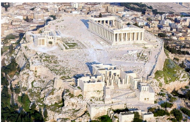
Slika 2. Atenska akropola

Nakon završetka Drugog svjetskog rata počinje se upravljati arheološkom baštinom jer su ratna razaranja za sobom ostavila oštećenja pa se dolazi do arheoloških iskapanja. Zbog fizičkog uništavanja, javlja se potreba za zaštitom arheoloških spomenika na velikim povijesnim mjestima poput Atenske Akropole (slika 2). S obzirom da takvi spomenici imaju edukacijsku vrijednost, naglasak se stavio na njihovu zaštitu jer omogućuju učenje. Onima koji su razvili svijest o arheologiji, pružila se mogućnost arheološkog iskopavanja, a takvi pojedinci su pretežno bili sveučilišni profesori ili oni koji su prezentirali velike spomenike koji su ovu djelatnost obavljali honorarno (Cleere, 2000).