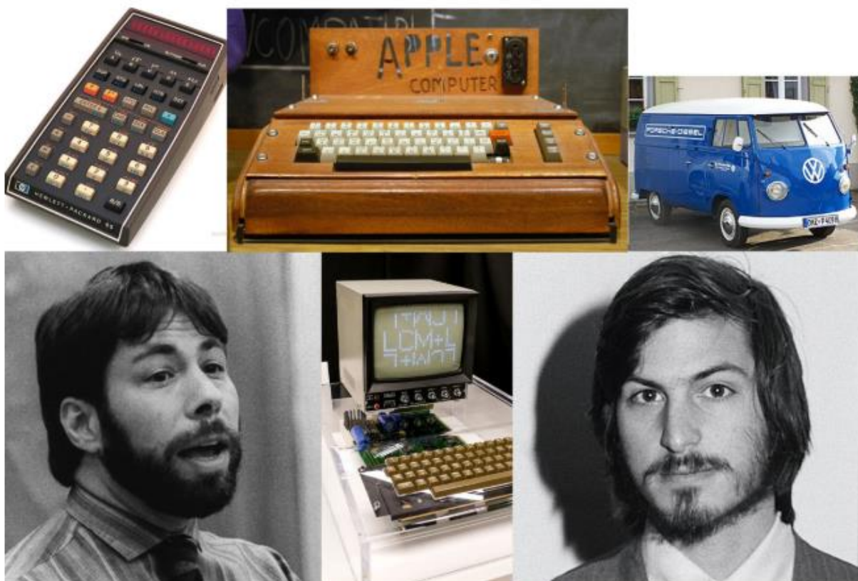
Slika 1. HP-65 kalkulator, Steve Wozniak, Apple 1, VW Microbus i Steve Jobs

U nastavku rada slijedi slika Apple 1 računala kao i prodanog kalkulatora i Volkswagena. na slici su također Steve Wozniak i Steve Jobs.