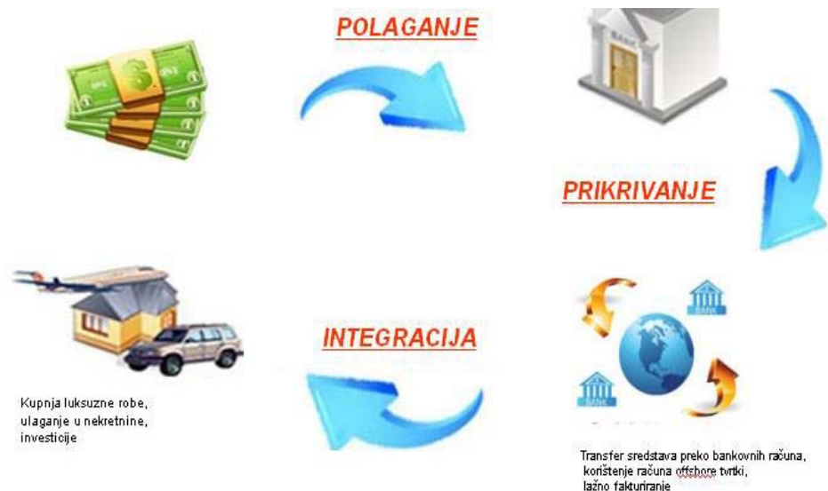
Slika 1 Prikaz tri temeljne faze pranja novca

Navedene faze predmetnog procesa mogu biti posve odvojene, no isto tako ovisno o okolnostima one se mogu odvijati u isto vrijeme, te može doći i do preklapanja.