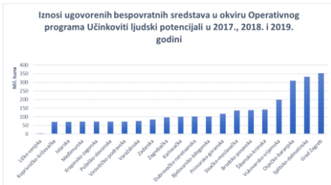
Slika 7 Iznosi u okviru OPULJP

sa 1,31 %. U 2018. godini, iznos ugovorenih bespovratnih sredstava u Splitsko dalmatinskoj županiji bio je 251.704.177 HRK te udio do 17,48% što je stavlja na prvo mjesto po ugovorenim sredstvima u 2018. godini. Na drugom je mjestu Osječko baranjska županija sa iznosom od 178.200.933 HRK ugovorenih sredstava te udjelom od 12,38%, a na trećem mjestu grad Zagreb s 128.911.239 HRK te udjelom od 8,95%. Požeško slavonska i Ličko senjska županija su imale najniže iznose ugovorenih sredstava u 2018. godini. Požeško slavonska je imala iznos od 23.999.140 HRK, udio 1,67% a Ličko senjska 19.930.020 HRK s udjelom od 1,38% te je bila na zadnjem mjestu po ugovorenim sredstvima. Prema iznosima ugovorenih sredstava u okviru Operativnog programa Učinkoviti ljudski potencijala u 2019. godini, Grad Zagreb je predvodio sa iznosom od 87.631.898 HRK i udjelom od 17,44%. Slijede ga Šibensko kninska županija sa iznosom od 49.798.722 HRK te udjelom od 9,91% i Osječko baranjska sa iznosom od 49.179.569 HRK te udjelom od 9,79%. Najniže ugovorene iznose imala je Požeško slavonska županija sa 5.091.830 HRK što iznosi 1,01% te Koprivničko križevačka županija s 3.830.925 HRK ugovorenih sredstava u 2019. godini i udjelom od 0,76%. 39