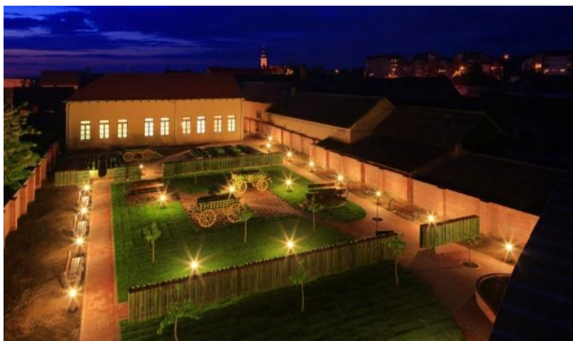
Slika 3 Etnološki centar baranjske baštine

Projekt Etnološki centar baranjske baštine nastao je na inicijativu Udruge Hrvatska žena s ciljem prezentiranja predmeta koji obilježavaju multikulturalnu baranjsku baštinu.