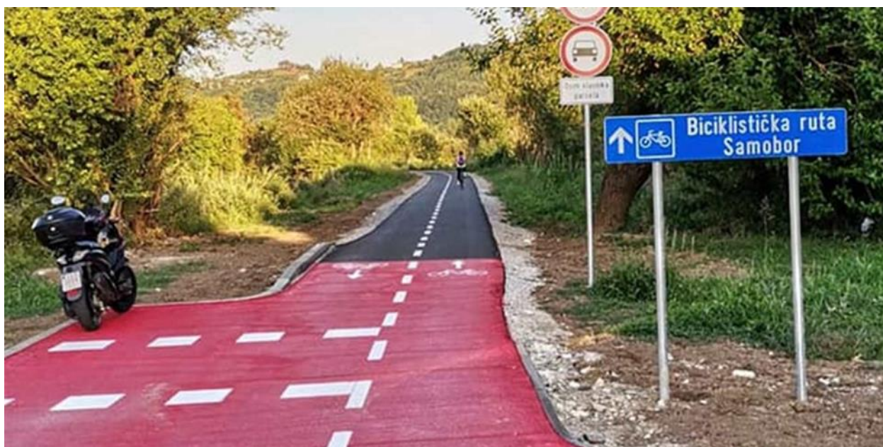
Slika 11 Biciklistička staza Samobor - Sv. Nedelja