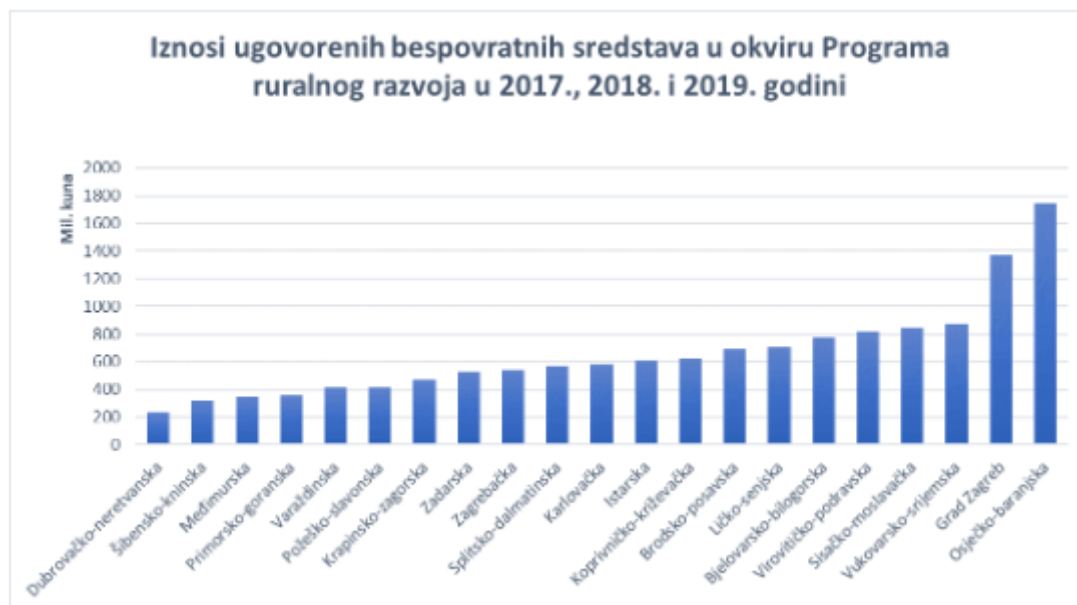
Slika 8 Iznosi u okviru PRR