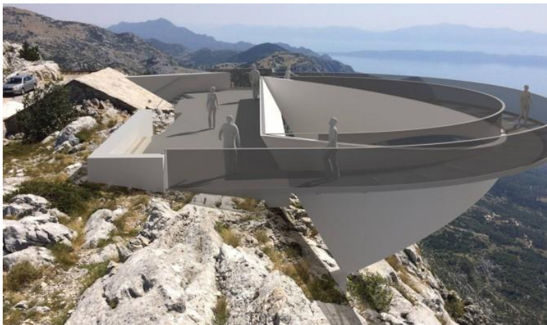
Slika 1 Novi Adrion - Promicanje održivog korištenja prirodne baštine PP Biokovo

Projekt Novi Adrion je uređeni Skywalk vidikovc u PP Biokovo, na predjelu Ravna vlaška koji je imao za cilj povećati broj posjetitelja u PP svojom atraktivnošću i edukativnim programom.