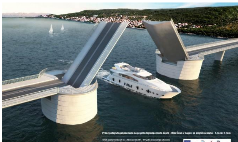
Slika 2 Izgradnja mosta kopno - Otok Čiovo u Trogiru sa spojnim cestama

Cilj projekta je izgradnja mosta kopno - Otok Čiovo s pristupnim cestama. Izgradnja mosta i spojnih cesta dovest će do ubrzanja prometnih tokova, smanjenja zagušenosti i uklanjanja uskog grla, smanjenja štetnih emisija i povećane atraktivnosti regije u turističkom smislu. 3