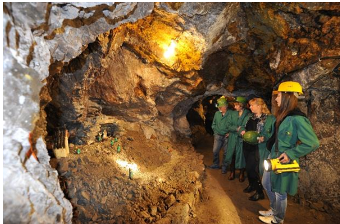
Slika 10 Rudnik Sv. Barbara

hologram, izvršeni su svi radovi na izgradnji interpretacijskog poligona te je 03. studenog 2020. godine dobivena uporabna dozvola te time završen projekt.