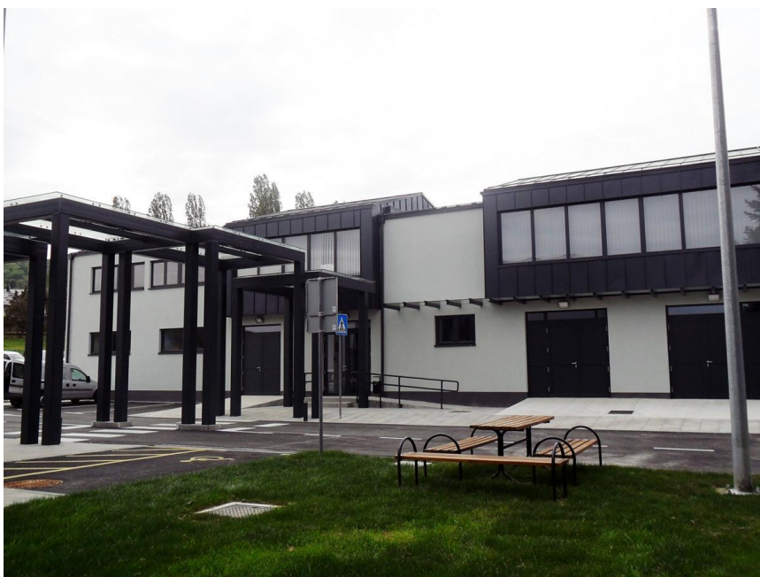
Slika 13 Mali Tehnopolis Samobor

Ostatak intervju fokus je stavljen na pitanja vezana uz projekt Mali Tehnopolis Samobor.