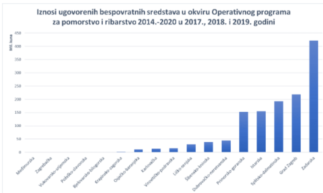
Slika 9 Iznosi u okviru OPRR