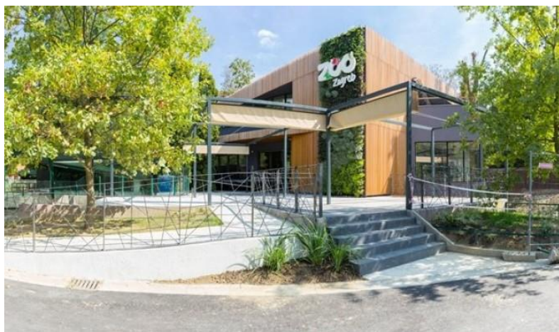
Slika 4 Modernizacija Zoološkog vrta u Zagrebu

Zoološki vrt grada Zagreba djeluje bez prekida 90. godina, te je projektima modernizacije u nekoliko faza uloženo u nove nastambe, novi edukativni centar, te u izgradnju novih kapaciteta za oporavak ozlijeđenih životinja.