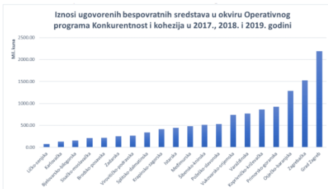
Slika 6 Iznosi u okviru OPKK - 2017., 2018., i 2019. godina

HRK što je 0,66% te Koprivničko- križevačka županija sa 42. 791. 008 HRK što je 0,34%. Gledajući analizu 2019. godine, Grad Zagreb je zadržao prvo mjesto po iznosu ugovorenih sredstava. Iznos koji je bio ugovoren je 6.486.739.831 HRK što je 45,87% i približno povećanje od 100% u odnosu na prethodnu godinu, ali i gotovo pola od iznosa svih ugovorenih sredstava za sve županije 2019. godine. na drugom je mjestu Splitsko dalmatinska županija s iznosom od 2.087.612.613 HRK što je 14,76% te slijedi Osječko baranjska županija s 845.966.018 HRK što je u postotku 5,98%. Najniži dogovoreni iznosi u 2019. godini bili su u Krapinsko zagorskoj županiji sa 68.328.588 HRK što je 0,48% te Šibensko kninska županija s iznosom od 57.267.286 HRK i udjelom 0,40%. 38