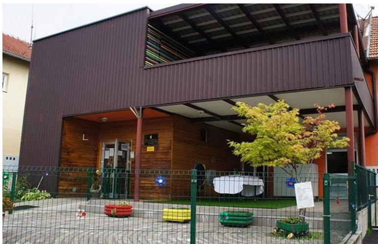
Slika 12 Opremanje Dječjeg vrtića "Grigor Vitez" Galgovo