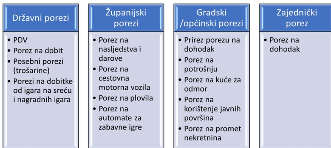
Slika 1 „Podjela prema pripadnosti državnim/županijskim/gradskim/općinskim proračunima“

Na slici 1 prikazana je podjela poreznih oblika u hrvatskom poreznom sustavu prema pripadnosti.