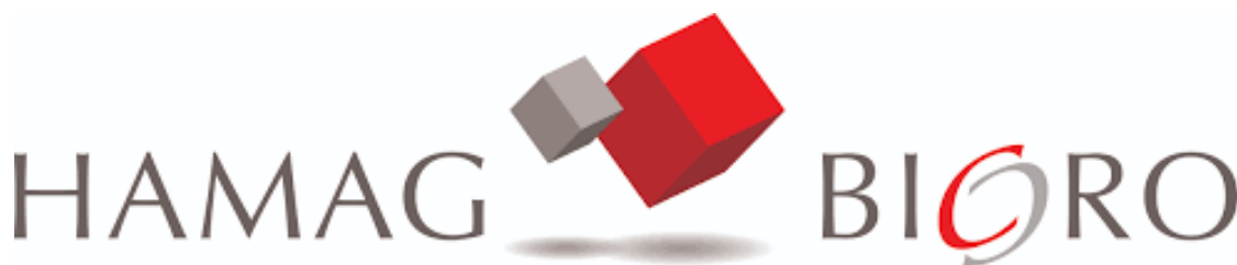
Slika 3. Logo HAMAG-BICRO-a