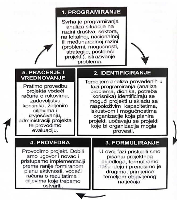
Slika 3. Shematski prikaz projektnog ciklusa