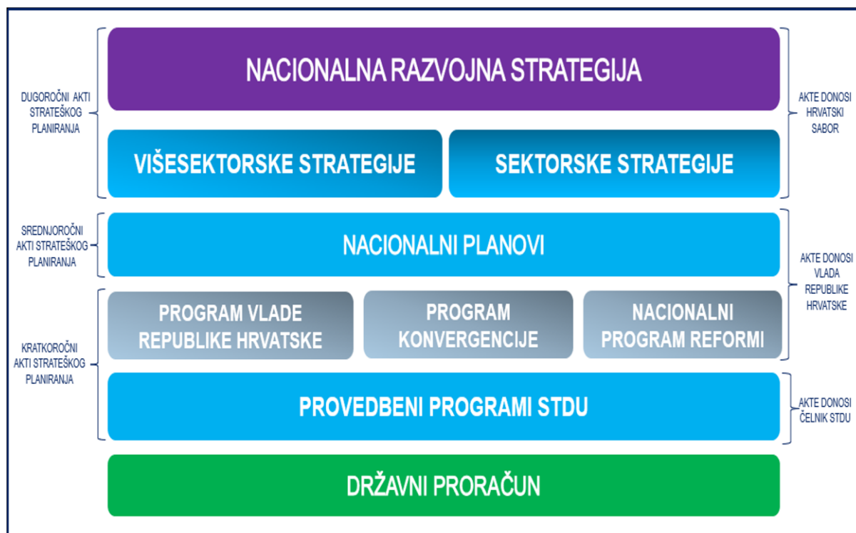
Slika 2. Sustav akata strateškog planiranja na nacionalnoj razini

u desetogodišnjem razdoblju. 6 Posebni propisi ili obvezujući pravni akti uvjetuju izradu sektorske i višesektorske strategije. Za izradu strategije zaduženo je tijelo državne uprave nadležno za oblikovanje i provedbu javne politike u upravnom području za koje se izrađuje strategija. Sektorske i višesektorske strategije na rok važenja od najmanje 10 godina donosi Hrvatski sabor.