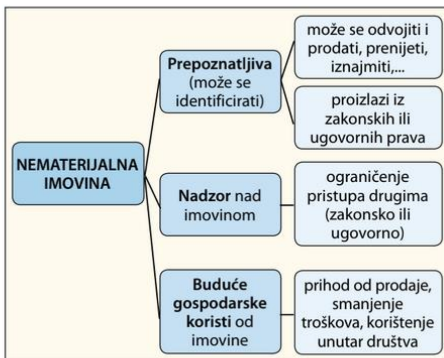
Slika 1: Karakteristike nematerijalne imovine

Prema riječima autorice Brkanić Pongračić, karakteristike nematerijalne imovine su prepoznatljivost, nadzor nad imovinom, te buduće gospodarske koristi od imovine. U nastavku je slika koja prikazuje karakteristike nematerijalne imovine. (Brkanić Pongračić, 2020)