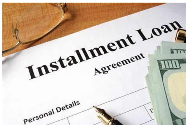
Slika 5. Obročna otplata