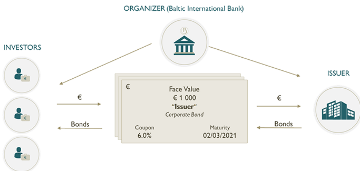
Slika 4. Emisija obveznica

prometom procjenu vrše agencije za rangiranje vrijednosnica kao Standard and Poor's Corporation i Moody's Investor Service sustav rangiranja (tablica 1). Prikaz njihovog rangiranja obveznica prema slovnim ocjenama kvalitete kuća daje tablica 1. Rizik neplaćanja kreće se od nula na državne vrijednosnice do visokih rizika za obveznice koje izdaju tvrtke u financijskim poteškoćama – obveznica s visokim povratima poznatim kao „junk bonds“. Zbog jedinstvene prirode obveznica, obveznice koje emitira ista tvrtka mogu imati različiti rizik i time različitu traženu stopu povrata ka.