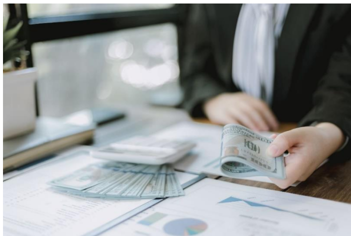
Slika 2. Financiranje