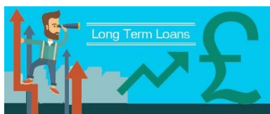
Slika 3. Simboličan prikaz

Vlasnici obveznica nemaju pravo upravljanja, ali njihova prava se mogu definirati kroz odredbe ugovora o emisiji obveznica (dotavljanje financijskih izvješća, inkorporiranje vlasnika obveznica u upravljačku strukturu). (Amidžić, 2018, 99)