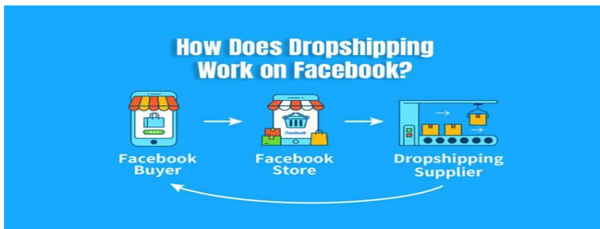
Slika 3 korištenje dropshippinga preko društvene mreže Facebook