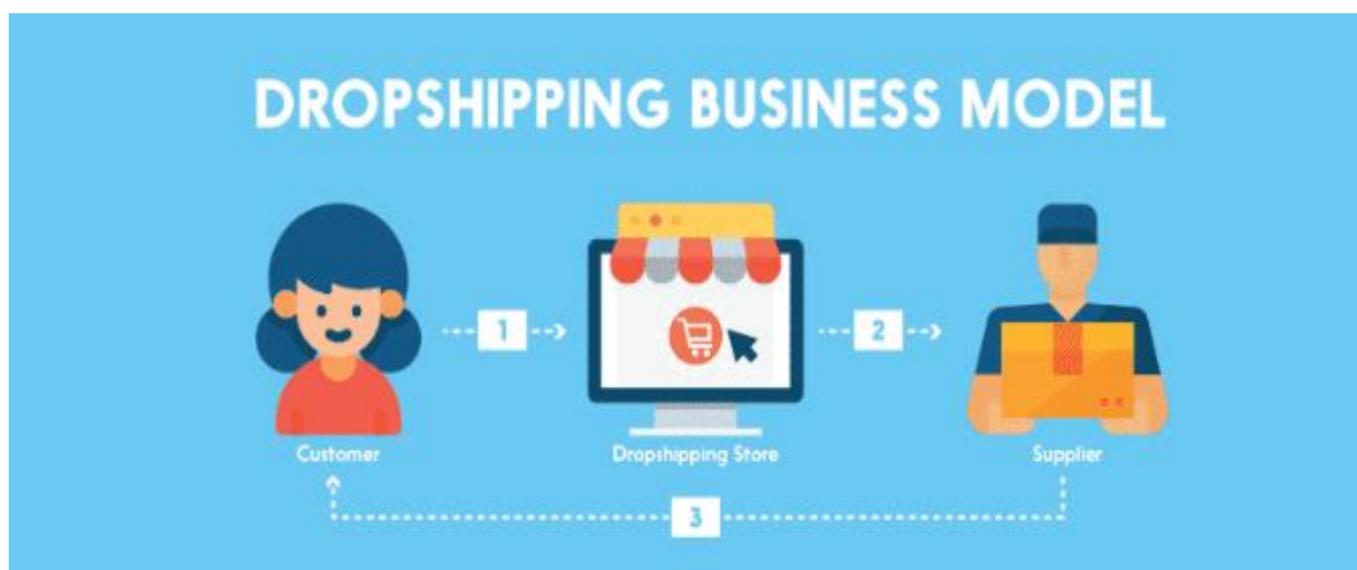
Slika 1 dropshipping poslovni model

nakon čega dropshipper obrađuje narudžbu kako bi proizvodi stigli kupcu u dogovorenom vremenskom periodu. U većini slučajeva krajnji kupci nisu svjesni da se njihova narudžba obrađuje, isporučuje i dostavlja. Kupce najčešće ne zanima na koji je način naručena roba isporučena, već im je bitno da naručeni proizvodi budu visoke kvalitete i da su proizvodi isporučeni u dogovorenom roku isporuke. Kupci ne istražuju previše, već ako im cijena i uvjeti kupnje odgovaraju najčešće kupuju proizvod. Dropshipper-u je u cilju kupce uvjeriti da kupuju proizvode u njegovoj internetskoj trgovini, te mu je u cilju pružiti što kvalitetniju uslugu kako bi povećao zadovoljstvo kupaca. Kvalitetnijom uslugom povećava se povjerenje i zadovoljstvo kupca što povećava šansu ponavljanja kupnje na dropshipperovoj internetskoj trgovini, te zadovoljni kupac može preporučiti internetsku trgovinu ostalim potencijalnim kupcima. Jedan od ciljeva dropshipper-a je povećanje broja zadovoljnih krajnjih kupaca. Povećanje broja krajnjih kupaca povećava ukupni profit dropshipper-a.