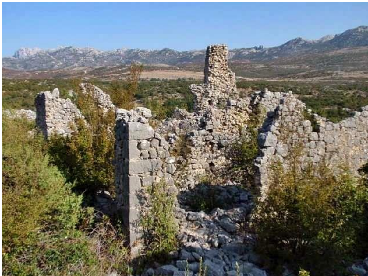
Slika 22: Stari Obrovac i Klisina