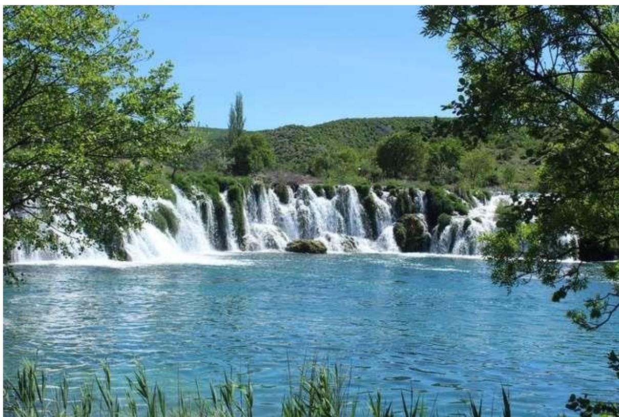
Slika 27: Slapovi rijeke Zrmanje