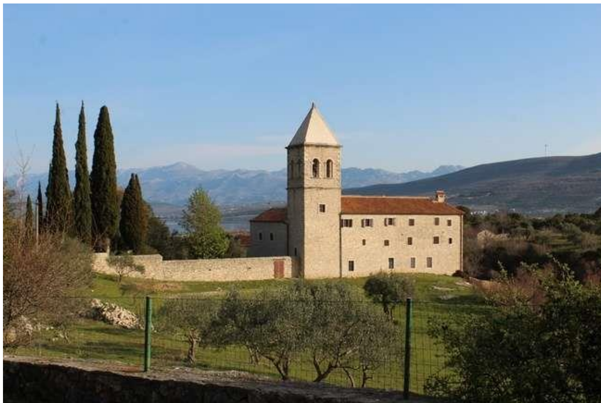
Slika 18: Franjevački samostan Blažene Djevice Marije