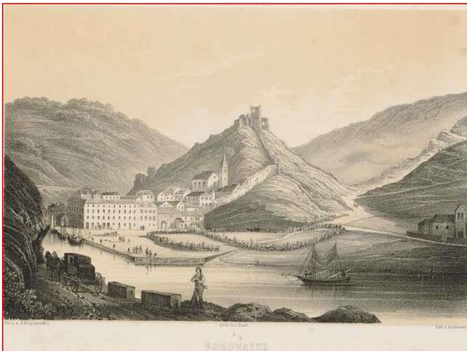
Slika 3: Povijesni prikaz grada Obrovca