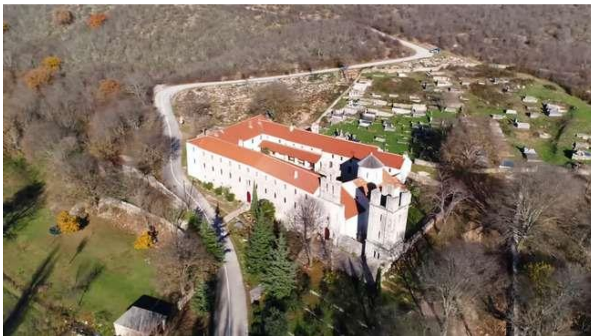
Slika 19: Manastir Krupa