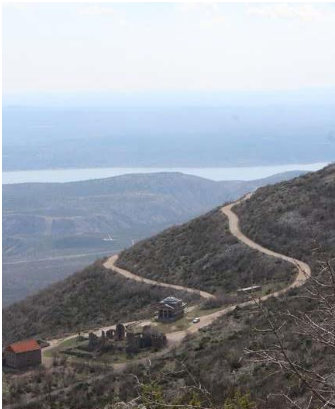
Slika 29: Majstorska cesta