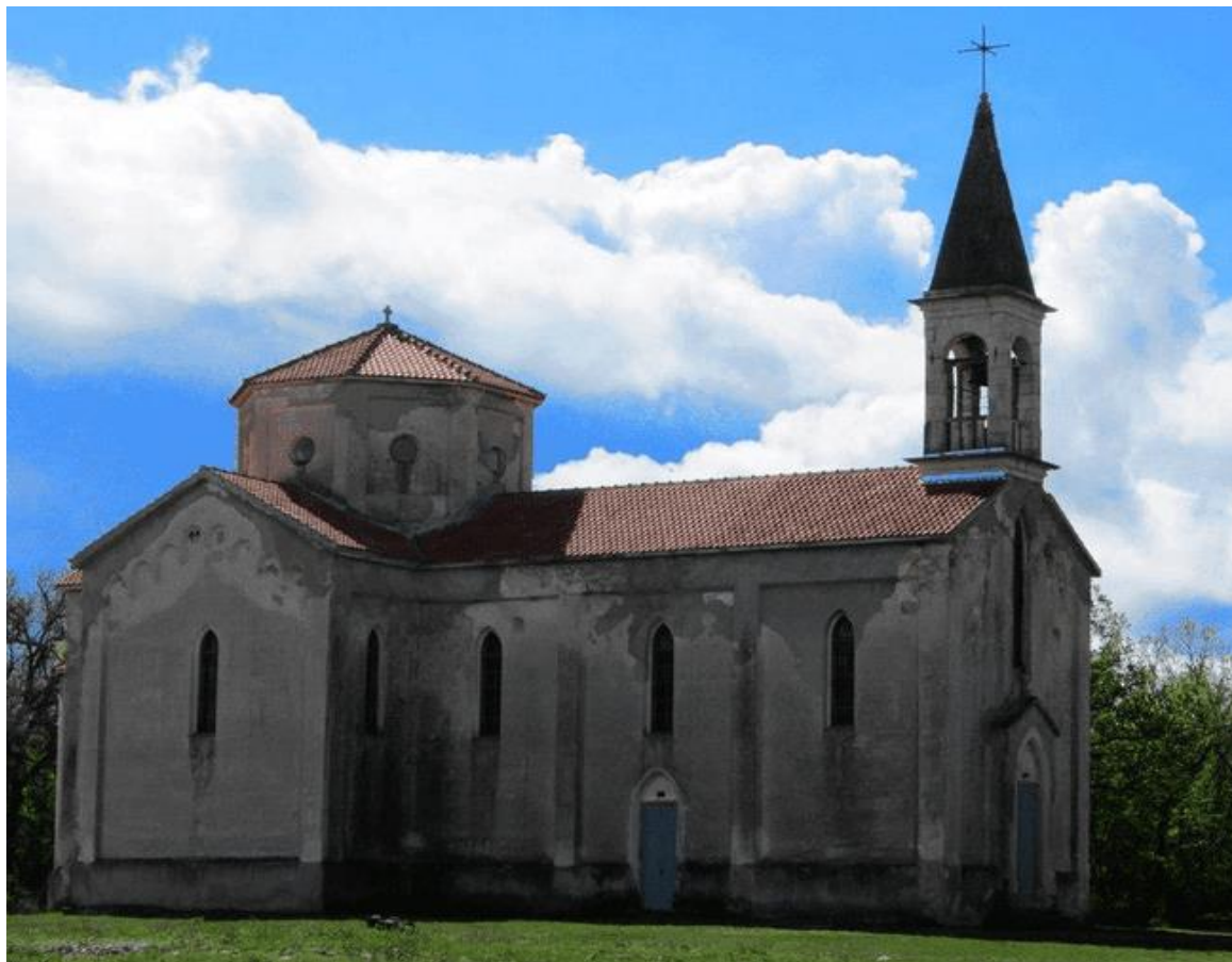
Slika 17: Crkva Rođenja Bogorodice