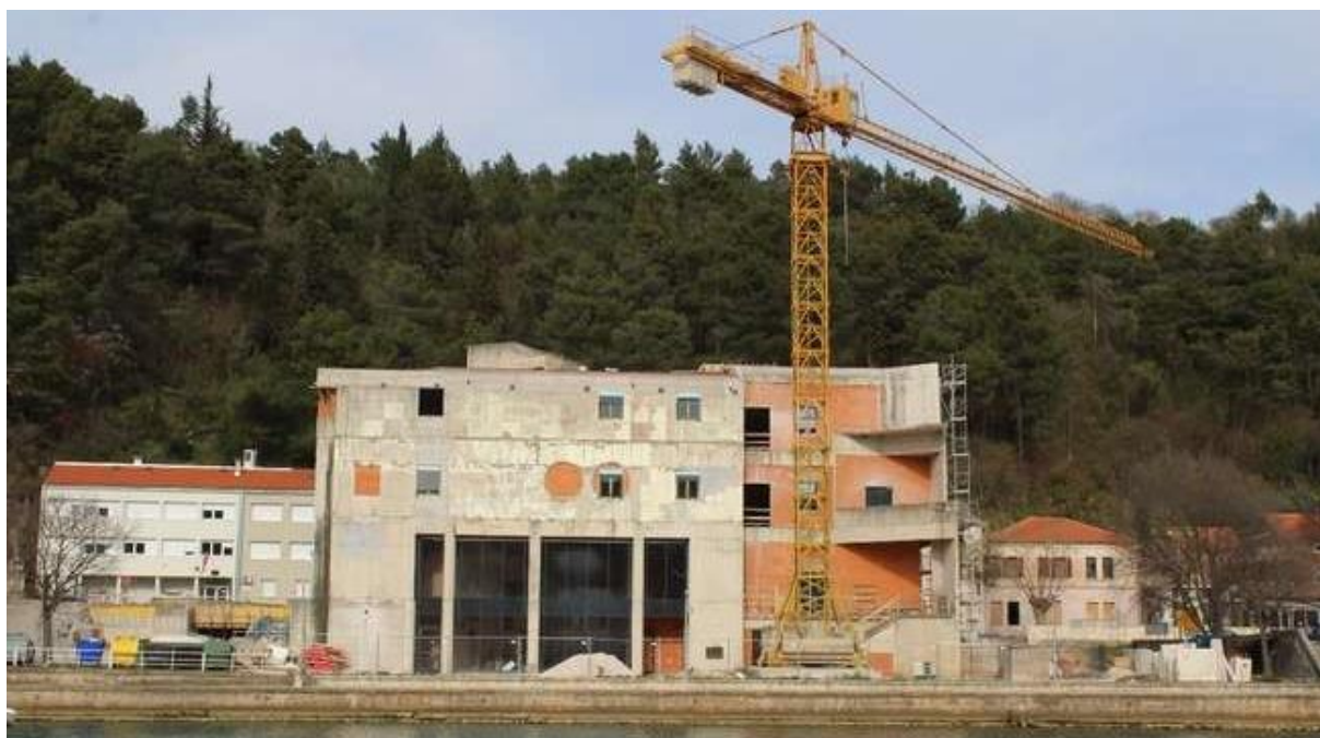
Slika 6: Preuređenje stare robne kuće