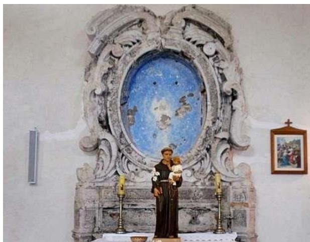
Slika 28: Oltar iz Crkve sv. Josipa