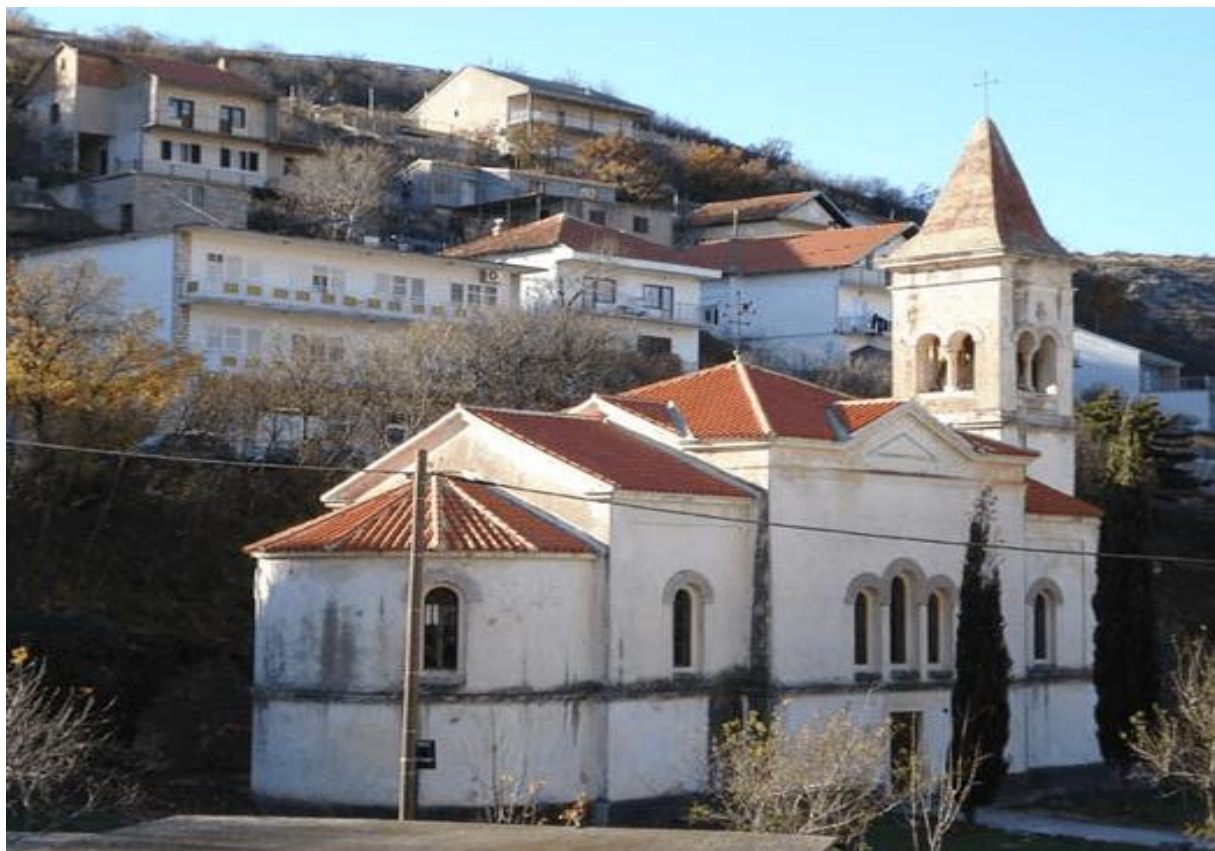
Slika 14: Crkva sv. Trojice