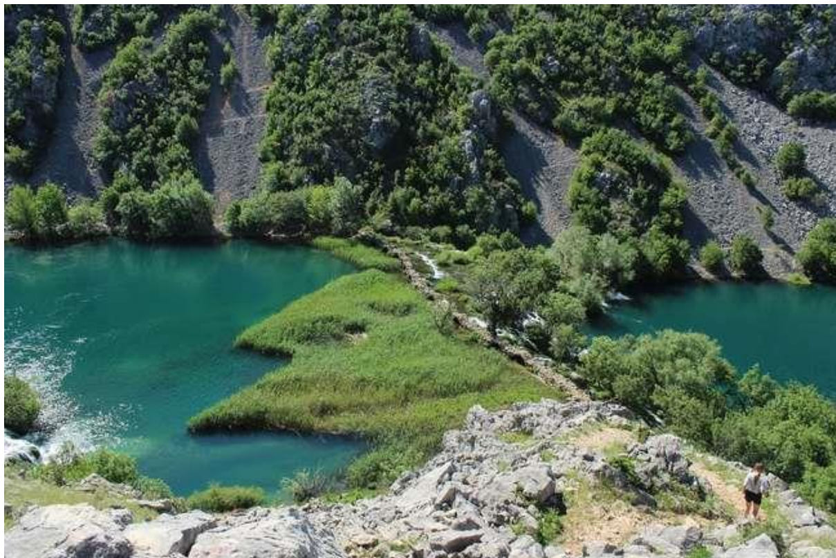
Slika 23: Kudin most