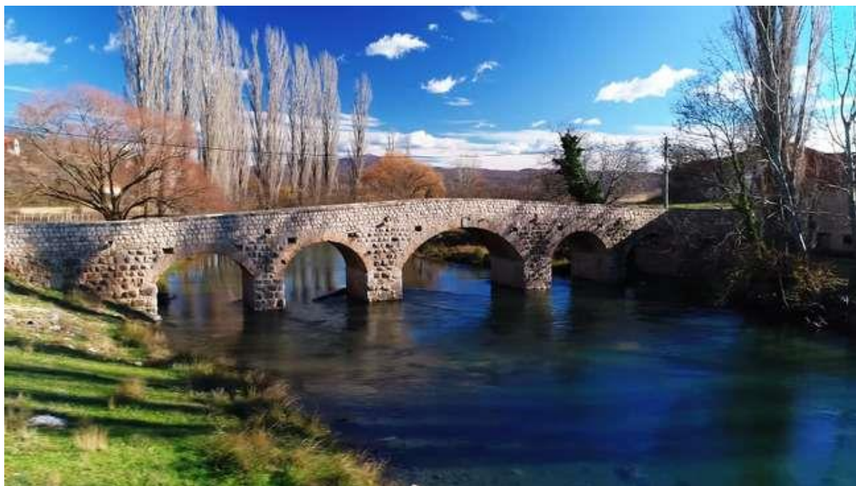
Slika 25: Donji most