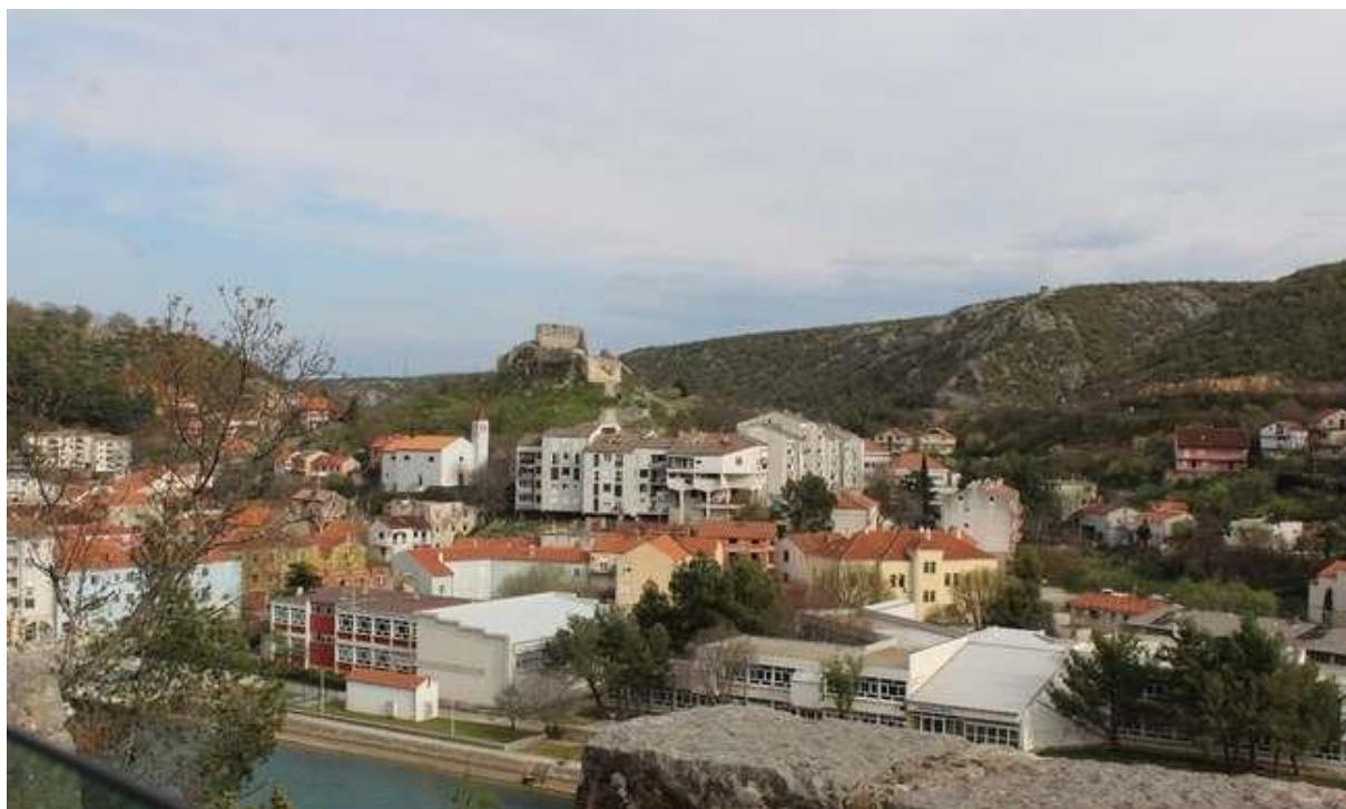
Slika 4: Obrovac s magistrale