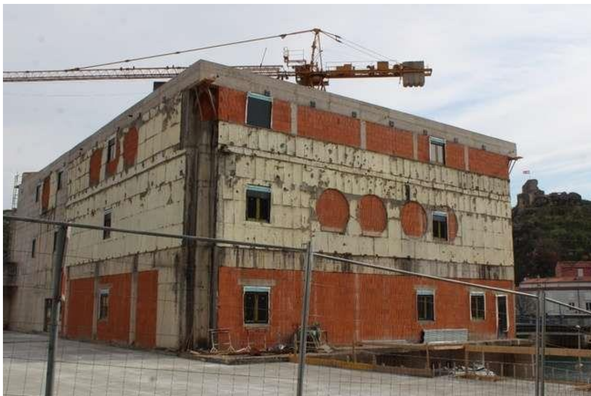
Slika 5: Stara robna kuća