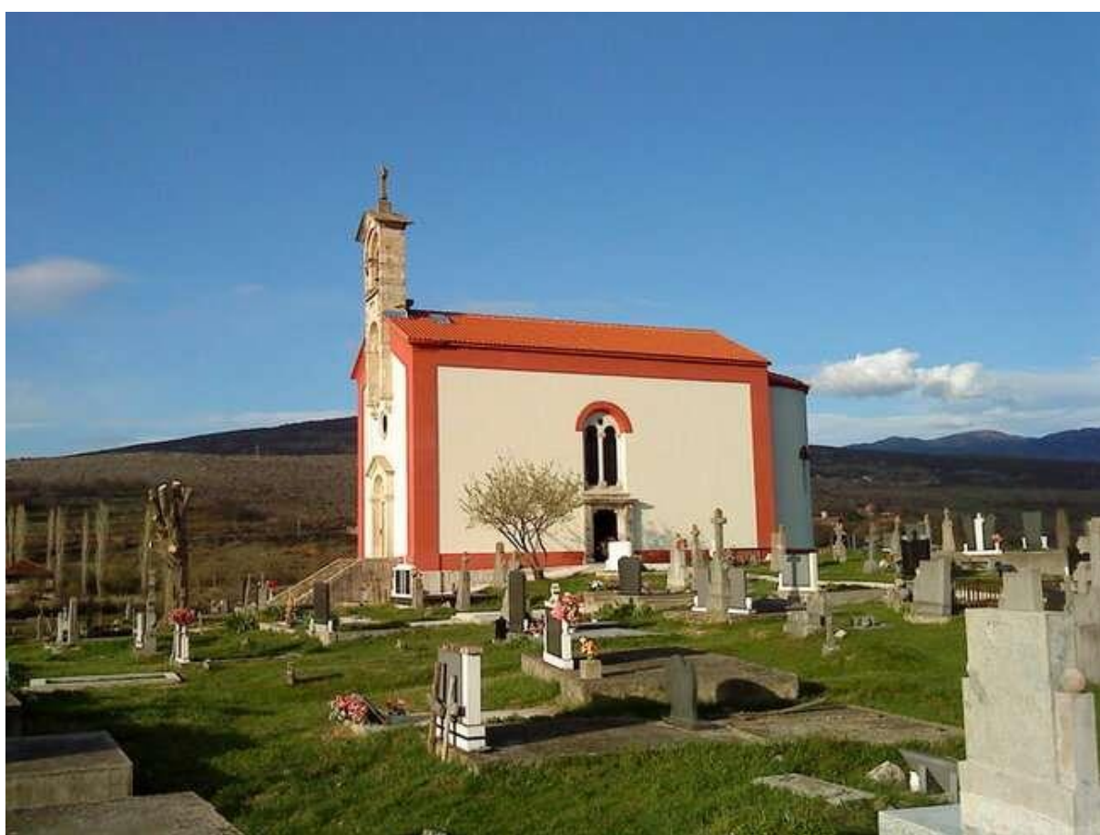
Slika 26: Crkva sv. Georgija

Izvor: (Obrovac.hr, Kulturna baština, n.d.)