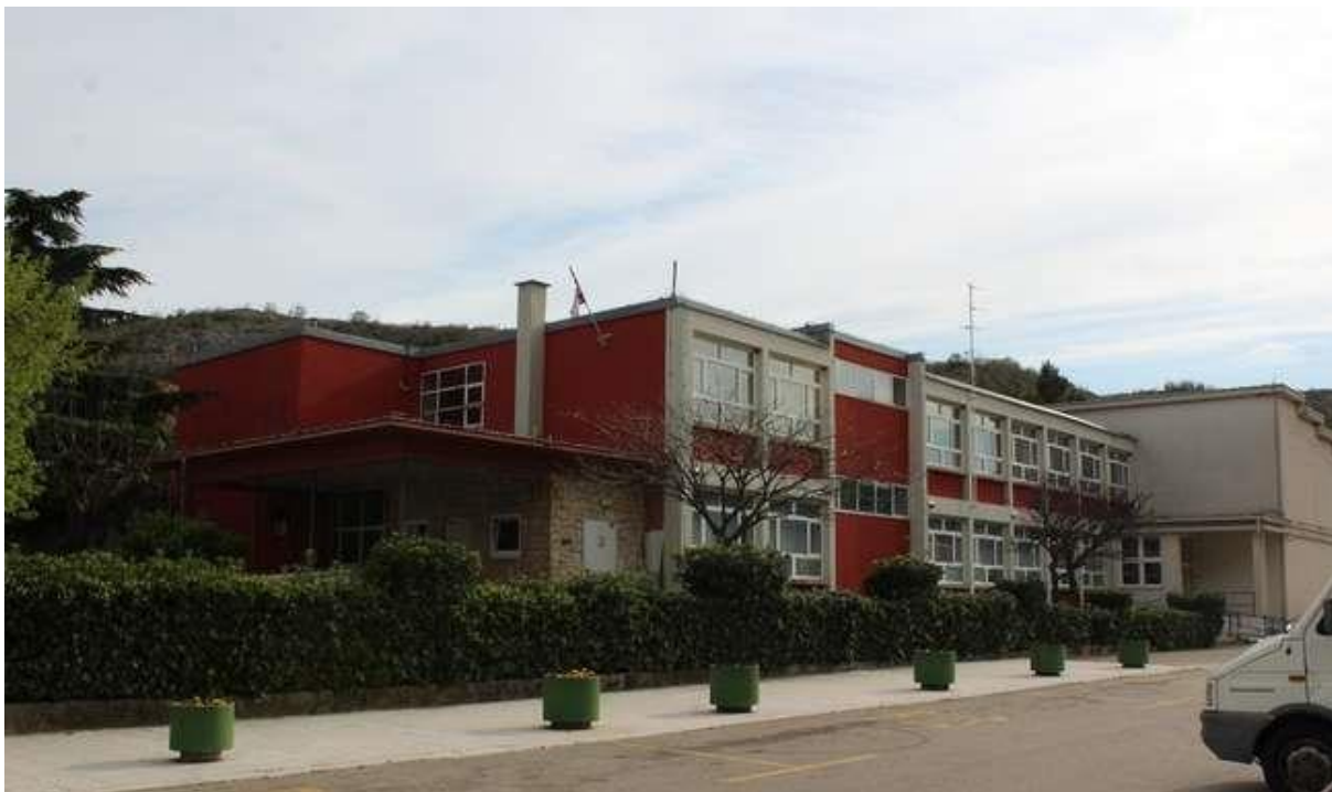
Slika 9: Škola u Obrovcu