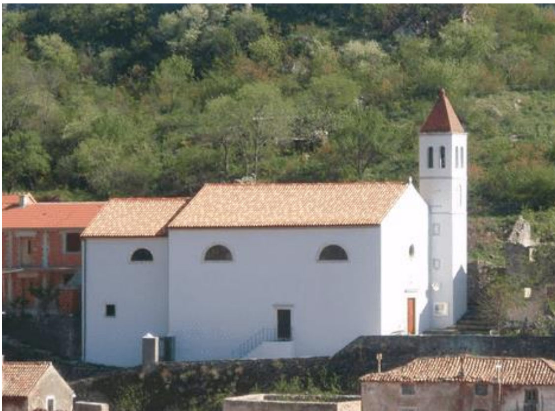
Slika 15: Crkva sv. Josipa