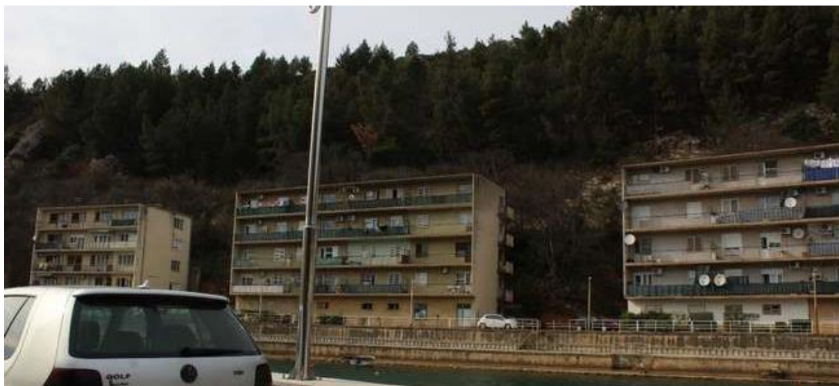
Slika 7: Stare zgrade u Obrovcu