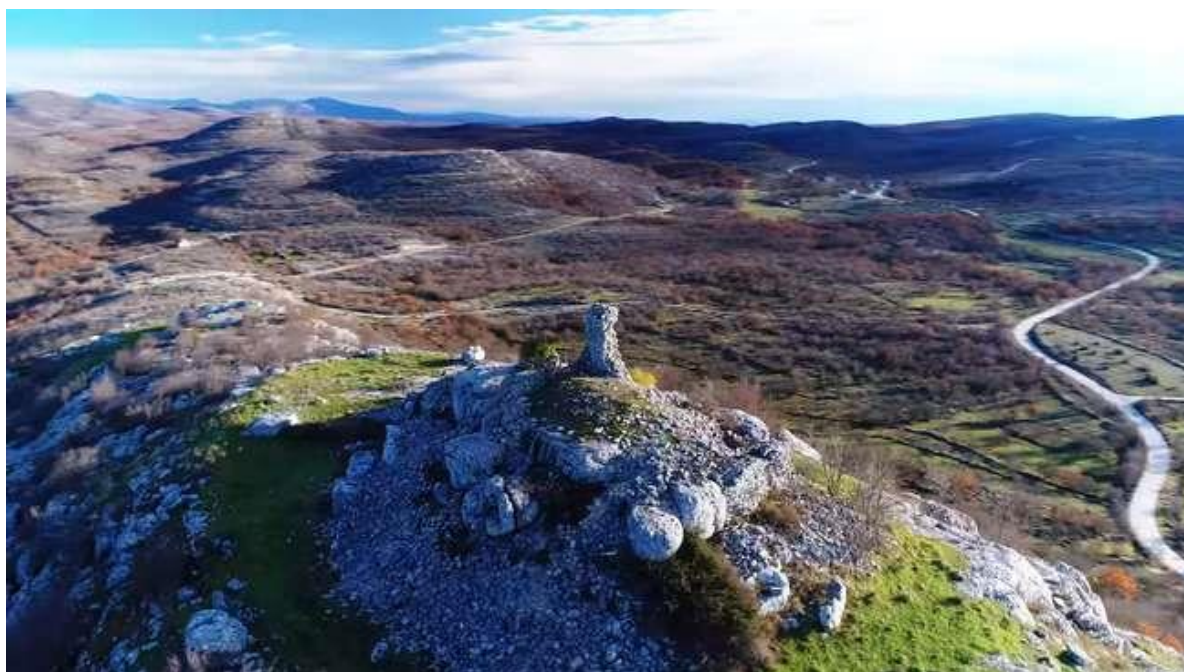
Slika 24: Zelengradina