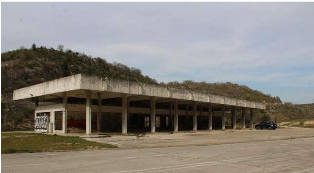
Slika 11: Napušten autobusni kolodvor