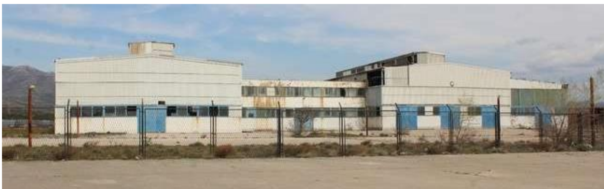
Slika 30: Tvornica Glinice