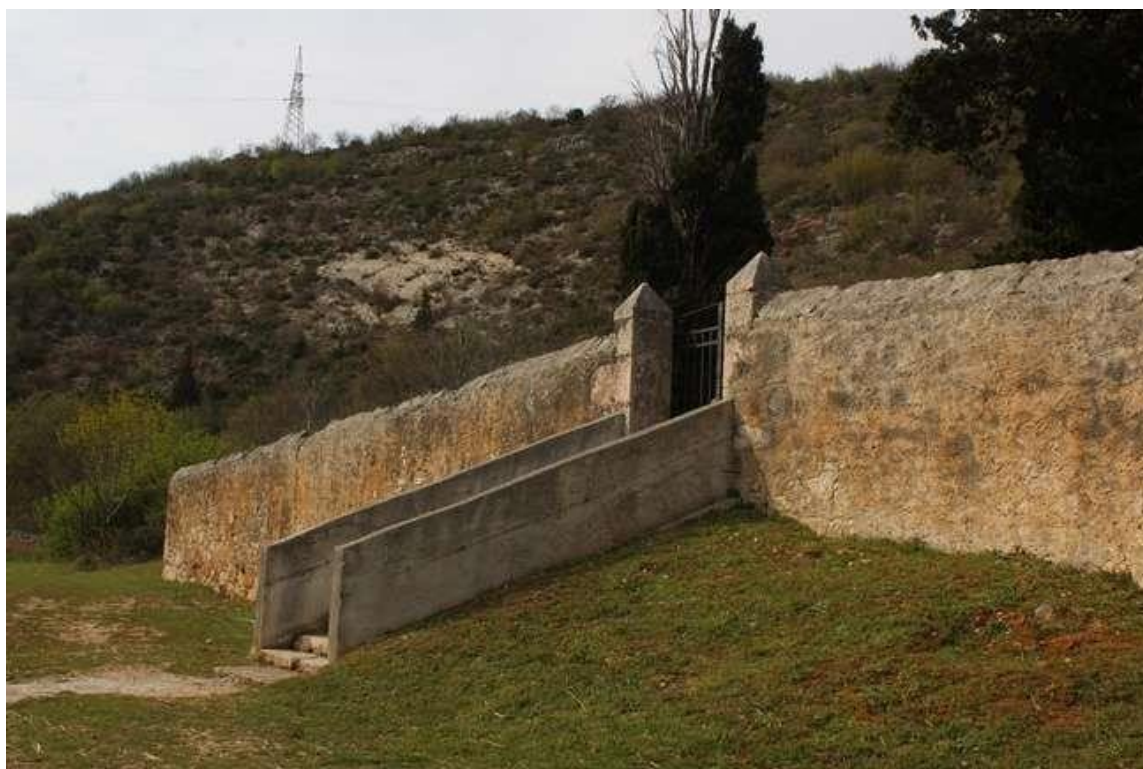
Slika 13: Benediktinski samostan sv. Jurja Koprivskog