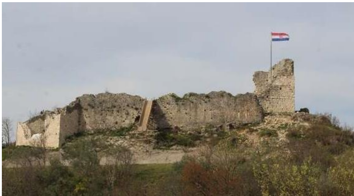
Slika 16: Tvrđava Kurjakovića