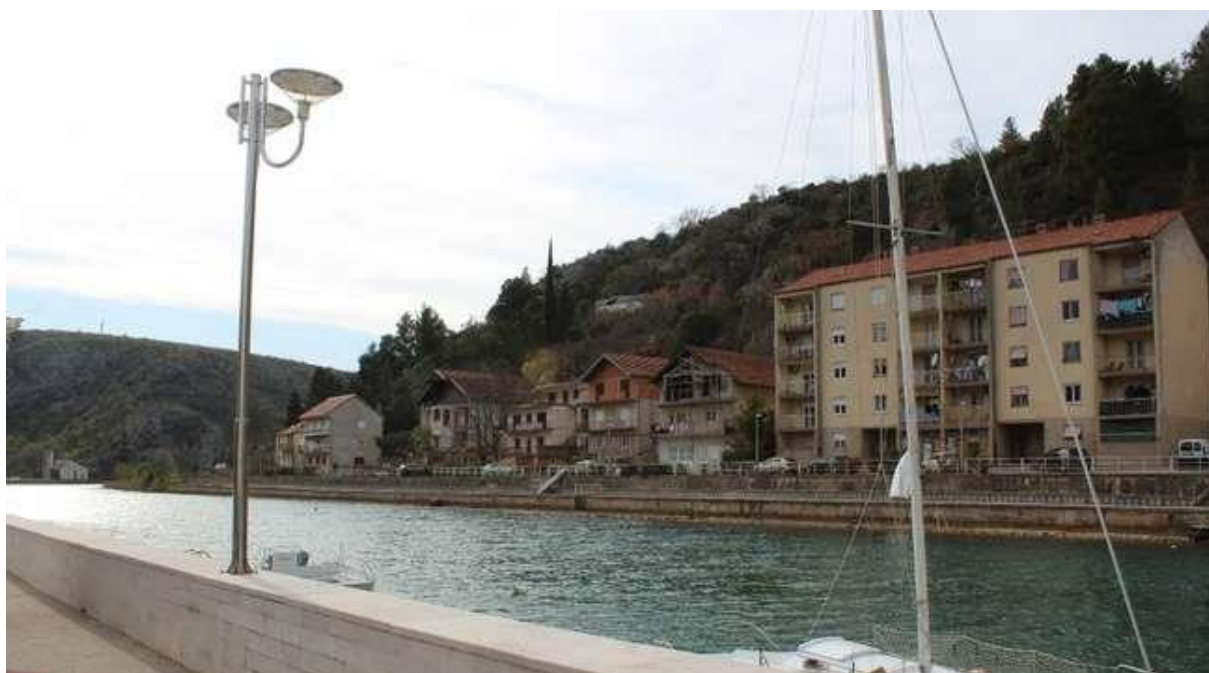
Slika 8: Stare kuće u Obrovcu