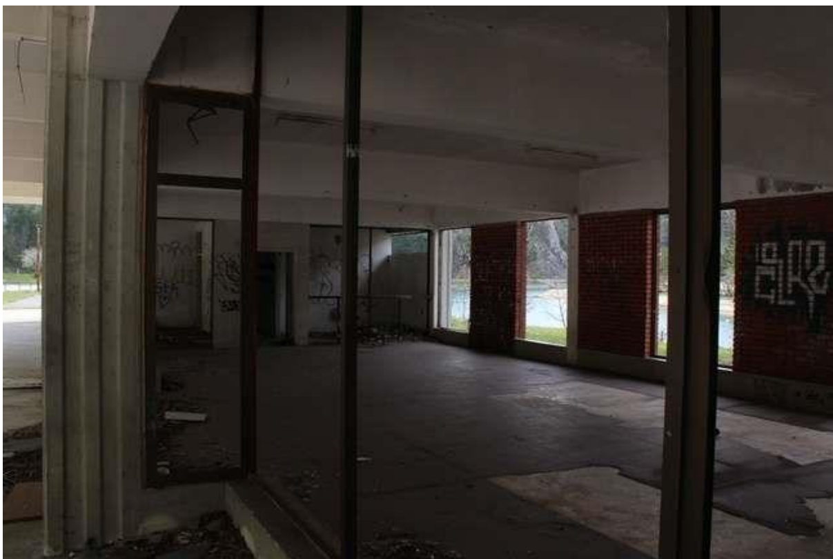
Slika 12: Detalj napuštenog autobusnog kolodvora