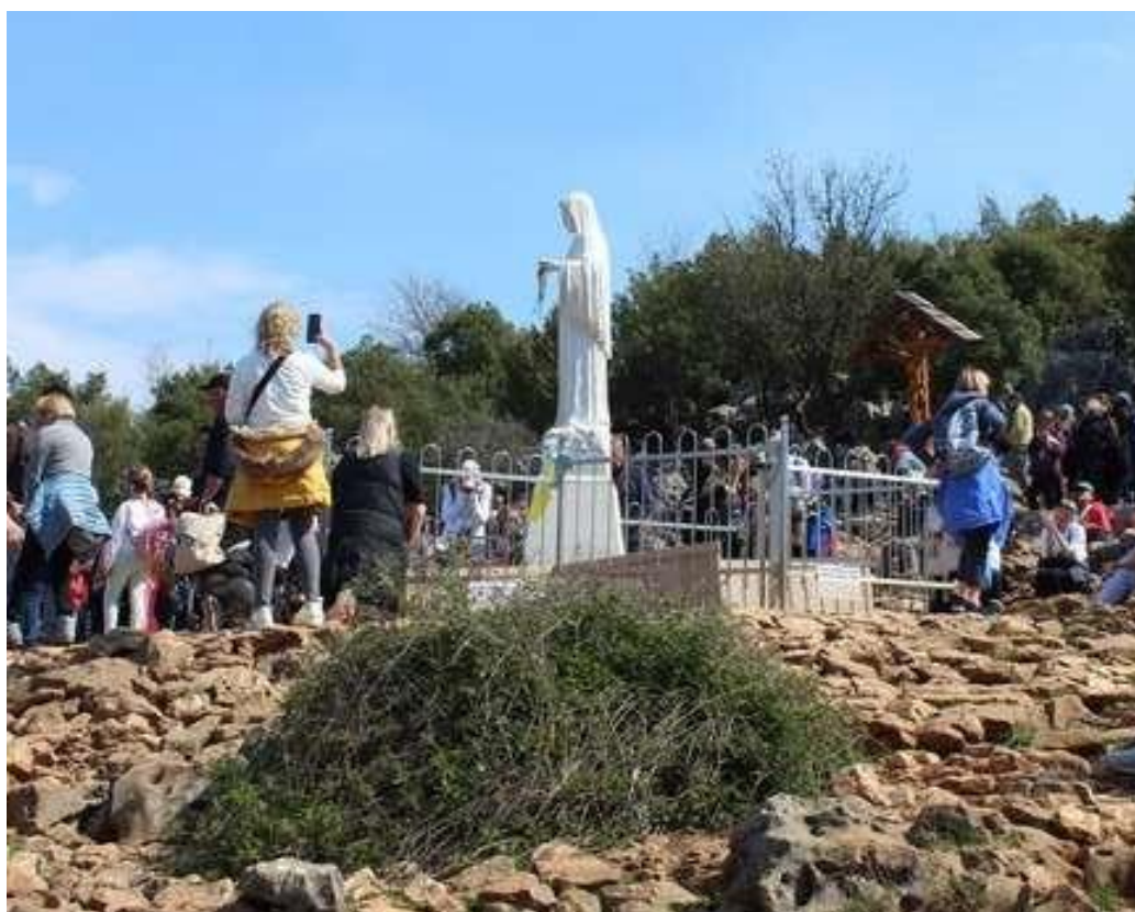
Slika 31: Međugorje

Tijekom proteklih 11 godina, Međugorje je postalo značajno svjetsko hodočasničko odredište, privlačeći veliki broj hodočasnika različitog nacionalnog sastava iz udaljenih mjesta, s različitim motivima i razlozima posjete. Posebno je važan veliki broj svećenika, redovnika i redovnica, osobito iz misijskih zemalja, koji redovito posjećuju Međugorje. Neki svećenici ostaju u Međugorju dulje vrijeme iz različitih razloga. Također, primjećuje se i velik broj mladih hodočasnika, a tradicionalno se održava međunarodni molitveni susret mladih u Međugorju. Hodočasnici često ističu da osjećaju veći mir u Međugorju nego kod kuće. Ovo svjetski poznato hodočasničko odredište uspješno iskorištava svoje resurse i privlačnosti kako bi stvorilo posebno iskustvo za posjetitelje. 27