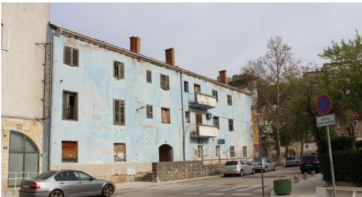
Slika 10: Napuštena zgrada u centru Obrovca