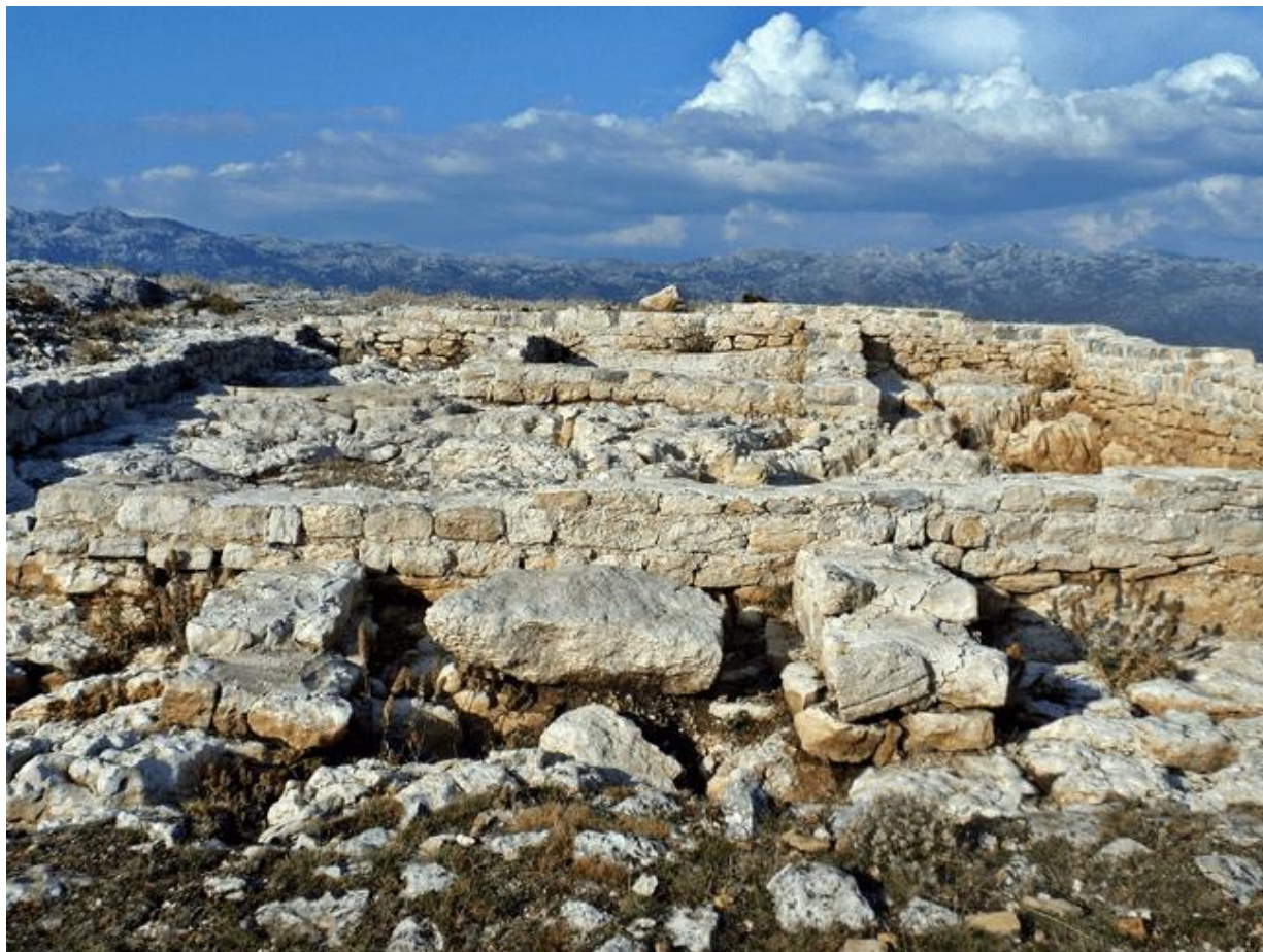
Slika 20: Cvijina gradina

20. stoljeća. Tijekom tih istraživanja, otkriven je hram dimenzija 11,4 m × 6,65 m, čiji su zidovi bili očuvani do visine od 0,70 m do 0,80 m. Također su pronađeni kameni orao i skupina skulptura Jupitera, kao i kupališni kompleks (terme) i dio građevinskog kompleksa s pripadajućim ulicama. Od 1999. godine, Arheološki muzej grada Zadra provodi sustavna arheološka istraživanja na tom lokalitetu. 15