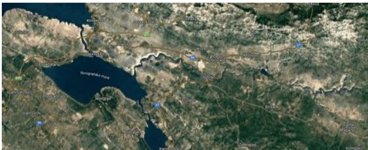
Slika 2: Satelitski prikaz grada Obrovca

Obrovac je maleni grad koji se nalazi na raskrižju puteva između regija Like, odnosno Velebita, i Dalmacije. Smješten je uz rijeku Zrmanju nedaleko od njenog ušća u Novigradsko more. Na području grada Obrovca se nalazi ukupno 12 naselja, koja obuhvaćaju Bilišane, Bogatnik, Golubić, Gornji Karin, Kaštel Žegarski, Komazeci, Krupa, Kruševo, Muškovci, Nadvoda, Obrovac i Zelengrad. 1 Obrovac se nalazi unutar administrativne jedinice Zadarske županije, koja broji ukupno 160.340 stanovnika. Međutim, Obrovac ima relativno manju populaciju s 3.608 stanovnika, što čini samo 2,25% ukupnog stanovništva Zadarske županije. 2