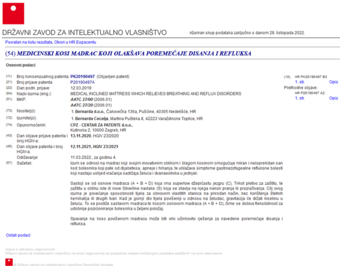
Slika 3. Primjer važećeg patenta 24

Primjer važećeg patenta vidljiv je na slici 3.