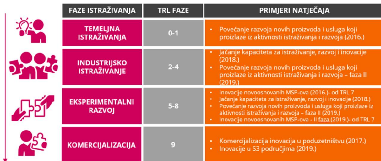
Slika 4. TRL, Razine tehnološke spremnosti 50

Važnost procjene razine tehnološke spremnosti ogleda se u pozivima na dostavu prijedloga gdje je propisano za koju razinu tehnološke spremnosti su navedeni natječaji ili pozivi primjenjivi.