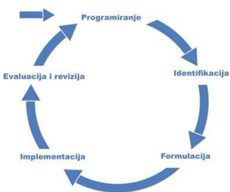
Slika 2 PCM metodologija upravljanja projektnim ciklusom

Pri donošenju odluka i odlučivanju u okviru upravljanja projektnim ciklusom postoji okvir kvalitete kojim se treba voditi, a sastoji se od tri ključna kriterija: relevantan, izvediv, učinkovit i dobro upravljanje projektom.