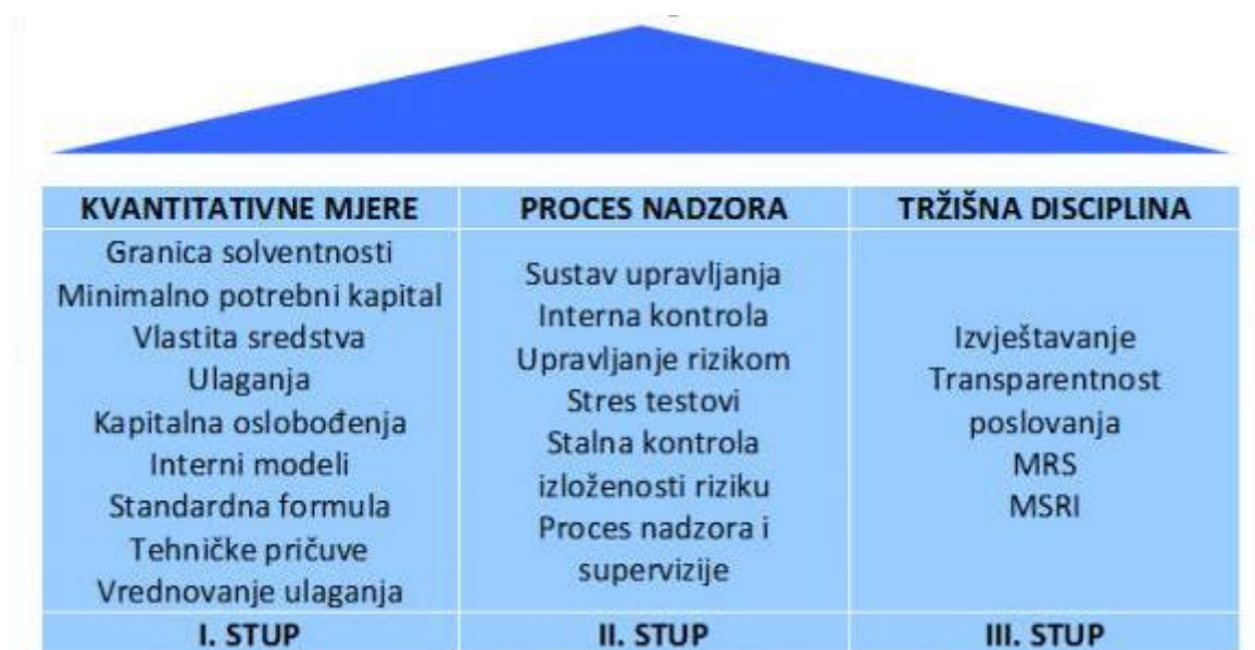
Slika 3: Struktura Solvency II

„U okviru Solvency II, svi rizici u poslovanju društava za osiguranje i društava za reosiguranje trebali bi biti kvantitativno i kvalitativno prepoznati i upravljani. Današnji sustav regulacije adekvatnosti kapitala i granice solventnosti osiguratelja i reosiguratelja u upotrebi je još od 1970., a posljednje izmjene doživio je 2002. godine. Zasnovan je na pravilima i mjerama koje definiraju granicu solventnosti koju moraju ispuniti osiguratelji. To je jednostavan model koji uzima u obzir samo rizik osiguravatelja na principu indeksa premije i šteta“. 8