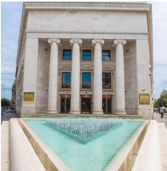
Slika 3. Hrvatska narodna banka