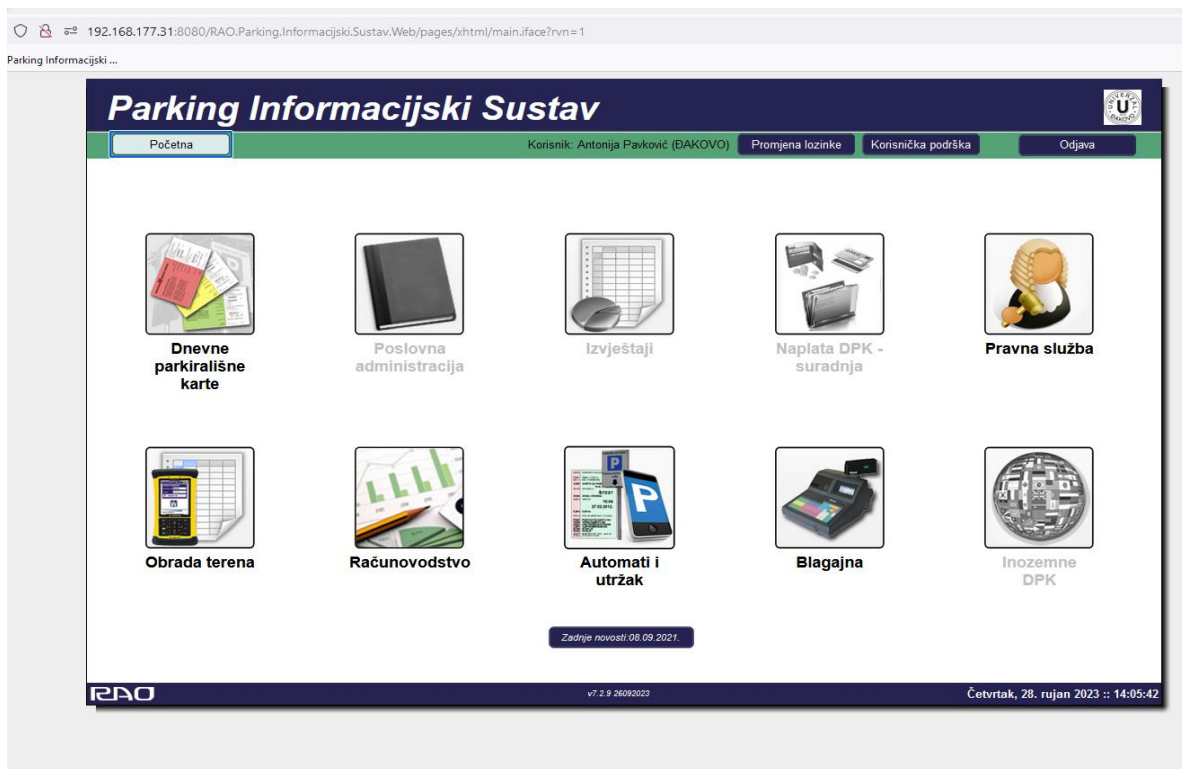
Slika 7. Parking Informacijski Sustav – početna

Za naplatu i kontrolu parkiranja Univerzal koristi informacijski sustav pod imenom RAO.nkp, a koji se nekada prije zvao Park-IS. Prednost ovog sustava je u tome što omogućava i mobilnu aplikaciju, web aplikaciju, integracije, kanale prodaje, LPR – odnosno očitavanje registarskih oznaka putem kamere pomoću mobilnog uređaja bez potrebe za ručnim unosom i/ili video nadzora, scan a car, gps, izvještaje, podaci o vlasniku vozila, prisilna naplata i drugo 66 .