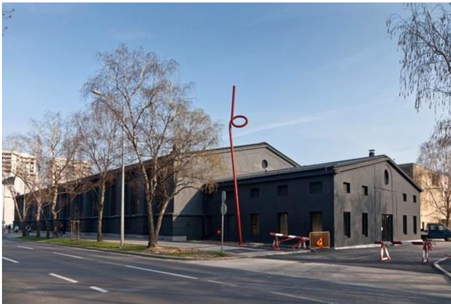
Slika 9. Lauba, kuća za ljude i umjetnost danas.