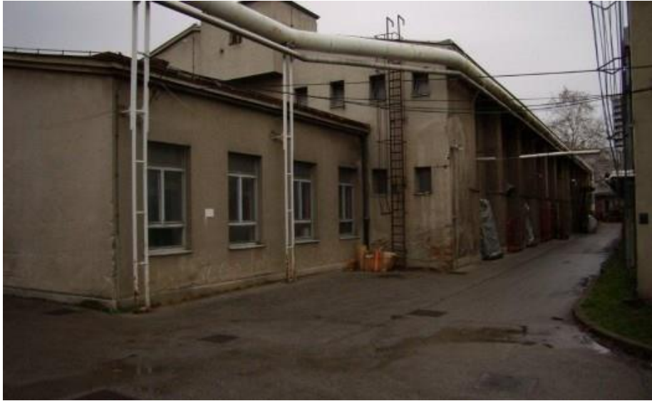
Slika 8. Prostor jahaonice na mjestu buduće Laube, 2007.