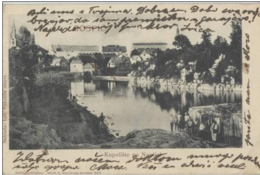
Slika 11. Drveno kupalište zvano „kerep“ na Novčici pokraj mlina 1905. godine.

građana, a sve do danas zadržana je ideja kao i želja da se na njenoj obali realiziraju ne samo šetalište, već i drugi sadržaji. Ovisno o događanjima i u slučaju velikog prometa preko (u 19. stoljeću jedinog) Starog mosta građani su koristili bent (ustavu) uz mlin kao prijelaz preko rijeke.