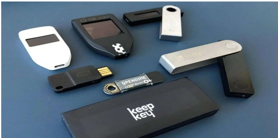
Slika 3 Hladni novčanik