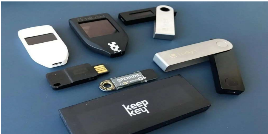
Slika 3 Hladni novčanik