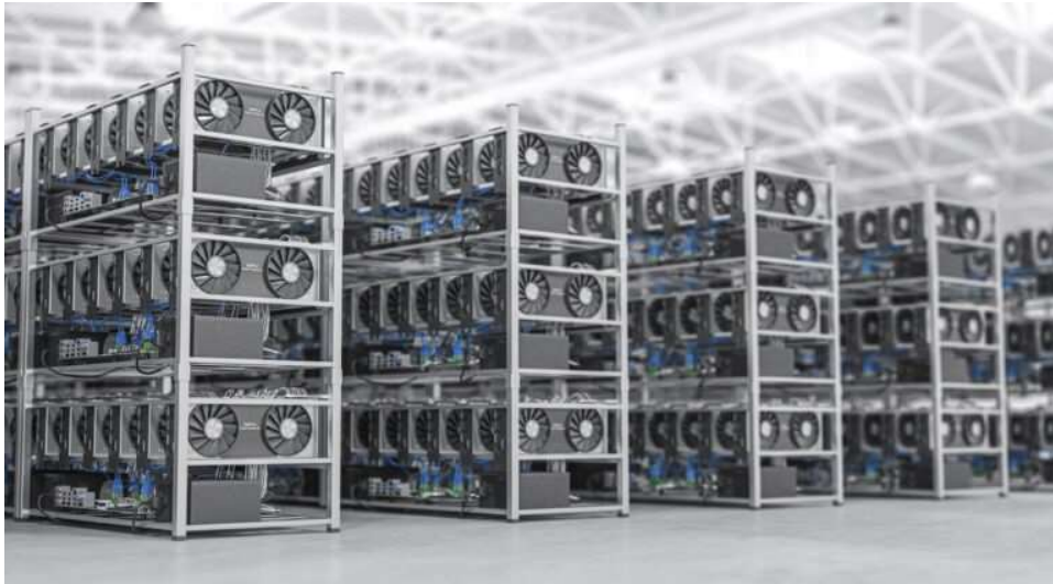
Slika 3 Farma za rudarenje kriptovaluta