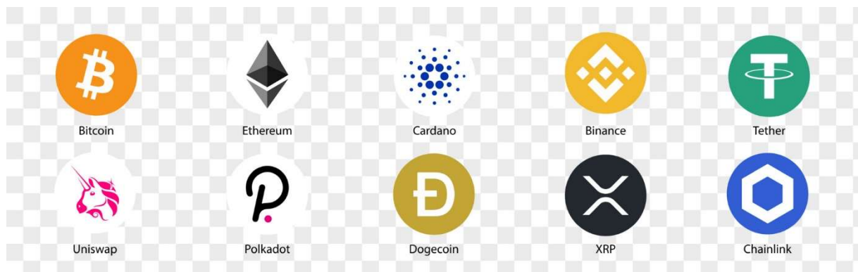
Slika 2 Logo popularnih kriptovaluta

Prema internetskoj stranici Coin Market Cup 6 kriptovalute s najvećom tržišnom vrijednošću na dan 25. 2. 2024. g. su: Bitcoin, Ethereum, Maker, BNB, Solana i dr.