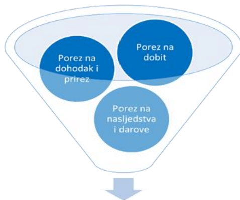
Slika 2 Izravni porezi u Republici Hrvatskoj