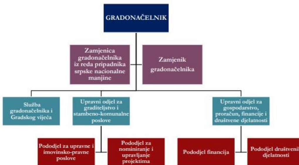
Slika 2. Organizacijska struktura gradske uprave Grada Belog Manastira