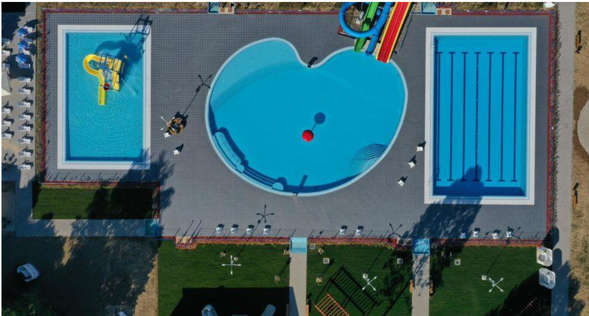
Slika 7. Pogled na gradske bazene u Belom Manastiru iz zraka