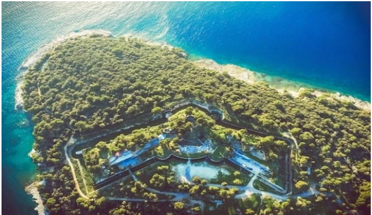
Slika 3 Tvrđava Punta Christo iz zraka