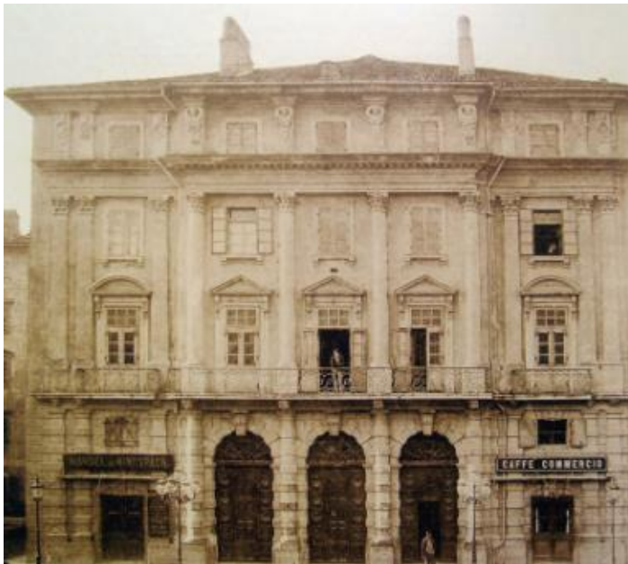
Slika 19 Stara zgrada Adamićevog kazališta

Već spomenuti Teatar Adamić u Rijeci, nakon brojnih požara koji su zahvaćali kazališta diljem Europe, više nije zadovoljavao tehničke zahtjeve te je zbog sigurnosnih razloga postojeće kazalište srušeno, krenuto je u izgradnju nove velebne zgrade na Rječini, na tadašnjem trgu Urmeny. Kao i brojne druge zgrade tog vremena i ova je naručena kod arhitekata Helmera i Fellnera u Beču.