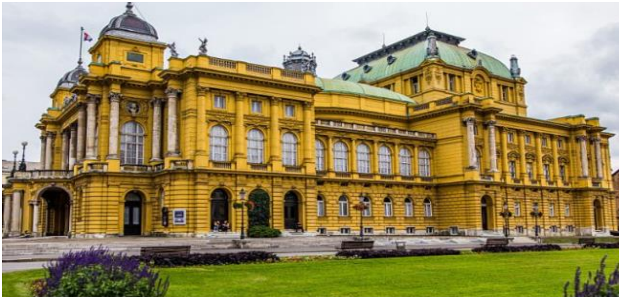
Slika 12 Hrvatsko narodno kazalište u Zagrebu

Svečani zastor je naručen od Vlahu Bukovca te je u javnosti poznat kao „Hrvatski preporod“, iako mu je službeni naziv bio „Preporod hrvatske književnosti i umjetnosti“. Na samom zastoru, Bukovac je prikazao Gundulića kako prima prvake kulturnog i političkog života hrvatskog preporoda u predvorju antičkog hrama. Prva izvedba uprizorena je 14. listopada 1895. godine djelom Zajčeve opere „Nikola Šubić Zrinski“ uz Miletićev prolog „Slava umjetnosti“. (Batušić, 2019: 223-228)