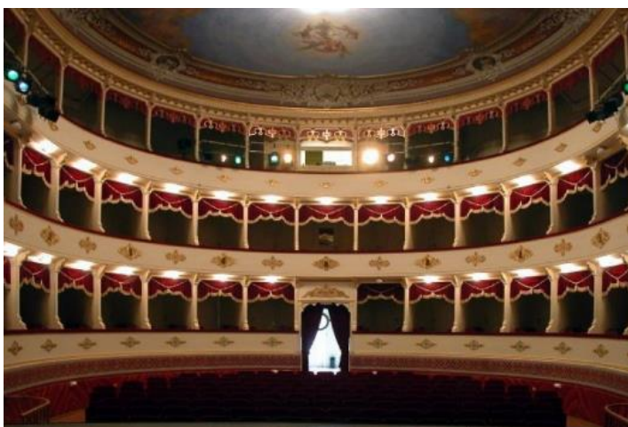
Slika 16 Zgrada šibenskog kazališta