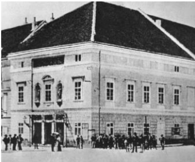
Slika 11 Stankovićevo kazalište na Markovu trgu u Zagrebu