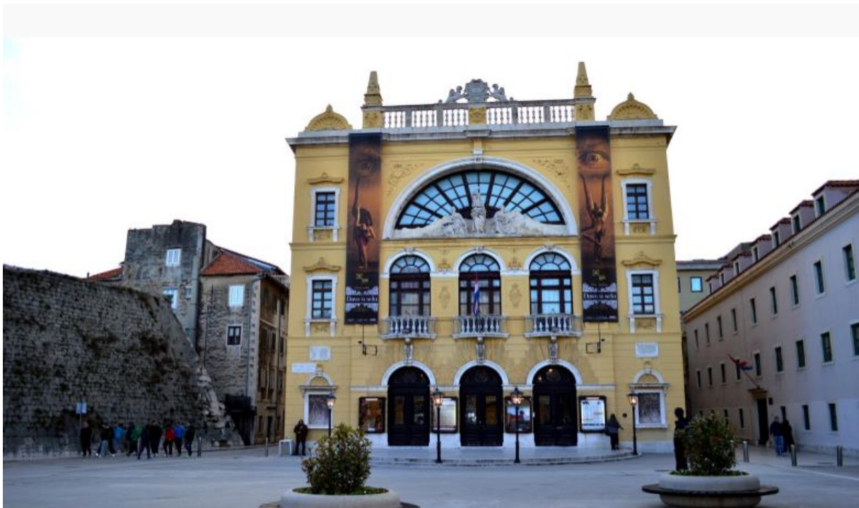
Slika 18 Splitski HNK

13. veljače 1970.zgrada je uništena u velikom požaru koji je zahvatio kompletno gledalište. Obnova uništenog kazališta, trajala je dugih deset godina, a za to vrijeme, predstave su održavane na zamjenskim lokacijama. (Batušić,2019:306-312)