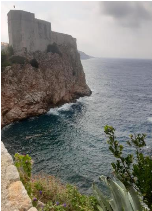
Slika 27 Pogled na utvrdu Lovrijenac iz parka Gradac

Osim već navedenih djela i autora Dubrovačke ljetne igre su kroz nadolazeća desetljeća kroz svoj prvenstveno ambijentalni izričaj unutar svojih tvrđava, parkova i ulica, luke u kojoj je izvedena Goldonijeva Ribarska svađa, pa u novije vrijeme i drugih prostora poput kamenoloma u kojem je izvedena Ulyssesova Antigonu, igre podjednako uspješno uprizoruju i renesansne komedije kao i crkvena prikazanja s kojima možemo i reći da je i započela povijest hrvatskog kazališta. Svakako se ne smije izostaviti niti palača Sponza, te ljetnikovac u Gržu koji su svakako autentični ambijentalni prostori.