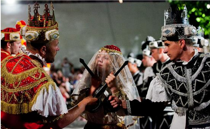
Slika 4 Prikaz korčulanske Moreške

Od utjecajnih osoba renesansnog kazališta svakako moramo spomenuti Marina Držića koji je ostavio veliki osobni pečat u stvaranju kazališnog života, a na što je zasigurno imao utjecaja njegov boravak u Sieni gdje je studirao a ujedno je bio i vicerektor sveučilišta. Držićevim povratkom u Dubrovnik, on nastavlja sa svojim dramskim stvaralaštvom, a istovremeno iz Mletaka u Dubrovnik stiže i bogata kolekcija od preko sedam stotina knjiga te otvaraju široku lepezu mogućnosti onkraj do tada tek dvadesetak poznatih izvođenih dijela. Držić ujedno okuplja i afirmira raspršene kazališne snage oko svojih dramskih pothvata. Nije naodmet spomenuti i „Pomet“- prvu kazališnu družinu koju je osnovao Držić davši joj ime po izgubljenom komediji. Nadalje Držić uprizoruje i Dunda Maroja, Novelu od Stanca, obje Tirene te pirnu dramu Venera i Adon. (Batušić,2019:22-25)