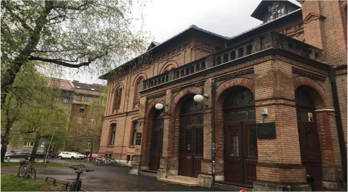
Slika 23 Akademija dramske umjetnosti u Zagrebu

Istupanje iz zadanih okvira i veliku promjenu donosi 1953.-a godina kada se osniva Zagrebačko dramsko kazalište koje se stvara nakon određene liberalizacije kulturne politike i kulturnog života, ponajprije misleći na političko odvajanje od informbiroa koje je nosilo određeni odmak od tadašnjeg socijalističkog realizma, a svakako je potrebno kao važnu kariku dodati i Krležin referat na kongresu Saveza književnika održano u Ljubljani, gdje su ta nastojanja doživjela svoj vrhunac.