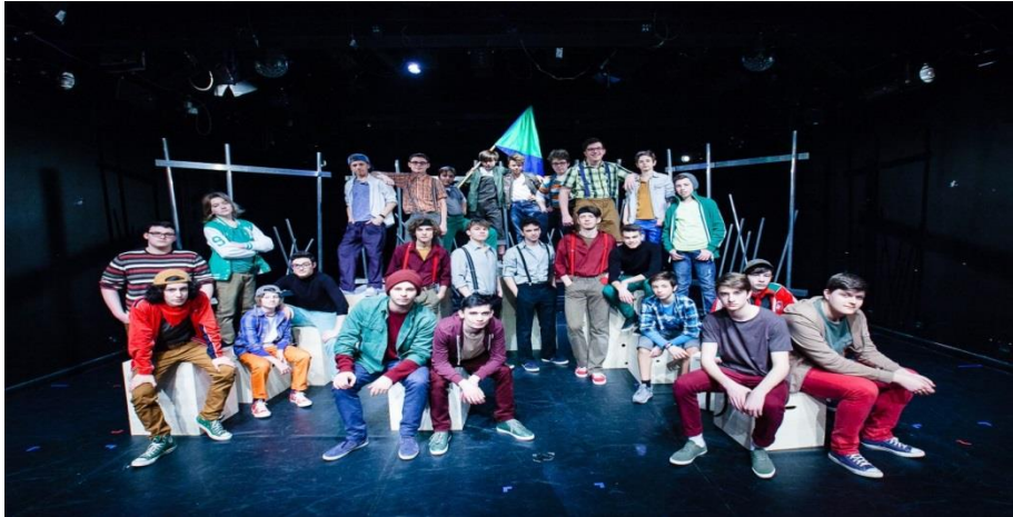
Slika 25 Mlade snage ZKM-a, prije izvođenja Pavlove ulice

Bitna odlika suvremenog stvaralaštva, svakako je transmedijski izričaj umjetnika koji najavljuje velike promjene svojom pojavom od 60-ih godina prošlog stoljeća, no sama pojava primjerice televizije iako donosi i pozitivne promjene u samom razvoju drame, s druge strane nosi i negativne konotacije zbog sve veće borbe kazališta za publikom. (Batušić,2019:475)