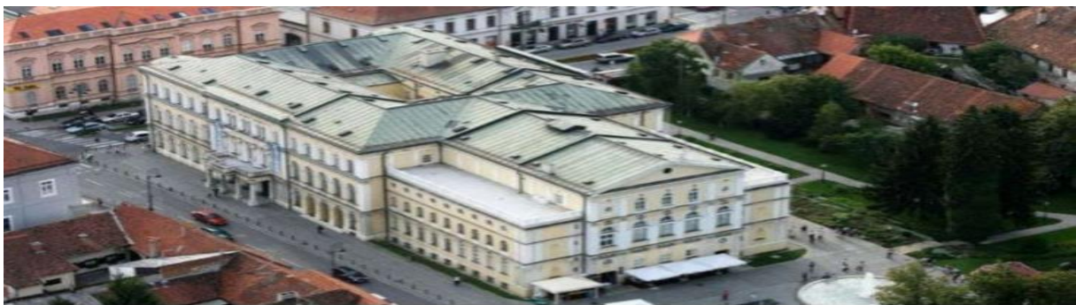
Slika 17 Zgrada HNK Varaždin

Kada govorimo o uređenju samog kazališta, tu je Helmer vanjsko uređenje oblikovao po načelu strukturalne iskrenosti s vidljivom trodijelnom kompozicijom prostora odnosno dvorana-komunikacije-dvorana. Fasada je ukrašena novo-renesansnim obilježjima, pritom bez jasnog isticanja glavnog pročelja prema ostalim pročeljima. Nakana je bila da okolina ostane neizgrađena zbog istaknute vizure. Osim samog kazališta Helmer je unutar objekta predvidio koncertnu dvoranu, prostorije za čitaonicu te restoran i kavanu. (Batušić,2019:316-320)