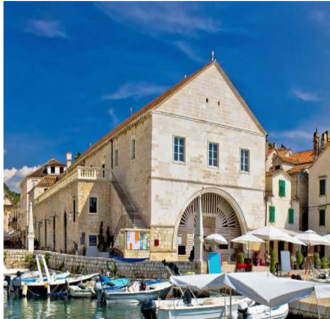
Slika 7 Zgrada Arsenala na Hvaru

Jedan od rariteta Hvarskog kazališta jesu i dvije očuvane zidne scenografije sa zida pozornice. Jedna freska datira iz 1818. godine i danas se nalazi na pozornici. Druga freska, približno iz 1900-te godine se nalazi na pomičnim panoima u predvorju.