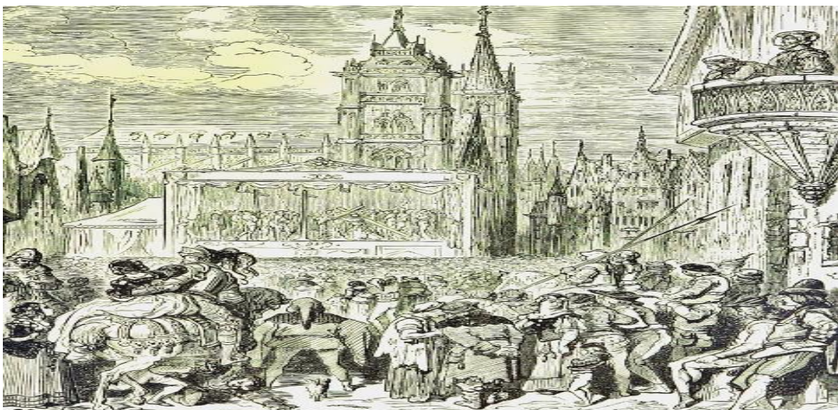
Slika 1 Prikaz mirakula, Flandrija, 15. stoljeće

Mirakul ili mirakl (lat. miraculum-čudo), je podvrsta srednjovjekovne liturgijske drame, temeljene na biblijskim prizorima kao i na legendama o svecima, mučenicima i njihovim čudima. Na našim prostorima, prvi mirakuli su zabilježeni u 15. stoljeću uz Jadransko more, a pisani su na hrvatskom jeziku. Tako imamo Mirakul slavne dive Marie, Prikazanje historije sv. Panucija i Prikazanje života sv. Lovrinca. (Batušić,2019:7-17)