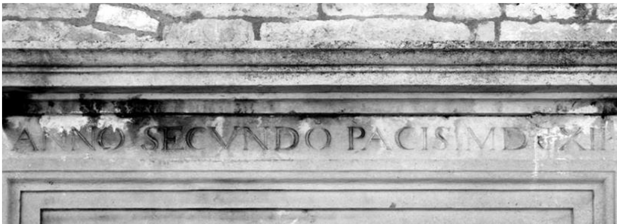
Slika 6 Uklesani natpis na dovratniku Arsenala

Godina 1612. koja je i uklesana na nad vratniku ulaznih vrata u Arsenal, ujedno je i druga godina socijalnog mira između zavađenih staleža hvarske Komune kojima je na taj način omogućio ravnopravno korištenje prostora za različite kulturne sadržaje.