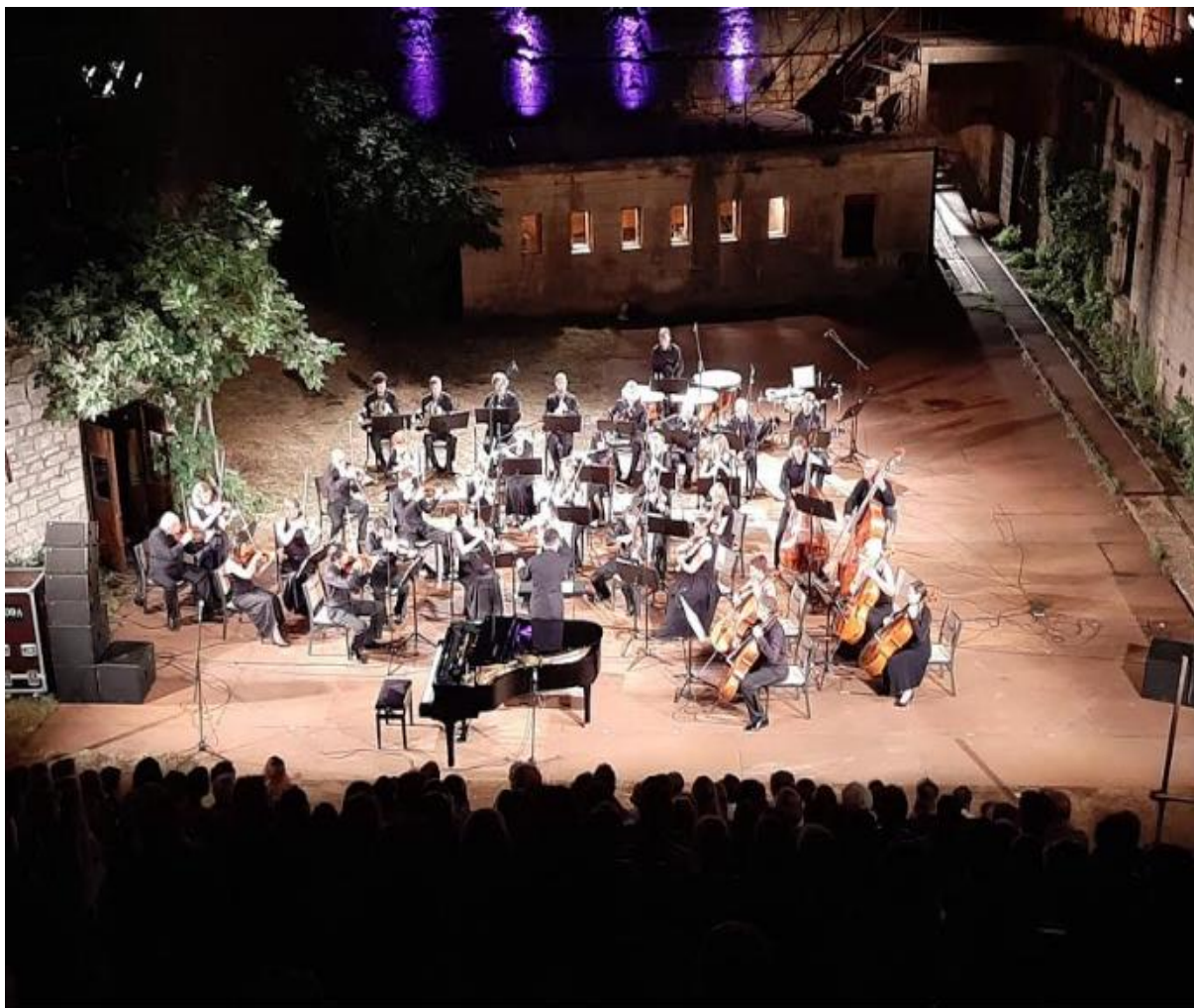
Slika 29 Izvedba Južnočeške filharmonije u utvrđi Minor

U novije vrijeme od suvremenih kazališta svakako je zahvalno spomenuti Kazalište Ulysses, koje je osnovano 2001. godine od strane glumca i redatelja Rade Šerbedžije i pisca Borislava Vujčića, koji su mu nadjenuli ime po Joyceovom Uliksu. Ulysses je pokrenut kao međunarodni kazališni projekt sa misijom stvaranja otvorenog kazališnog prostora unutar kojega bi hrvatski glumci imali mogućnost raditi i sudjelovati zajedno sa europskim i svjetskim umjetnicima te na taj način razmjenjivati iskustva te paralelno s time nadograđivati svoja iskustva i znanja i svoje kreativne horizonte.