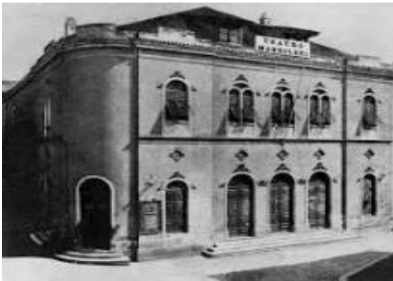
Slika 15 Zgrada šibenskog kazališta

Prvo kazalište Šibenik dobiva 1870. godine, ponajprije zahvaljujući donacijama svojih sugrađana koji su svojim donacijama u potpunosti financirali izgradnju kazališne zgrade. Inicijator gradnje je bilo Društvo šibenskog kazališta, a budući da je građeno sredstvima građana po tome je dobilo i ime Društveno kazalište (Teatro Sociale da Sibeniko). Dvije godine kasnije ime je promijenjeno u Kazalište Mazzoleni po poznatom šibenskom pjevaču svjetskoga glasa. Sama zgrada je kopija talijanskog kazališta „Teatro Fenice“. 4