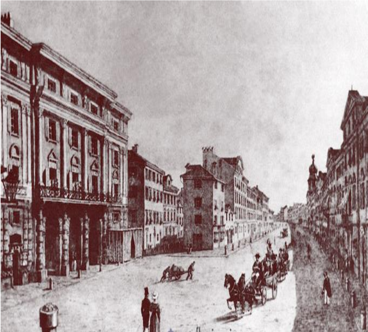
Slika 10 Adamićevo kazalište u Rijeci 3