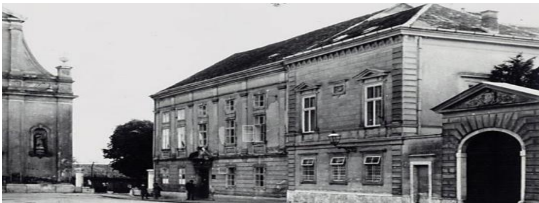
Slika 9 Zgrada Gornjogradske gimnazije u Zagrebu

Između 1646. i 1648. izvode se neke scenske manifestacije i u Karlovcu, također od strane isusovačkog reda. Iako su isusovci optuživani za anacionalnost zbog izvođenja na latinskom jeziku, postoje brojni dokazi da su baš oni često uvodili hrvatski jezik u predstave. Samo isusovačko kazalište se je kroz 18. stoljeće afirmiralo kao žarište scenske umjetnosti sjevernog djela Hrvatske. (Batušić,2019:144-146,299-324)