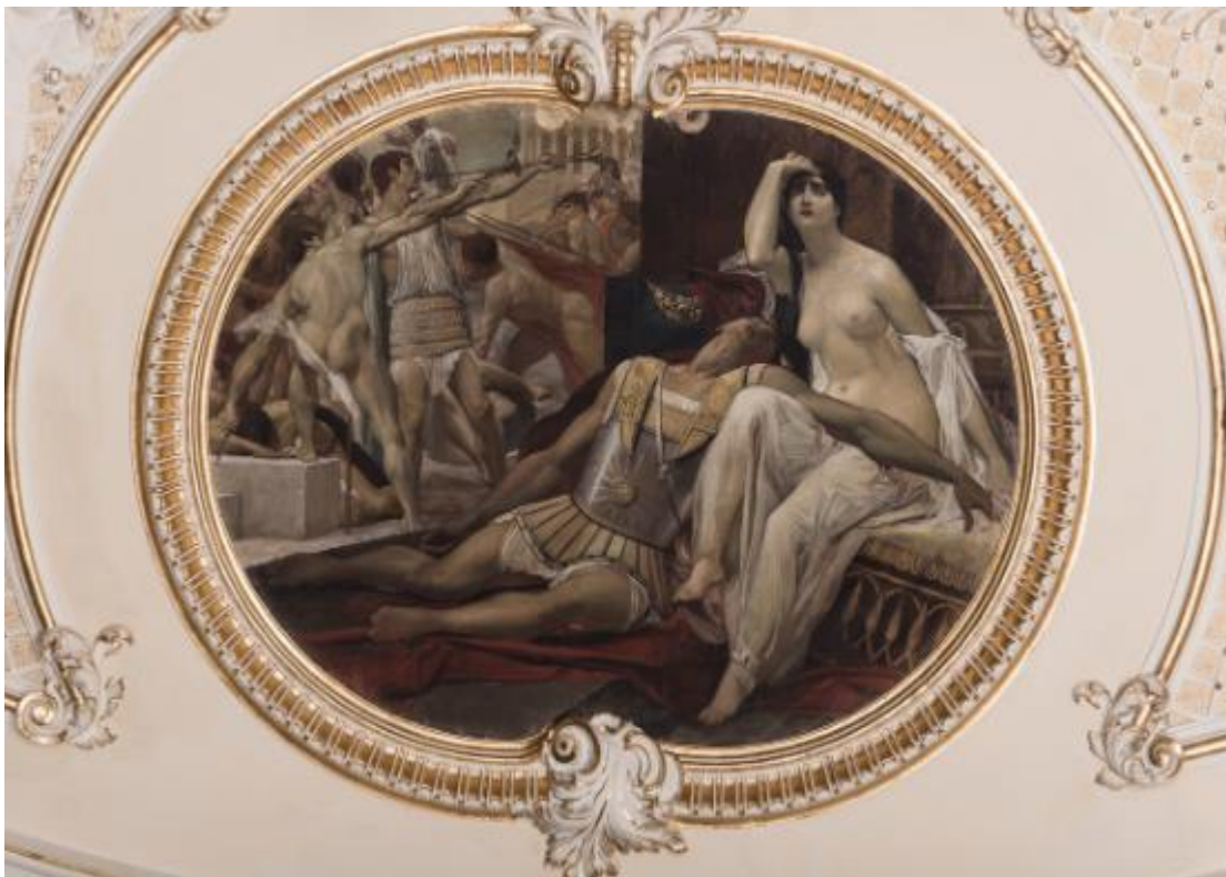
Slika 22 Jedna od Klimtovih slika na stropu Zajca