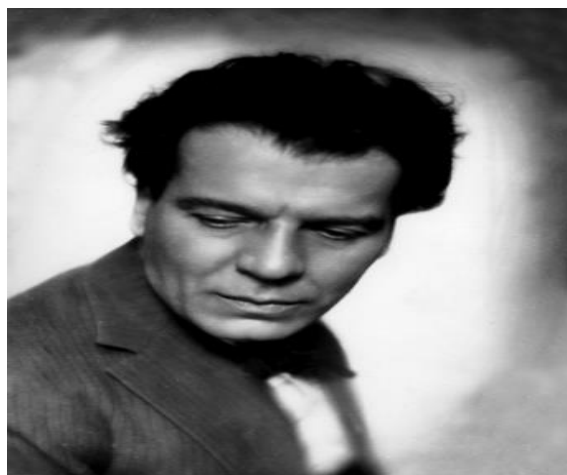
Slika 24 Branko Gavella

Samo osnivanje ZDK-a donosi nove mogućnosti izražavanja, te napokon donosi određeni organski nedostatak koji za potrebu ima dokazivanje osobnih stvaralačkih mogućnosti, a time i novu međufazu kazališne povijesti. (Batušić,2019:474-477)