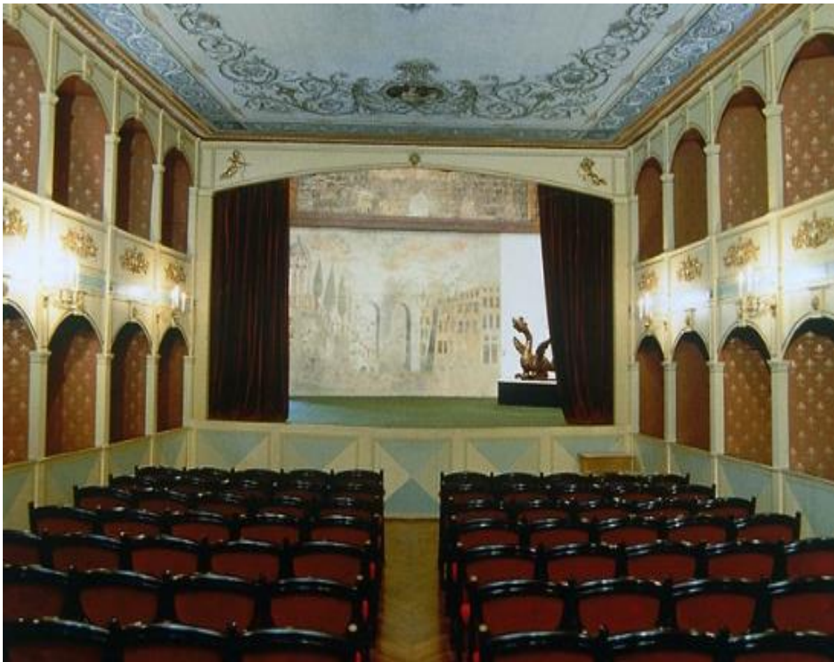
Slika 8 Hvarsko kazalište Semitecolo iznutra

ugodnom ambijentu i o posebnoj čari povezanosti publike i gledatelja, što zbog malog prostora pozornice, što zbog blizine gledališta i pozornice. U prvotnoj verziji, kazalište je imalo samo gledalište na parteru, a kasnijom obnovom, nadograđene su i lože, koje su prema spisima većinom bile u privatnom vlasništvu no ne samo bogatih, već svih staleža. 2