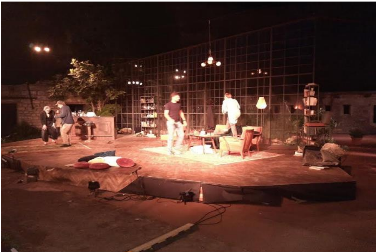
Slika 30 Pripreme za generalnu probu Ulyssesove izvedbe Virginije Woolf