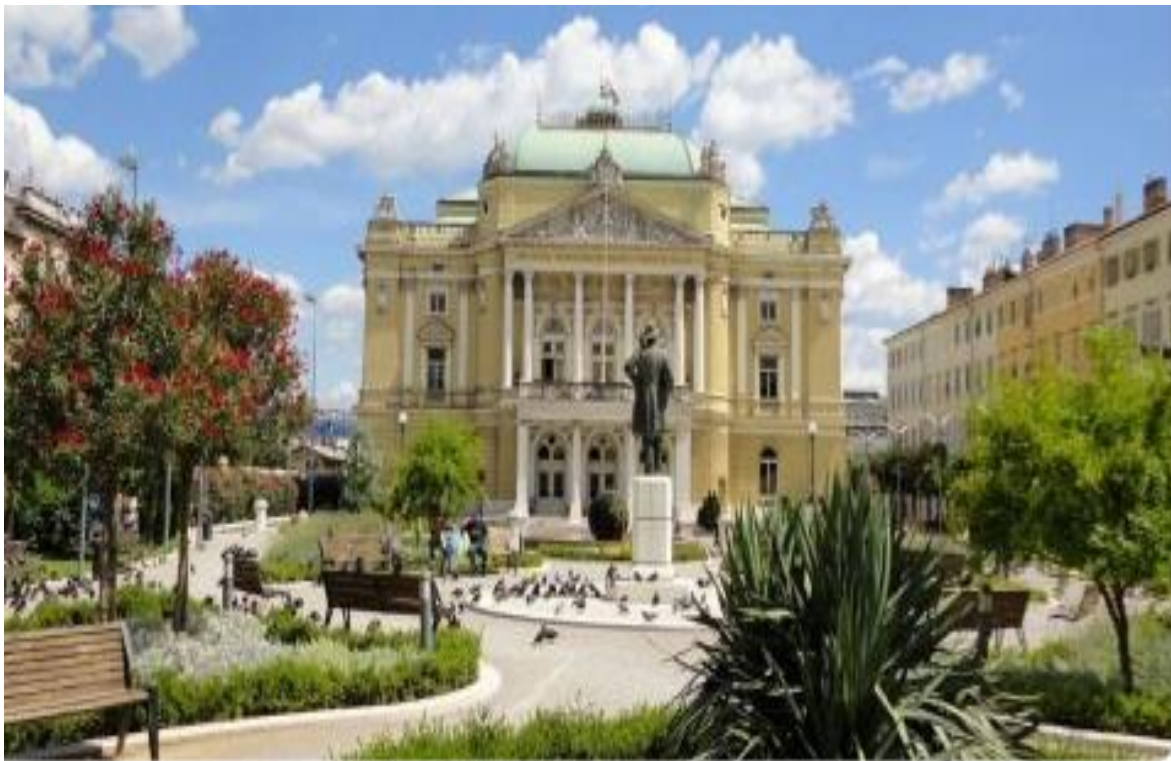
Slika 20 Hrvatsko Narodno Kazalište Ivana PL. Zajca

Godine 1953. teatar dobiva ime po još jednom velikom skladatelju, ali ovoga puta je to hrvatsko ime, odnosno Ivan Zajec . Status nacionalnog kazališta je dobiven 1991. godine. Zgrada kazališta i u današnje vrijeme dominira prostorom, a ujedno je jedna od cjenjenijih ostvarenja historicizma u gradu Rijeci. Zgrada HNK Ivana pl. Zajca nalazi se na Listi zaštićenih kulturnih dobara u Registru kulturnih dobara Republike Hrvatske. (Batušić,2019:300-301)