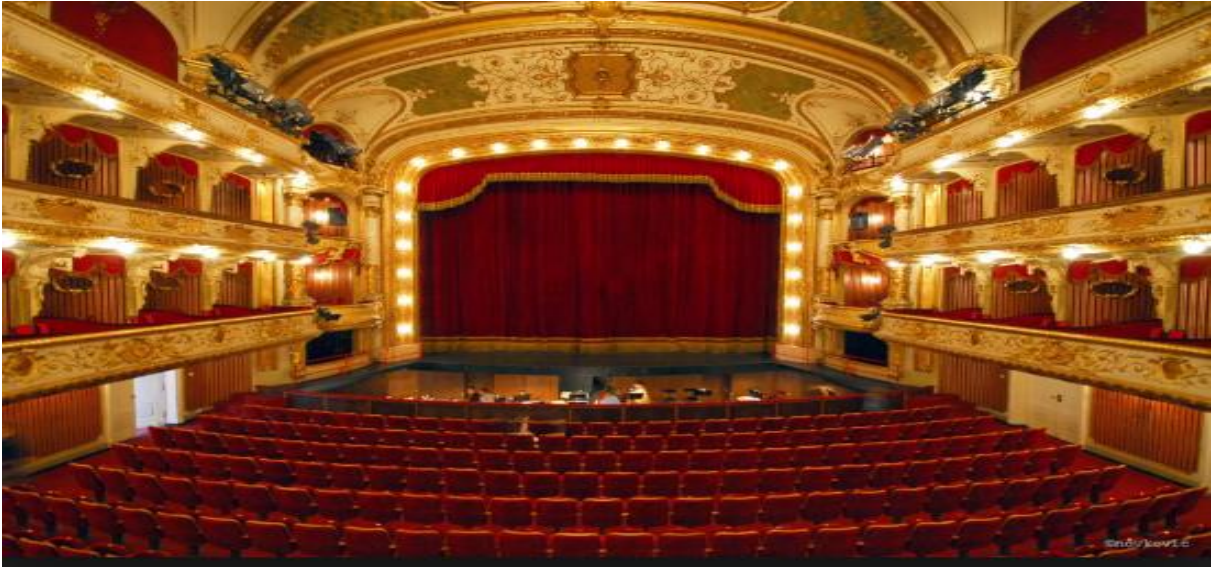
Slika 13 Unutrašnjost HNK-a Zagreb