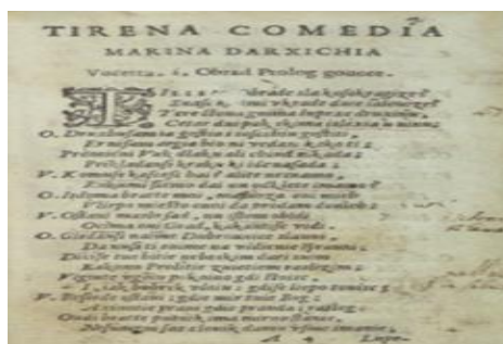
Slika 5 Držićeva Tirena

Od utjecajnih osoba renesansnog kazališta svakako moramo spomenuti Marina Držića koji je ostavio veliki osobni pečat u stvaranju kazališnog života, a na što je zasigurno imao utjecaja njegov boravak u Sieni gdje je studirao a ujedno je bio i vicerektor sveučilišta. Držićevim povratkom u Dubrovnik, on nastavlja sa svojim dramskim stvaralaštvom, a istovremeno iz Mletaka u Dubrovnik stiže i bogata kolekcija od preko sedam stotina knjiga te otvaraju široku lepezu mogućnosti onkraj do tada tek dvadesetak poznatih izvođenih dijela. Držić ujedno okuplja i afirmira raspršene kazališne snage oko svojih dramskih pothvata. Nije naodmet spomenuti i „Pomet“- prvu kazališnu družinu koju je osnovao Držić davši joj ime po izgubljenom komediji. Nadalje Držić uprizoruje i Dunda Maroja, Novelu od Stanca, obje Tirene te pirnu dramu Venera i Adon. (Batušić,2019:22-25)