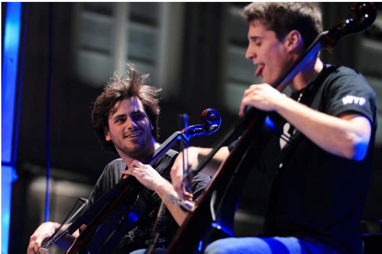
Slika 28 2 Cellos izvode obradu Peppersa u Dubrovniku

Otvarajući vrata suvremenom stvaralaštvu, Dubrovačke ljetne igre već početkom sedamdesetih godina uvode glazbenike novih trendova te se pozornost posvećuje koncipiranju glazbe i koncertnih programa, u što svakako spada i nedavna izvedba 2 Cellosa. 9