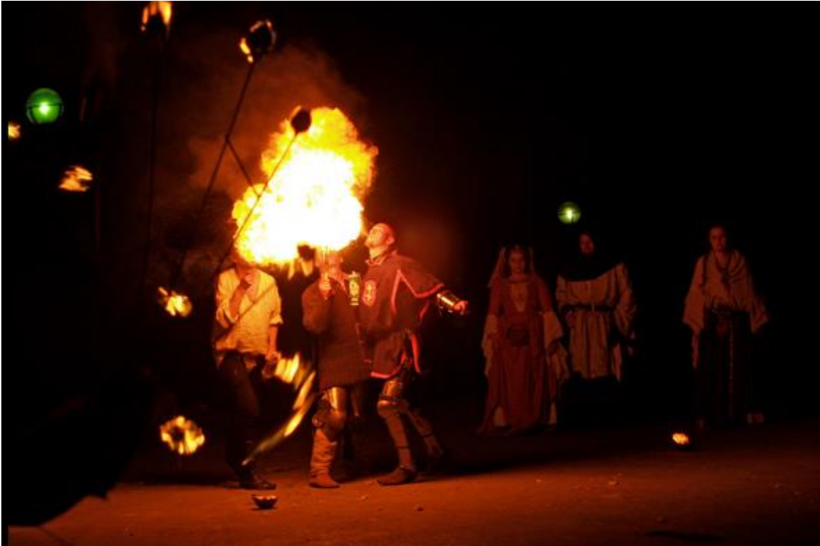
Slika 2 Prikaz putujuće družine i njihovog nastupa

Druga polovica 15. stoljeća donosi sve veći broj glumačkih družina koje redovito nastupaju po većim gradovima poput već spominjanih Dubrovnika i Zagreba, no svoje nastupe izvode i po raznim sajmovima, gostionicama i sl. U Dubrovniku tog doba dolazi do osjetnog jačanja scenskog života pod utjecajem hrvatske dramske književnosti. Tako se prikazuju djela Vetranovića i Nalješkovića, a glumišnom djelatnošću započinje i Marin Držić. Stvaranjem svojevrsnog scenskog života u gradovima, dolazi do odbijanja prihvata putujućih zabavljača, te im se brane izvedbe. Dokaz tih zabrana je i „Poljički statut“, jedan od najstarijih spomenika starog hrvatskog prava u kojem se izlaže da je moguće uskratiti nasljedstvo onome koji radi nečasne poslove a u koje je ubrojena i gluma. (Batušić,2019:18-22)