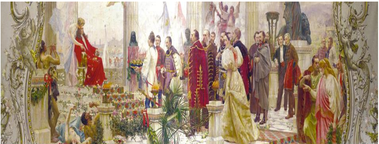
Slika 14 Hrvatski preporod, Vlaho Bukovac, svečani zastor Hrvatskog narodnog kazališta u Zagrebu

Zanimljiva činjenica vezana uz vizionarstvo i budući razvoj grada veže se uz bana Khuena koji je usprkos brojnim protivljenjima ustrajao da se kazalište gradi na tadašnjem sajmištu koje se je nalazilo izvan grada. Postavljalo se je pitanje zašto se kazalište gradi na selu, te tko će tamo u blato ići gledati predstave.