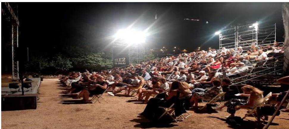
Slika 26 Gledalište i scena postavljeni u parku Gradac

Dubrovnik je tijekom desetljeća izvedbi i održavanja igara uprizorio nebrojeno velik i širok repertoar scenskih djela poput Shakespearova Hamleta koji je izvođen na Lovrijencu od 1952.-1963. godine, te tijekom idućih razdoblja u različitim verzijama scenskih interpretacija drugih autora, Goetheove Ifigenije na Tauridi izvođene u parku Gradac preko puta Lovrijenca, postavljene od strane Gavelle, pa sve do Georgija Para, koji postavlja Brechta i Krležu, pokušavajući interpretirati suvremena scenska htijenja. (Batušić,2019:479-481)