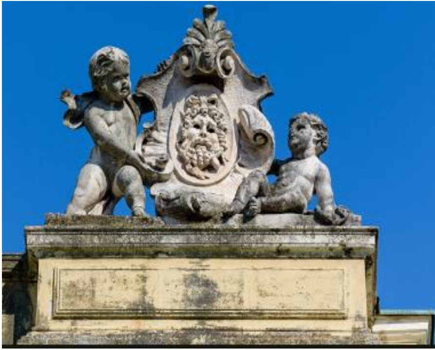
Slika 21 Volkelovi kipovi na pročelju Zajca