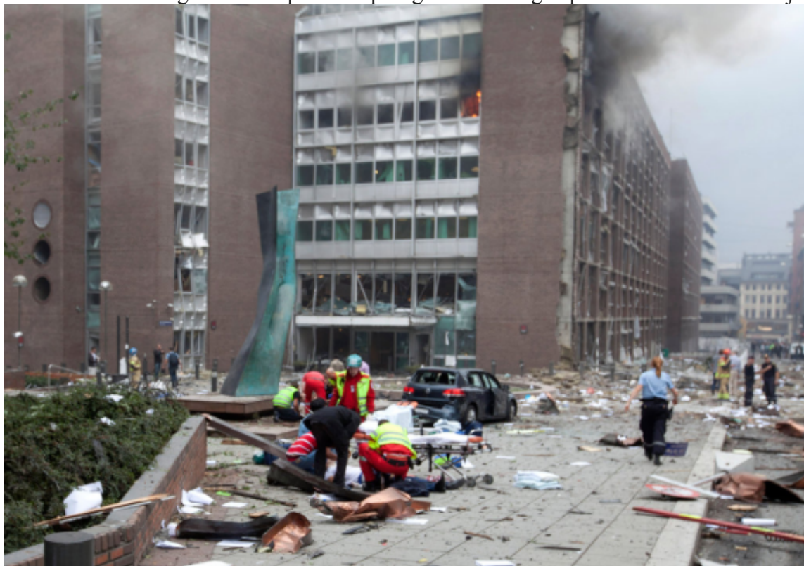
Slika 2. Oštećena zgrada vlade prilikom prvog terorističkog napada u Oslu u Norveškoj