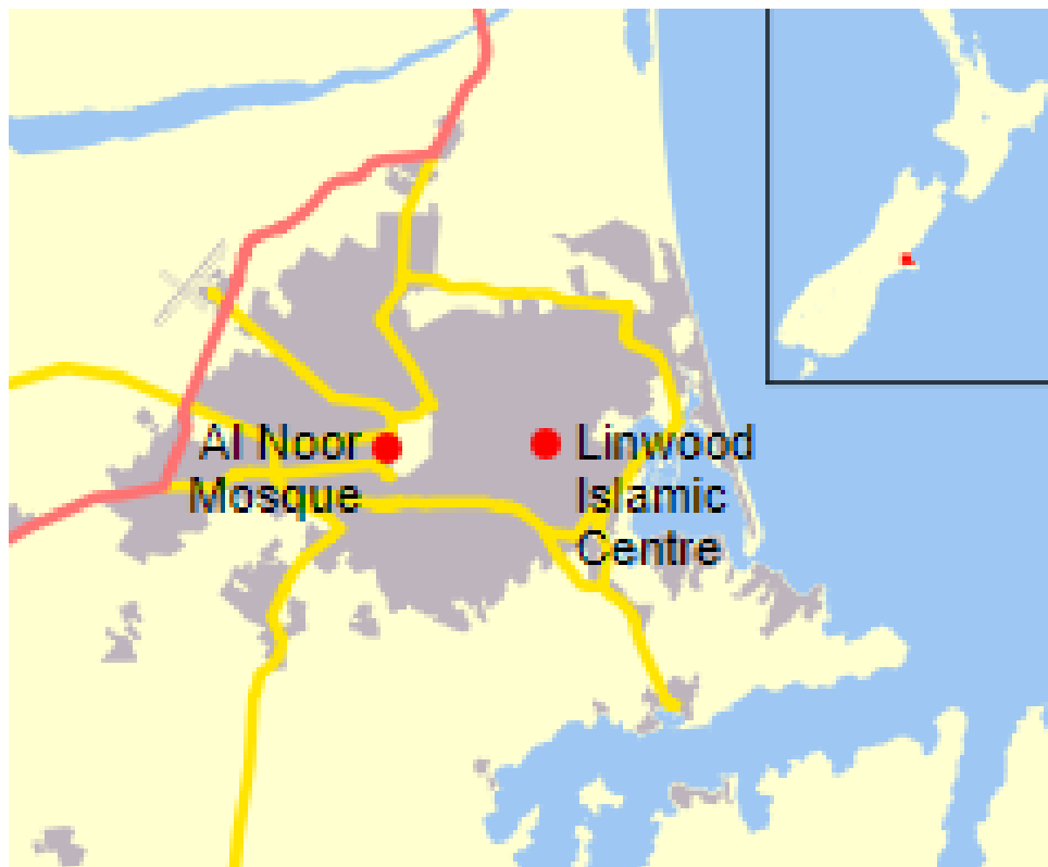
Slika 3. Karta džamija Al Noor i Linwood