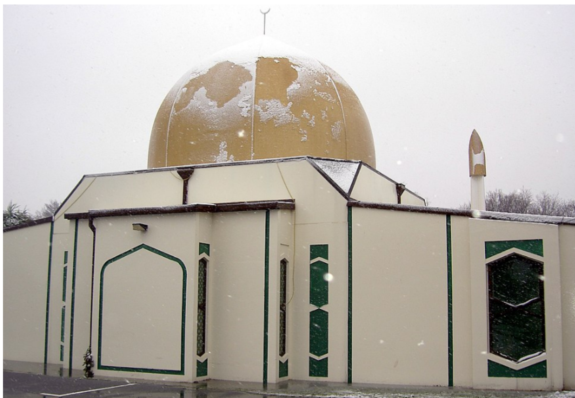
Slika 4. Džamija Al Noor