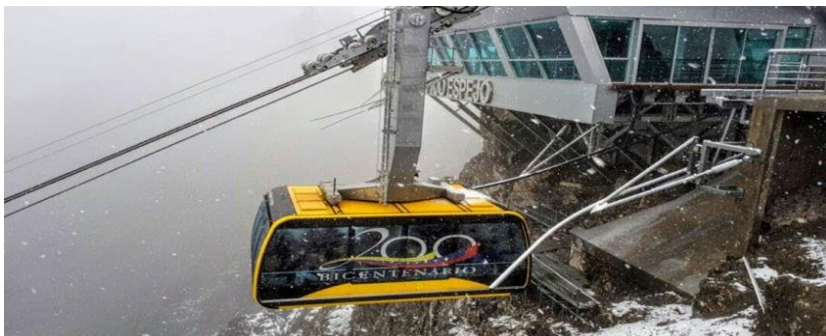
Slika 7: Žičara Merida

Sustav turističkog prijevoza žičara Mukumbarí, sustav je žičara koji djeluje u gradu Meridi. To je najviša i druga najduža žičara na svijetu sa svega 500 metara. Žičara Merida ima 12,5 kilometara, dosegovši visinu od 4,765 metara nadmorske visine, što je inženjerski posao, koji je tradicionalno jedinstven po svom tipu i s više od 50 godina povijesti. 50