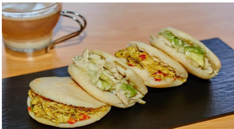
Slika 13: Punjene arepe

pećnicu, otprilike 10 min na 180°C. Tekstura mora biti hrskava, ali iznutra mekana kao polenta. Arepa se servira na način da se prereže (ne do kraja – trećina kruga otprilike se ne rastavlja), namaže se maslacem (ne treba ga posebno razmazivati već se sam rastopi), te se puni pripremljenim punjenjem na koji se dodaje malo naribanog sira. Umak se služi sa strane i dodaje po osobnom ukusu“. 58