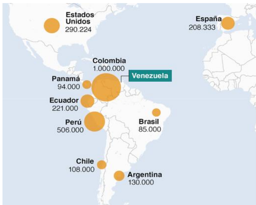
Slika 9: Glavna odredišta venezuelanskih migranata u 2018. godini

izbjeglica koji preplavljaju regiju. Zemlja je također postala međunarodni čvor kriminalnih aktivnosti. Najmanje dvanaest visokih dužnosnika, uključujući potpredsjednika Tarecka Al-Aissamija, proglašeni su međunarodnim vladarima narko-kartela“. 52