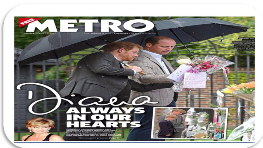
Slika 10 Naslovnica prisjećanja Dijanine smrti

Iako mediji narativ o slavnoj osobi u određenoj mjeri mijenjaju nakon njene smrti, to se isto ne događa s komentarima. Komentari su konstanta koju nije lako, ili uopće moguće promijeniti. Slojevitost, raznovrsnost te ambivalentnost koje slavnju osobu prate u životu uz nju se vežu i nakon njene smrti, tj. oni koji su za života poštovali lik i djelo određene slavne osobe to će činiti i kada osoba premine, i obrnuto.