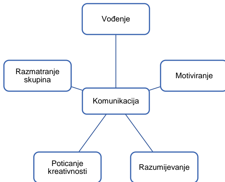
Slika 4.1. Uloga komunikacije u sustavu

Izvor: Certo, S., T. (2008). Moderni menadžment, Zagreb: Mate, str. 326