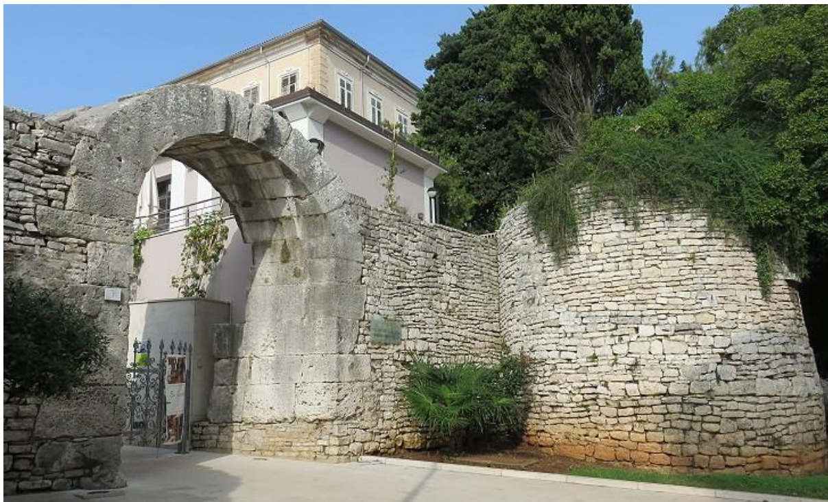
Slika 9: Herkulova vrata (Porta Ercole)

Arheološkog muzeja. Cijela je građevina bila zatrpana mnogo prije XIII. st. da bi pojačala obrambenu strukturu grada. Njezino iskopavanje izvršeno je početkom XIX. stoljeća pošto su bili vidljivi gornji lukovi. Godine 1831. otkrivena je natpisna ploča od bijelog mramora koja spominje bogatog pulskog građanina Lucija Menacija Priska, koji je o vlastitom trošku od 40.000 sestercija 24 sagradio jedan od vodovoda grada. Danas natpis zauzima gornji središnji prostor vrata gdje ga je 1857. godine dao postaviti Pietro Kandler 25 . (Matijašić, 1996: 59, 61 – 62)