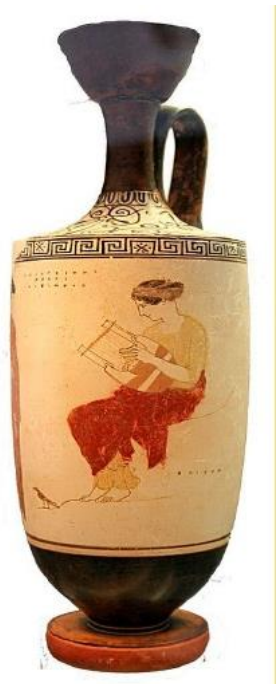
Slika 5: Ahilej, atenski lekit iz oko 440. - 430. g. pr. Kr.