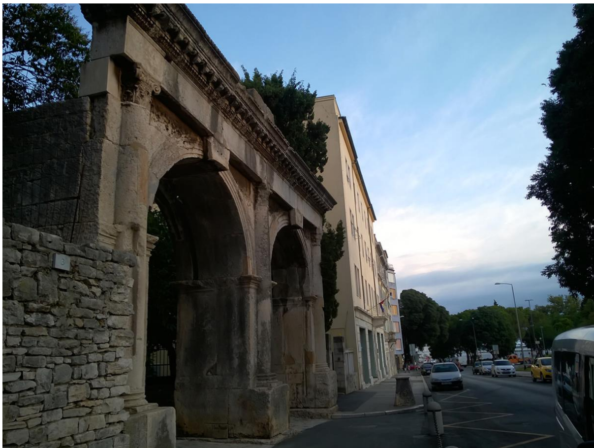
Slika 8: Dvojna vrata ( Porta Gemina )

Mnogi smatraju da su Dvojna vrata ili Porta Gemina zasjenjena ljepotom i položajem Zlatnih vratiju ili Slavoluka Sergijevaca. Nekoć su bila dio glave komunikacije prema antičkom kazalištu, dok su u današnje vrijeme pod okriljem predivne goleme građevine, zgrade Arheološkog muzeja i visokih cedrova u njegovom parku te predstavljaju gotovo slijepi put. Zgrada muzeja je nekoć bila zgrada njemačke gimnazije, nastala krajem prošlog stoljeća po nacrtima arhitekta Natalea Tommasija, a muzej je ovdje preseljen 1930. godine.