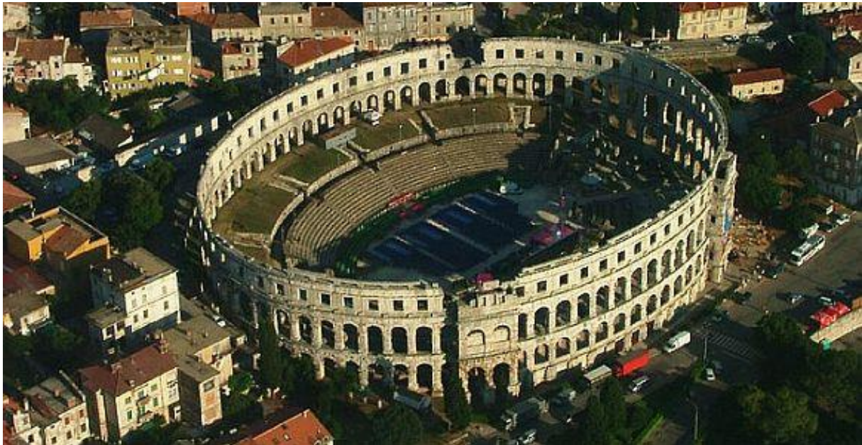
Slika 14: Amfiteatar u Puli