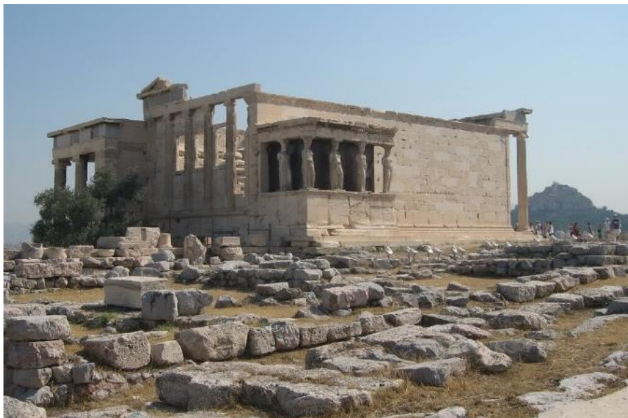
Slika 3: Poseidonov hram (klasična umjetnost Grčke)

Kada govorimo o razdoblju grčke klasične umjetnosti, govorimo o vremenu kada se u Ateni okupljaju najveći filozofi, znanstvenici i umjetnici toga doba. Atena je u to vrijeme predstavljala prijestolnicu grčke kulture. Naglašavajući visoki društveni standard, također se naglašava i intenzitet zajedničkog života slobodnih građana kroz mogućnost sudjelovanja u svim manifestacijama gradskog života.