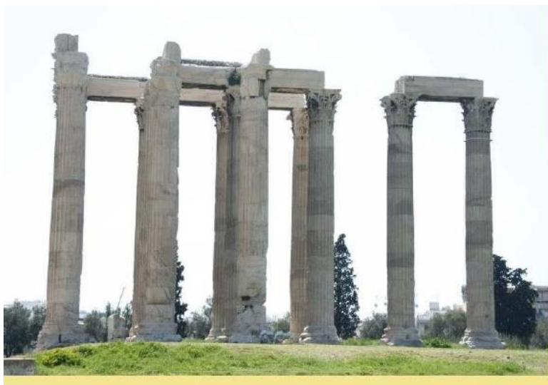
Slika 6: Zeusov hram u Olimpiji

I zadnje razdoblje antičke umjetnosti obuhvaća razdoblje kasne antike koje se često izjednačuje s ranokršćanskim razdobljem. Obuhvaća razdoblje od prvih kršćanskih umjetničkih ostvarenja (II/III. st.) do prvih desetljeća VI., odnosno VII. st., kada se postupno na grčkom Istoku transformirala u ranobizantsku umjetnost, a na latinskom Zapadu, na tradiciji djelomično barbarizirane kasnoantičke umjetnosti, prešla u ranosrednjovjekovnu (merovinšku, irsku, karolinšku, anglosasku, langobardsku, starohrvatsku, otonsku) umjetnost.