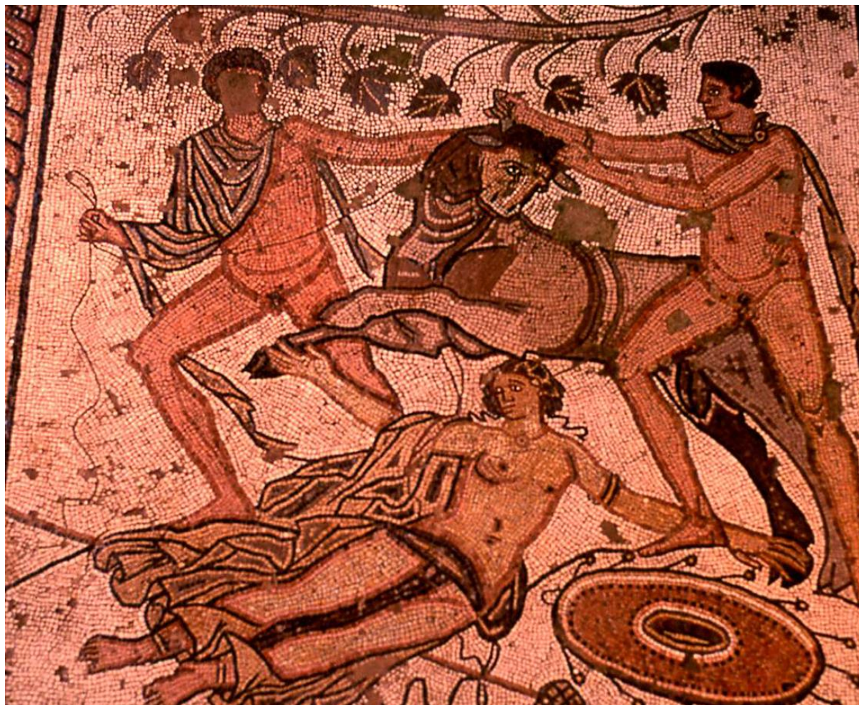
Slika 15: Mozaik - prikaz kažnjavanja Dirke

Najljepši i najbolje očuvan primjer mozaičke umjetnosti, svakako i najpoznatiji primjer, mozaik je s prikazom kažnjavanja Dirke.