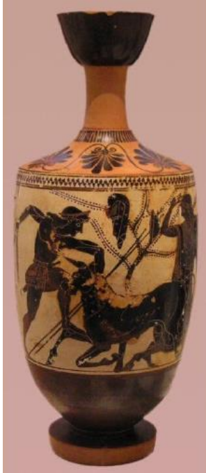
Slika 4: Lekit (oko 500. godine pr. Kr.)

određenje kao izraza povezanosti između stanja mirovanja i pokreta prvi dali upravo Grci oko 500. pr. Kr., na prijelazu arhajske u klasičnu umjetnost. U slikarstvu se koristi i razvija tehnika crvenih figura na tamnoj podlozi. Javlja se i drugačija vrsta posuda koje se nazivaju bijeli pogrebni „lekiti“, a bili su namijenjeni kultu pokojnika te su se postavljali u grobove. 4