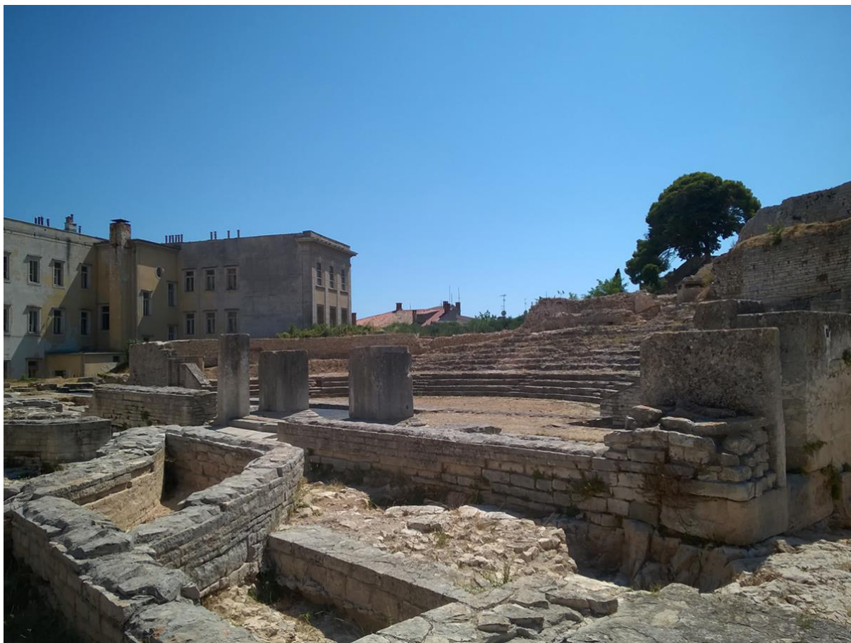
Slika 13: Malo scensko kazalište unutar gradskih bedema

Malo scensko kazalište nalazilo se na istočnom dijelu, padinama središnjeg gradskog brežuljka, današnjeg Kaštela. Do danas su sačuvani ostaci u dužini od 62 metra. Možemo reći da je kazalište bilo skladna građevina koja se sastojala od scenske zgrade, polukružne orkestre i polukružno oblikovanim stepenicama gledališta. Stepenice gledališta bile su dijelom usječene u živu stijenu brda. Postojala su tri monumentalna ulaza kroz koje se u zgradu ulazilo, a stepenište je bilo obilježeno imenima zakupaca. Iako su kazališta bila državne ustanove i financiralo ih se iz državne blagajne, velik broj posjetitelja/gledalaca bilo je iz bogatih obitelji, mecena te su oni sudjelovali svojim donacijama. (Matijašić, 1996: 125 – 127)