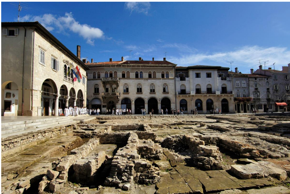
Slika 10: Forum u Puli (za vrijeme arheoloških iskopanja)

U Puli se glavni trg u starom gradu i danas naziva Forumom . Forum je bio glavno sastajalište antičkoga grada, jezgra gradskog života, prostor za javna okupljanja, političko djelovanje, obavljanje kultova. U njegovoj blizini bila je i tržnica, te trgovine s raznom robom i prostorije za okrpju. Kao najznačajniji javni prostor u graditeljsko-umjetničkom, kiparskom smislu najuređeniji i najdotjeraniji dio grada, svaki građanin morao je proći glavnim trgom. Sam je trg u antičkom gradu predstavljao ranu pačetvorinastu površinu (u Puli 39 x 82 m), okruženu s tri strane trijemom, dok je s četvrte obično bio najvažniji hram, onaj u kojemu se štovao službeni državni kult Kapitolijskog trojstva (Jupiter, Junona, Minerva). Trijem se koristio kao zaštita od kiše i sunca, njime se moglo šetati duž rubova trga, ali iz trijema se ulazilo u sve javne i trgovačke prostore koji su bili smješteni na samom Forumu. Forumski prostor u antičkom je gradu sinonimni pojam za mjesto gdje su se obavljale sve gradske funkcije: tu su bogati pripadnici viših staleža sudjelovali u radu gradskog vijeća, tu su svoje urede imali gradski službenici i sve javne službe. Ovdje su se donosile odluke, na to su mjesto dolazili glasnici iz glavnoga grada, iz Vječnog Rima, ovdje se, ukratko, zrcalio svekoliki život grada. (Matijašić, 1996: 67 – 68)