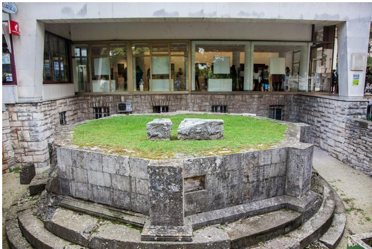
Slika 16: Osmerokutni rimski mauzolej

Osmerokutni mauzolej grobna je građevina iz I. st. pr. Kr. 1941. godine iskopani su tek ostaci donjeg dijela mauzoleja. Podnožje je kružnog oblika i sastoji se od tri stepenice. Donji dio sastoji se od pravokutnih polupilastra spojenih zidovima od pravilno klesanih i zaglađenih krupnih blokova u tehnici opus isodomum 39 . Pri dnu je obrubljen profilom od jednostavnih ravnih i izvijenih letvica ukupne visine od 23,5 cm. Mauzolej je bio visok oko 920 cm. Unutar mauzoleja izrubljen je vijenac koji je morao odvajati osmerokutno postolje od središnjeg objekta, kao i cjelokupan središnji i gornji dio građevine. Iznad korintskih polustupova, visine 5 metara od kojih nije ništa ostalo sačuvano nalazio se tropojasni arhitrom i friz s motivima sfingi, grifona i Prijapa, te raskošni vijenac s kimom, konzolama pokrivenim akantusovim listom, ovulima i antemijem 40 na gornjoj izvijenoj letvici, koji je sačuvan u razmjerno velikom broju. Prema veličini može se pretpostaviti da je središnji dio mauzoleja sadržavao grobnu komoru. Krov je pokrivao cijelu osmerokutnu rekonstrukciju, a vjerojatno je bio u obliku niske osmerostrane piramide od olovnih ploča. 41