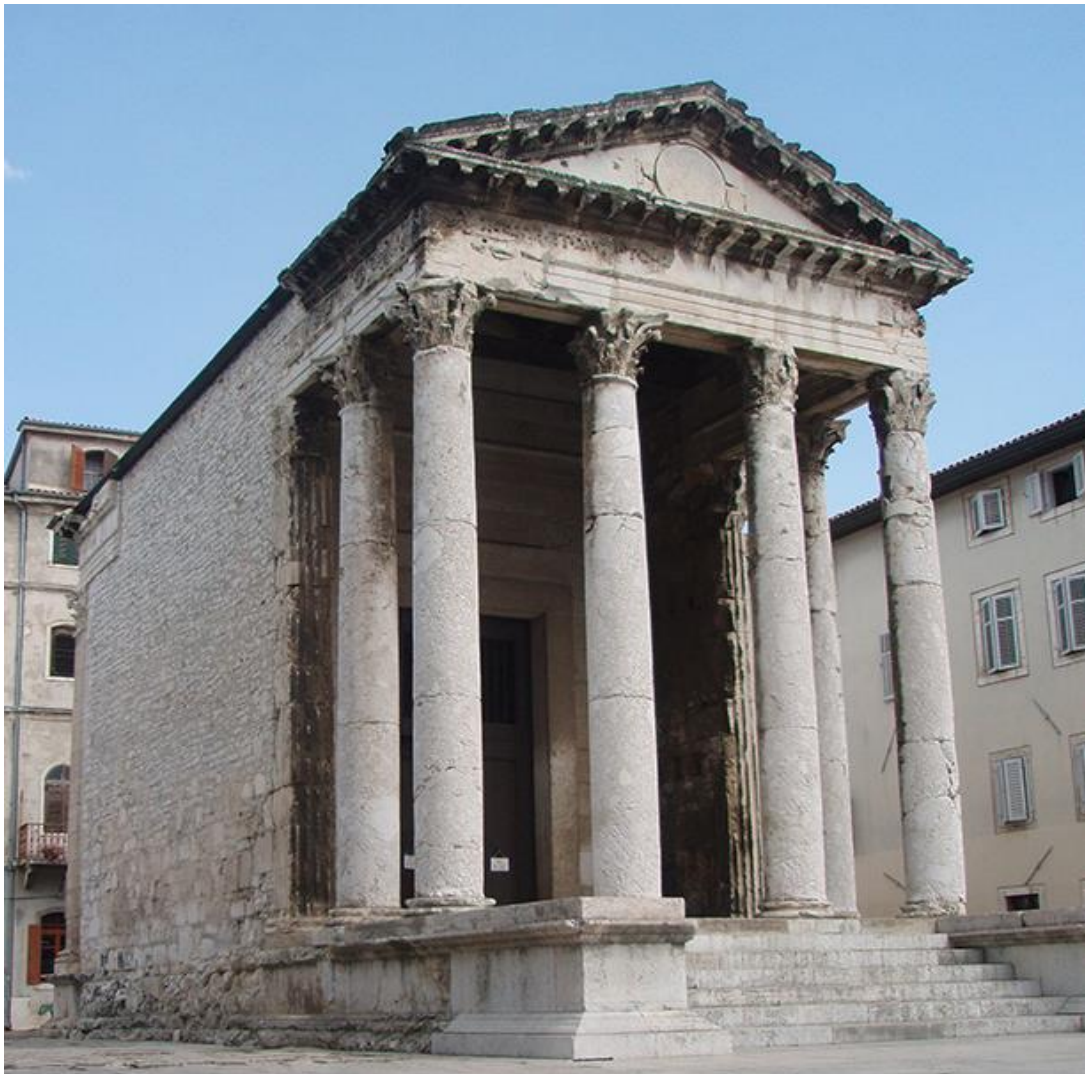
Slika 11: Augustov hram

Spomenik koji se danas prvi primijeti tj. „zapne za oko“ onoga tko dođe na glavni gradski trg jest Augustov hram .