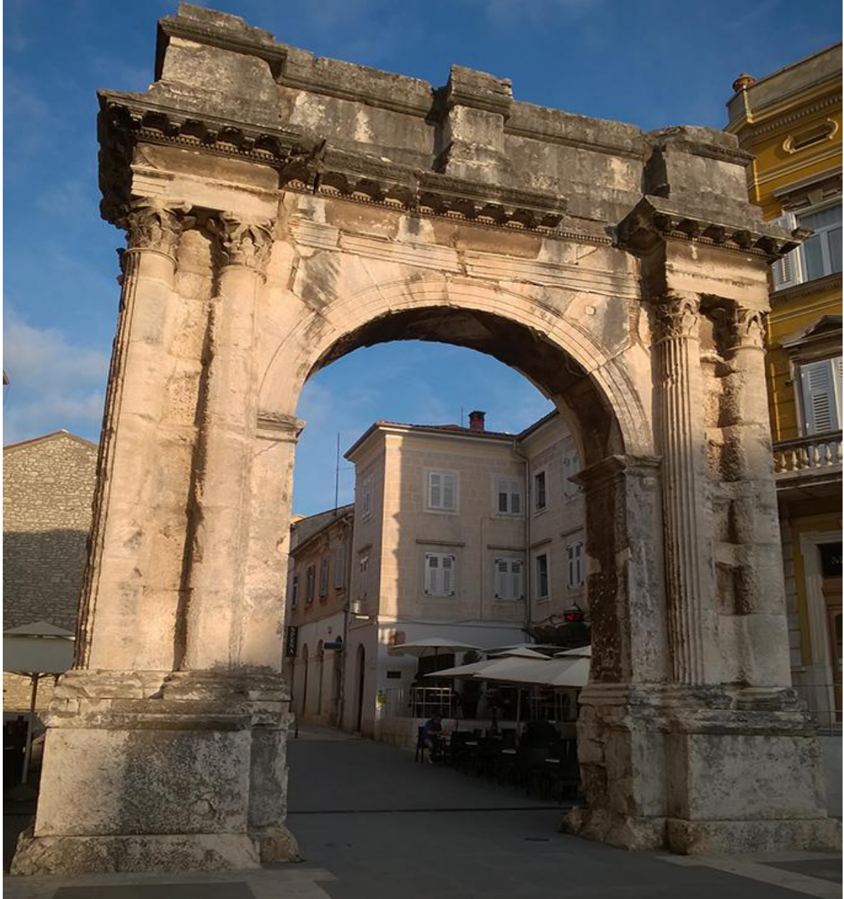
Slika 12: Slavoluk Sergijevaca

Mogli bismo reći da je Slavoluk monumentalna skulptura službenog karaktera, koji je osim slavolučne arhitekture, imao reljefe i dekoraciju, a na atici slobodne statue od kojih su danas sačuvane samo baze s imenima. Reljefi na Slavoluku su razmjerno plitki, a tematika je posuđena iz trijumfalne ikonografije. Bez obzira na tematiku, Slavoluk nije imao nikakve veze s trijumfom. Reljefom prikazane krilate Viktorije „boginje pobjede“, borbe orla sa zmijom, girlande što nose eroti, akantusove vitice i loza, već su viđene scene na mnogim javnim spomenicima u Rimu. Postavlja se pitanje zašto je i tko dao izgraditi tako veliku i nepobitno velebnu arhitektonsku skulpturu. Vjeruje se da je Salvija Postuma, iz obitelji Sergijevaca (udata