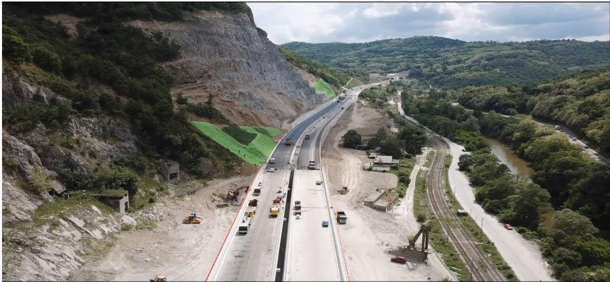
Slika 2. Autoput E - 75

E-75, dionica Caričina Dolina – Vladičin Han, poddionica Caričina Dolina – tunel „Manajle“, Republika Srbija, što je vidljivo na Slici 2.