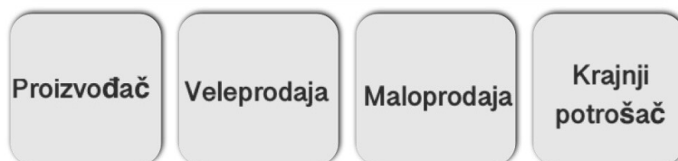
Slika 1. Ilustracija – krug subjekata u marketingu trgovini

Trgovina je gospodarska djelatnost u kojoj pojedinci i tvrtke, odnosno fizičke i pravne osobe, posreduju između proizvodnje i potrošnje kao kupci i prodavatelji dobara i usluga te organizatori tržišta. Kao posebna djelatnost trgovina omogućuje najbržu i najuspješniju povezanost proizvođača i potrošača. Unutarnja se trgovina obavlja unutar granica jedne države, dok se vanjska trgovina obavlja između subjekata koji su rezidenti različitih država. 1