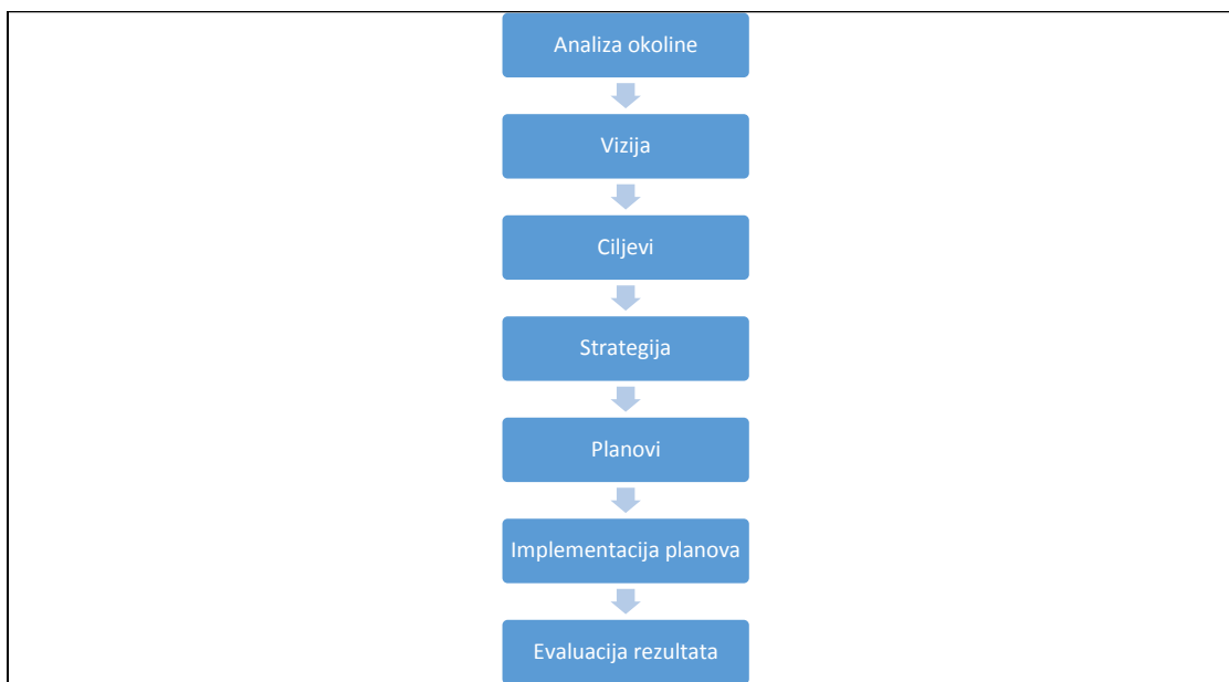
Slika 1: Faze procesa planiranja

Proces planiranja je zahtjevan i složen proces te se sastoji od više faza koje su usko povezane i utječu jedna na drugu. Na slici 1. su kronološki prikazane sve faze procesa planiranja.