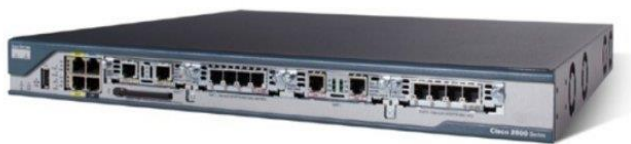
Slika 6 Modularni usmjernik

sloja (engleski Layer 3 switch), a označava preklopnik koji ima ugrađenu funkciju usmjeravanja paketa. Isti se od klasičnog usmjernika razlikuje po tome što on podržava samo ethernet portove, dok klasični usmjernici mogu imati mogućnost usmjeravanja i preko drugih sučelja (serijsko, ISDN, SONET/SDH, ATM i dr). Budući su IP telefoni često disperzirani kroz više mrežnih segmenata i/ili VLAN-ova njihove glavne značajke u VoIP-u su usmjeravanje između VLAN-ova i propuštanje DHCP informacija iz mreže u kojoj se nalazi DHCP server na sve ostale spojene mreže s telefonima.