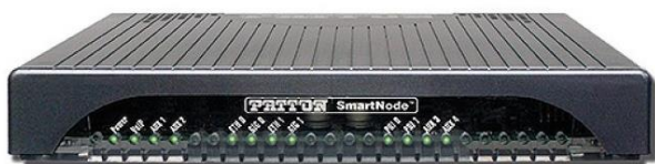
Slika 8 SBC

Ovaj termin se ne prevodi na hrvatski jezik već se koristi u navedenom obliku, a skraćeni je naziv za Session Border Controller. Namjena mu je spajanje dviju SIP strana, SIP stranu pružatelja usluga i SIP stranu krajnjeg korisnika, te manipuliranje pozivima (promjene brojeva, promjene SIP poruka u slučaju nekompatibilnosti između pružatelja usluge i opreme krajnjeg korisnika i sl.). Opisani način rada aludira na to da je SBC u stvari usmjernik, međutim iako spaja dva mrežna segmenta on to nije. Naime, promet s jedne strane na drugu se ne usmjerava IP protokolom nego se svaka strana ponaša kao zaseban uređaj, a paketi se između strana obrađuju i prilagođavaju onoj drugoj strani vlastitim mehanizmima. Uređaj ujedno služi i kao zaštita, budući propušta samo SIP promet i ne vrši funkciju usmjernika, tako da kroz njega ne prolazi podatkovni promet. Uređaj također rješava problem podudarnosti mrežnih segmenata pružatelja usluga i korisnika, jer bez SBC-a ne bi bilo moguće usmjeravati promet prema korisnicima koji koriste iste privatne opsege IP adresa kao što ih koristi pružatelj usluga.