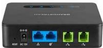
Slika 12 Dvoportna ATA

porta do 32 analognih portova. Svaki konfigurirani port na navedenom uređaju koristi jedan SIP račun na IP telefonskoj centrali.