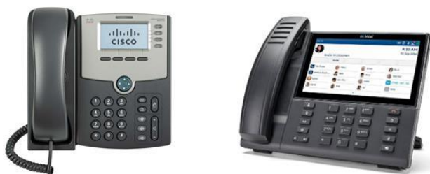
Slika 10 VoIP telefoni

To je telefon koji se spaja na podatkovnu mrežu putem ugrađene mrežne kartice, te koristi neki VoIP protokol za komunikaciju sa VoIP centralom. Neki telefoni mogu i izravno komunicirati bez centrale sa drugim IP telefonima koji koriste zajednički VoIP protokol, međutim u takvom načinu rada moguće je samo pozivanje između dva telefona bez ostalih funkcija telefonske centrale. Budući je IP telefon mrežni uređaj, isti koristi sve blagodati TCP/IP skupa protokola i gdje god se nalazi podatkovna mreža moguće je spojiti i IP telefon.