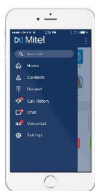
Slika 11 VoIP mobilna aplikacija

Pretstavlja aplikaciju koja se instalira na računalo ili pametnom telefonu i ima funkciju IP telefona. Ako se koristi na računalo potrebno je na istom imati mikrofoni i zvučnik ili slušalice sa mikrofonom. Kao i u slučaju IP telefona navedena klijentska aplikacija može koristiti neki od VoIP protokola, međutim u današnje vrijeme se koristi SIP gotovo bez iznimke.