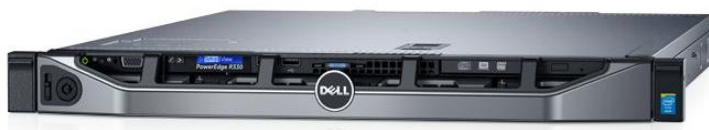
Slika 9 Poslužitelj sa VoIP aplikacijom (VoIP centrala)

Skraćeno od Private Branch Exchange. Pojam predstavlja telefonsku centralu, a u VoIP inačici često se naziva IP PBX, VoIP PBX, Soft Switch ili Call Manager. Radi se o uređaju ili aplikaciji na poslužitelju koji na sebe registriraju IP telefone (ili analogne telefone pomoću pristupnika), te omogućuju međusobnu komunikaciju ili komunikaciju sa vanjskim svijetom preko veza pružatelja javne telefonske usluge. Opisani sustav može se umrežavati sa drugim takvim sustavima, a najpopularniji način povezivanja je pomoću SIP protokola.