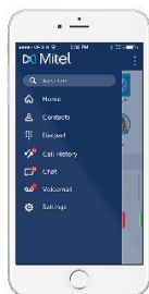
Slika 11 VoIP mobilna aplikacija

Pretstavlja aplikaciju koja se instalira na računalo ili pametnom telefonu i ima funkciju IP telefona. Ako se koristi na računalo potrebno je na istom imati mikrofoni i zvučnik ili slušalice sa mikrofonom. Kao i u slučaju IP telefona navedena klijentska aplikacija može koristiti neki od VoIP protokola, međutim u današnje vrijeme se koristi SIP gotovo bez iznimke.