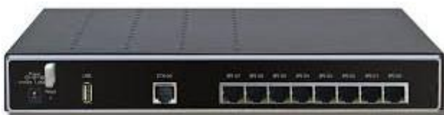
Slika 7 ISDN BRI pristupnik

Pristupnik (engleski gateway) je mrežni uređaj koji povezuje dvije različite tehnologije. U VoIP infrastrukturi naći ćemo pristupnike koji povezuju SIP ili H.323 tehnologiju sa analognom ili ISDN tehnologijom, te pristupnike koji povezuju GSM tehnologiju sa SIP, analognom ili ISDN tehnologijom. Za prvi primjer SIP strana se spoji na VoIP telefonsku centralu, a na analognu stranu se spoji telefaks uređaj i tako preko IP tehnologije koristimo terminale koji se inače ne mogu direktno spojiti u računalnu mrežu. Za drugi primjer SIP strana se također spoji na VoIP telefonsku centralu, dok se GSM strana spoji na GSM mrežu pomoću SIM kartice kakve se koriste za mobilne telefone i na taj način se ostvaruju uštede jer se pozivi prema mobilnim operaterima usmjeravaju sa VoIP centrale direktno u GSM mrežu umjesto kroz fiksnu telefonsku mrežu.