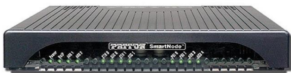
Slika 8 SBC

Ovaj termin se ne prevodi na hrvatski jezik već se koristi u navedenom obliku, a skraćeni je naziv za Session Border Controller. Namjena mu je spajanje dviju SIP strana, SIP stranu pružatelja usluga i SIP stranu krajnjeg korisnika, te manipuliranje pozivima (promjene brojeva, promjene SIP poruka u slučaju nekompatibilnosti između pružatelja usluge i opreme krajnjeg korisnika i sl.). Opisani način rada aludira na to da je SBC u stvari usmjernik, međutim iako spaja dva mrežna segmenta on to nije. Naime, promet s jedne strane na drugu se ne usmjerava IP protokolom nego se svaka strana ponaša kao zaseban uređaj, a paketi se između strana obrađuju i prilagođavaju onoj drugoj strani vlastitim mehanizmima. Uređaj ujedno služi i kao zaštita, budući propušta samo SIP promet i ne vrši funkciju usmjernika, tako da kroz njega ne prolazi podatkovni promet. Uređaj također rješava problem podudarnosti mrežnih segmenata pružatelja usluga i korisnika, jer bez SBC-a ne bi bilo moguće usmjeravati promet prema korisnicima koji koriste iste privatne opsege IP adresa kao što ih koristi pružatelj usluga.