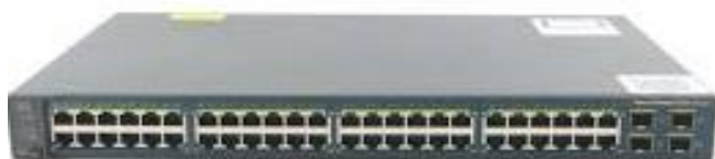
Slika 5 PoE Preklopnik

Preklopnik (engleski switch) je temelj današnjih komunikacijskih mreža. Glavna zadaća mu je kao i hub-u povezati računala. Međutim tu prestaje svaka sličnost. Preklopnik ponajprije prevladava probleme opisane u prethodnom poglavlju, tako da uređaji ne trebaju čekati na svoj red za slanje podataka, već je svim portovima omogućeno slanje podataka istovremeno. Isto tako promet nije vidljiv uređajima na svim portovima, već samo onima za koji je taj promet namijenjen. Stoga, da bi se dijagnostika mogla napraviti na preklopniku potreban je preklopnik koji ima funkciju zrcaljenja prometa na određeni port (engleski Port Mirroring). Na takvom portu se nalazi računalo na kojem onda pratimo promet sa portova koje smo uključili u zrcaljenje. Osim navedenog preklopnik može podržavati PoE, VLAN-ove, LLDP i još mnoge druge dodatne funkcije i protokole.