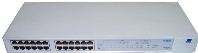
Slika 4 HUB

ostatkom mreže i zbog opisanog načina rada na računalu jednostavno pratimo sav promet koji prolazi hub-om. Hub nije upravljiv već ga se koristi takvog kakav je, odnosno na njemu se ne mogu programirati dodatne funkcije