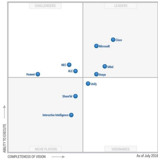
Slika 1 Stanje na VoIP tržištu 2016. godine prema Gartneru https://www.theucbuyer.com/blog/gartners-magic-quadrant-for-enterprise-unified-communications-uc-emphasizes-keys-to-competitiveness