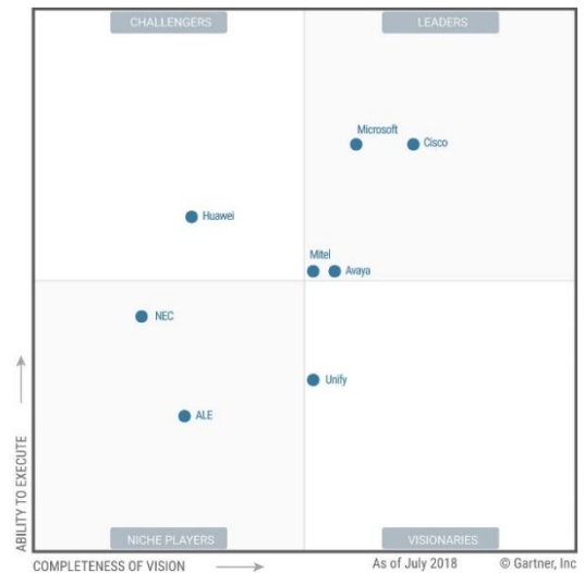
Slika 2 Stanje na VoIP tržištu 2018. godine prema Gartneru https://www.uctoday.com/unified-communications/uc-magic-quadrant-2018/