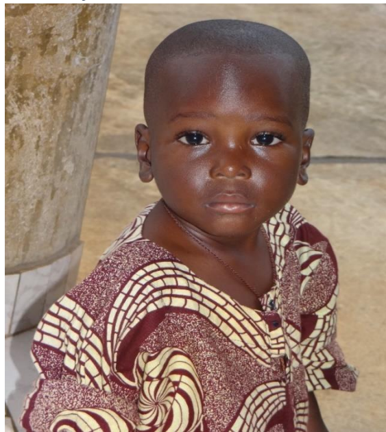
Slika 9 Dječak iz Benina

Šetnjom kroz selo može se vidjeti njihov način života, njihova igra i pustolovine. Nemaju baš nikakvu igračku, sve sami si naprave od drva, guma i starih lonaca. Njihov čvrsti zagrljaj, snažni stisak ruke i male oči pune vedrine ne izlaze iz glave, a njihov smijeh i vika odzvanja u ušima. Količina sreće koja se ne možete mjeriti, a još manje opisati. Ono što čovjek može osjetiti s njima, ne može se kupiti nikakvim novcem ili materijalnim stvarima.