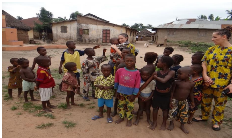
Slika 8 Upoznavanje s stanovnicima Benina

Dragica Milinović: Pitanje siromaštva u kontekstu poslovne etike s osvrtom na problematiziranje kvalitete života državljana Benina (završni stručni rad)