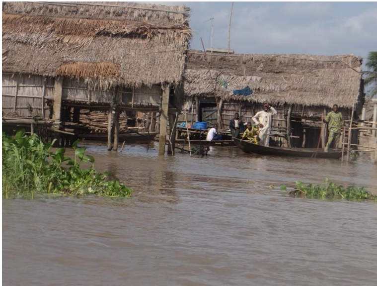
Slika 5 Primjer kuće na vodi

Na slici 6 prikazano je selo na vodi. Njihove kuće i način života prilagođen je njihovom geografskom i klimatskom obilježju. U ovakvim selima na vodi uzgaja se pamuk. U selu se većina stanovnika bavi ribarstvom i turizmom. Mještani uzgajaju i nekoliko pripitomljenih kopnenih životinja koje žive na malenim parcelama trave što izvire iz vode.