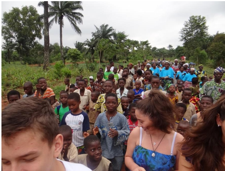
Slika 7 Prikaz dočeka

Na slici 8 prikazan je posjet Beninu u sred ljeta, kada djeca nemaju škole. U jednom selu u glavnom gradu Porto-Novo stanovnici pripremaju iznenađenje za posjetitelje.