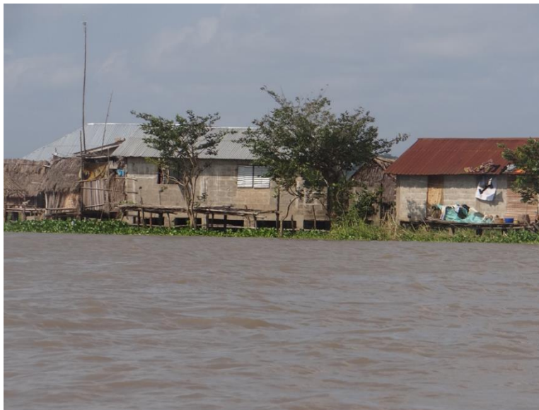
Slika 4 Selo na vodi

Klima u Beninu je vruća i vlažna, godišnji prosjek padalina za obalni dio je oko 360mm. U gradu Cotonou najviša prosječna temperatura je 31 °C, dok je najniža 24 °C. Benin ima dva vlažna i dva suha vremenska razdoblja godišnje. Glavno kišno razdoblje je od travnja do srpnja, a kraće je od kasnog rujna do studenoga. Glavno suho razdoblje je od prosinca do travnja, dok je kraće suho i hladnije razdoblje od srpnja od rujna. Ovdje se trguje s duhanom, pamukom, kavom, kikirikijem te palminim uljem. 18