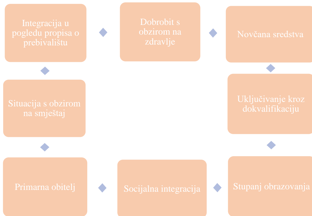
Slika 1 Dimenzije siromaštva

Na slici 1 prikazane su dimenzije siromaštva.