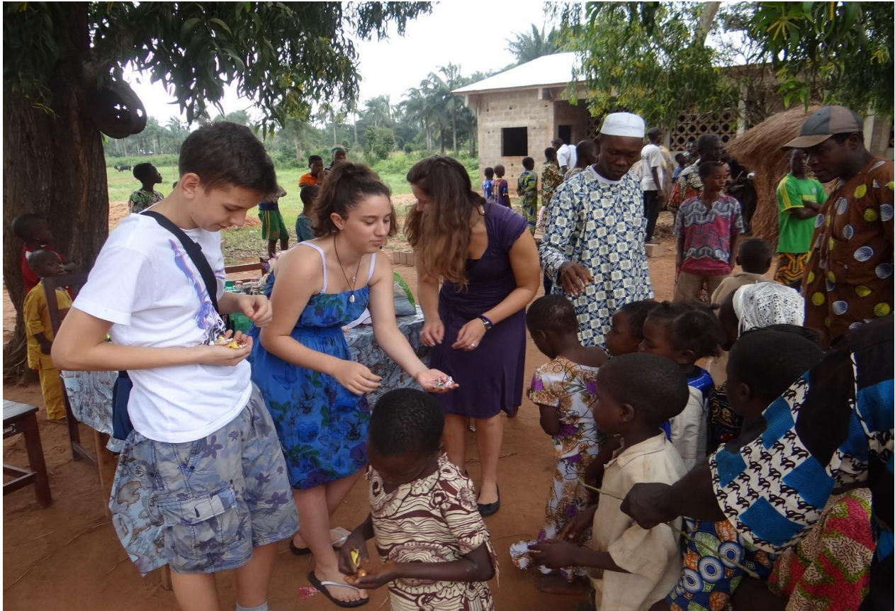
Slika 10 Dijeljenje bombona

U znak zahvalnosti što su organizirali doček u svom selu, pokazali kako žive i čime se bave, turisti ih daruju slatkišima, koji su za neke od njih možda prvi slatkiši u životu. Stanu u red i jedan po jedan dolaze pružajući svoje ručice po slatkiše. U tom trenutku shvati se da si materijalno bogat u usporedbi s njima, ali također i koliko si zapravo duhovno prazan i siromašan.