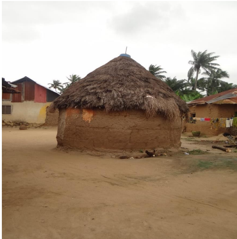
Slika 6 Prikaz kuće od blata

Drugi dio grada biva nepoplavljen. Kao što se vidi na slici njihove kuće su sagrađene od blata. Žive u kućama izgrađenim od slame povezane blatom, što vrlo često uzrokuje ozbiljna oboljenja, čak i smrt ukućana, posebno djece. Zbog nehigijenskih uvjeta i velikih bolesti turisti ne mogu spavati u njihovim kućama.