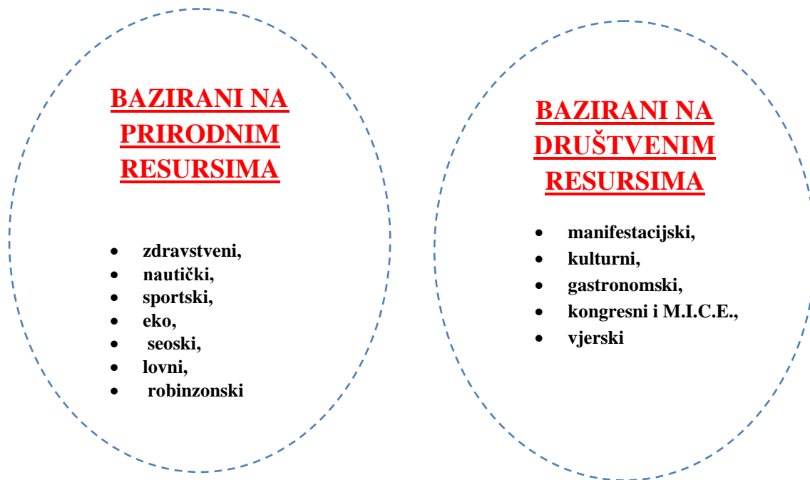
Slika 1. Specifični oblici turizma

Kada je riječ o turizmu, razlikuju se određeni specifični oblici, s obzirom na one koji su bazirani na prirodnim resursima te onih koji su bazirani na društvenim resursima.