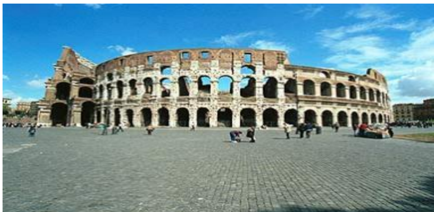
Slika 2. Kulturni turizam u Italiji

Europa kao najjači turistički kontinent, ali i kao cjelina u sociološkom, političkom, a osobito kulturološkom smislu zaslužuje pozornost znanstvenika i istraživača već dugi iz godina. U vremenu globalizacije i miješanja različitih kultura i identiteta turizam kao 'prijevozno sredstvo', odnosno pokretač globalizacijskih kretanja dolazi u prvi plan proučavanja. Kulturni turizam u ujedinjenoj Europi pokazao se pogodnom temom u skladu s načelima Europske Unije koja deklariraju ujedinjenu, ali kulturno raznoliku Europu. (Jelinčić, 2008)