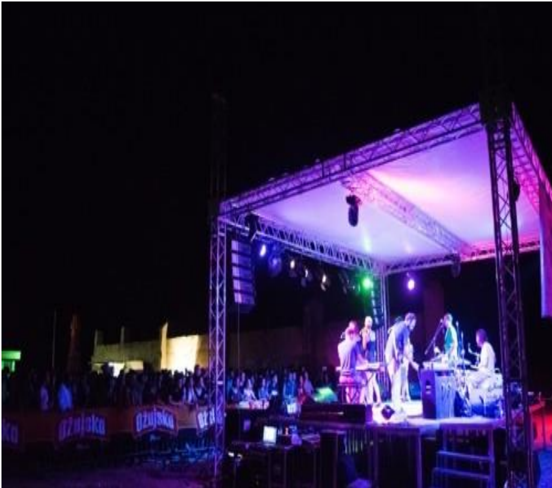
Slika 6. Regius festival 2019.

Kao prva aktivnost ovog projekta navedene su pripreme koje obuhvaćaju, sastanke organizacijskog tima, volonterskog tima, kao i sastanke sa suradničkim organizacijama. Ta aktivnost provodit će se kontinuirano kroz čitavi program, a dužnost svih dionika je da podnose usmene izvještaje o tijeku organizacije, ljudskim kapacitetima i eventualnim manjkavostima i propustima. Na temelju svih prikupljenih informacija izradit će se izvještaj u svrhu poboljšanja budućih programa. Vrednovanje projekta pratit će se kroz ostvarene ciljeve i rezultate projekta. Također, medijske kritike te recenzije o manifestacijama su uvijek pozitivnog karaktera.