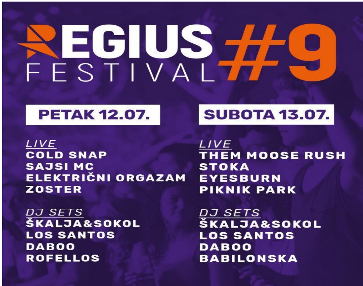
Slika 4. Deveto izdanje Regius festivala