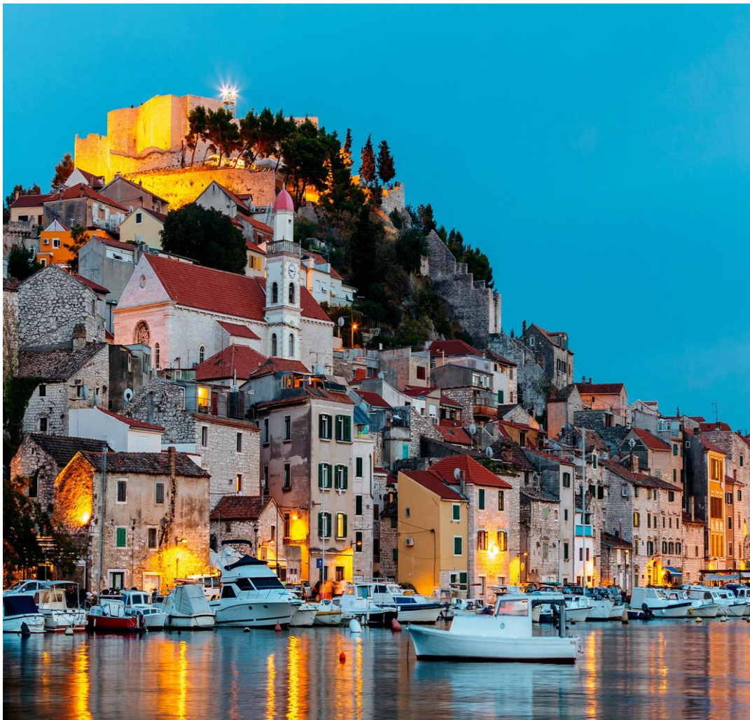
Slika 3. Grad Šibenik

Dakle, Republika Hrvatska ima još mnogo posla kako bi se kulturni turizam poboljšao, tj. još bolje razvio. Unatoč takvom stanju, u RH je nekoliko gradova koji su izuzetno aktualni i aktivni u području kulturnog turizma, među kojima je i jedan grad na Jadranu, grad Šibenik.