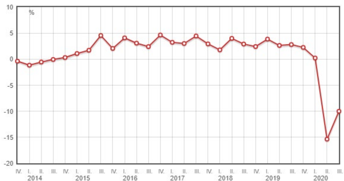
Slika 1. Kretanje BDP-a