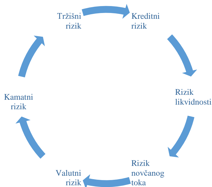
Slika 3 - Financijski rizici