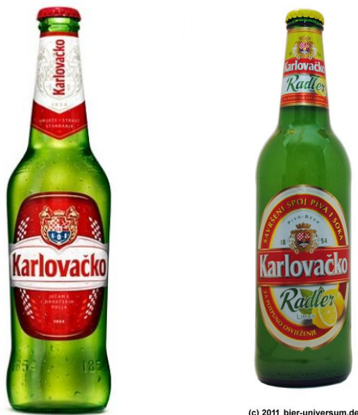
Slika 1. Karlovačko i Karlovačko Radler

„Negativan ishod za Radlere je posljedica smanjenja broja kupaca u tom segmentu za 14%, u odnosu na prethodno razdoblje. Hrvatska domaćinstva su kupovala veće količine Radlera po kupovini, ali su to činila znatno rjeđe (intenzitet kupovine manji je 9%). Lider segmenta drži 36%, a top pet brendova drži 74% vrijednosnog udjela. Vodeći brend je povećao tržišni udio. Trgovačke marke su znatno povećale udio u segmentu Radlera. Sve jači utjecaj promocija u ovom segmentu predstavlja 17% ukupne vrijednosti.“ 4