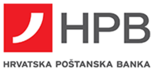
Slika 3.1 Logo Hrvatske poštanske banke d. d.