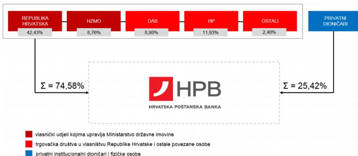
Slika 3.3 Vlasnička struktura HPB-a d. d.