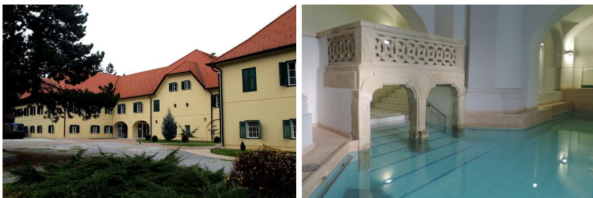
Slika 6. Stubičke toplice

Stubičke toplice najstarije su hrvatsko lječilište koje datira još iz razdoblja cara Hardijana. Tijekom 17. stoljeća na mjestu današnjih toplica nalazila su se dva izvora ljekovitih voda, a do njih je sagrađen objekt za smještaj pacijenata koji su tu dolazili na liječenje. S vremenom su Stubičke toplice rasle i nadograđivale se.