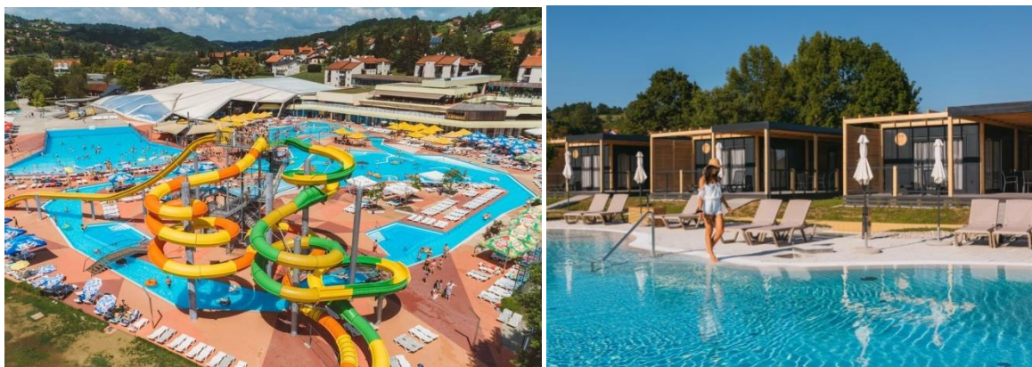
Slika 8. Vodeni planet i Glamping village u Termama Tuhelj

Sumporne i termalne vode na području današnjih Terma Tuhelj za liječenje su se upotrebljavale već u 18. stoljeću. Termalni izvor prvotno je bio u privatnom vlasništvu, a sadržavao je kupalište za osobnu upotrebu vlasnika i njegovih bližnjih. U 1930-im godinama na toj je lokaciji sagrađeno nekoliko bazena i jedan objekt za smještaj posjetitelja i prvo ime im je bilo Tuheljske toplice. Danas se one nazivaju Terme Tuhelj, a u vlasništvu su slovenskih Terma Olimia. 37