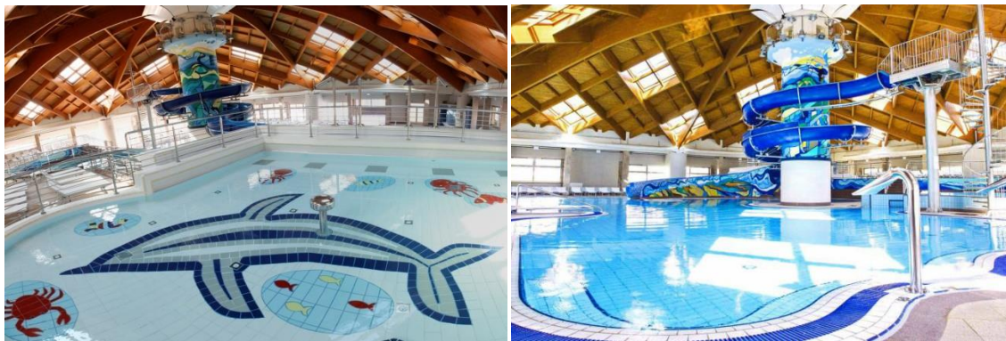
Slika 7. Vodeni park "Aquae Vivae"

Krapinske toplice od grada Krapine udaljene su 14 kilometara, a nalaze se na 160 metara nadmorske visine. Tamošnja hipe-termalna vrela počela su se upotrebljavati 1770-ih godina kada su tri vrela natkrivena i prozvana "Gospodskom kupelji". Do 1860-ih izgrađen je prvi hotel, a sagrađeni su i nove kupelji i vanjski bazeni. 34