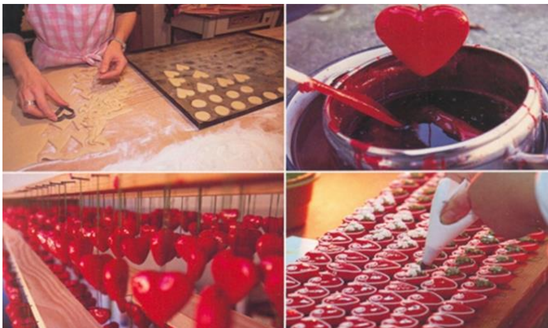
Slika 4. Izrada licitarskog srca

Među neprepoznatljivijim simbolima hrvatskog identiteta nalazi se licitarsko srce (Slika 4.), inače, samo jedan u nizu proizvoda medičarskih obrta s područja sjeverozapadne Hrvatske i Slavonije. Umijeće izrade medičarskih proizvoda datira još iz srednjeg vijeka kada se pojavilo u europskim samostanima. 28