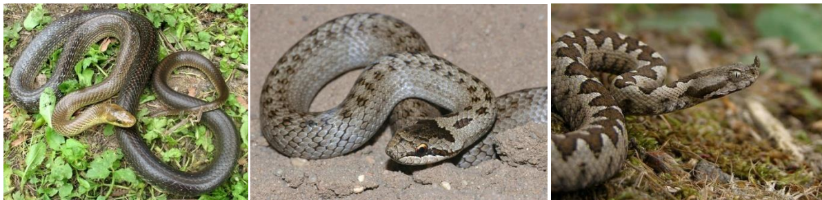
Slika 3. Bijelica, smukulja i poskok