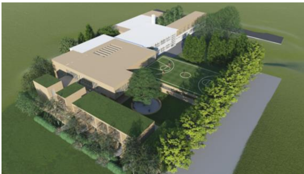
Slika 9. 3D prikaz budućeg Regionalnog centra kompetencija

i izobrazbu kadra u turističkom sektoru (Master plan razvoja turizma za razdoblje 2016.-2025.). Prema Izvješću o provedbi Master plana izrađeno je idejno rješenje za navedeni projekt, a Srednja škola Zabok imenovana je za kandidata budućeg centra kompetencija. 51 Službene web stranice Krapinsko-zagorske županije navode kako vrijednost ovog projekta iznosi preko 35 milijuna kuna od čega se 30 milijuna financira iz europskih fondova, a preostalih 5 milijuna dolazi iz županijskog proračuna. Radovi na rekonstrukciji Srednje škole Zabok planiraju se za proljeće 2021. godine, a dovršenje izgradnje za 2023. godinu. 52