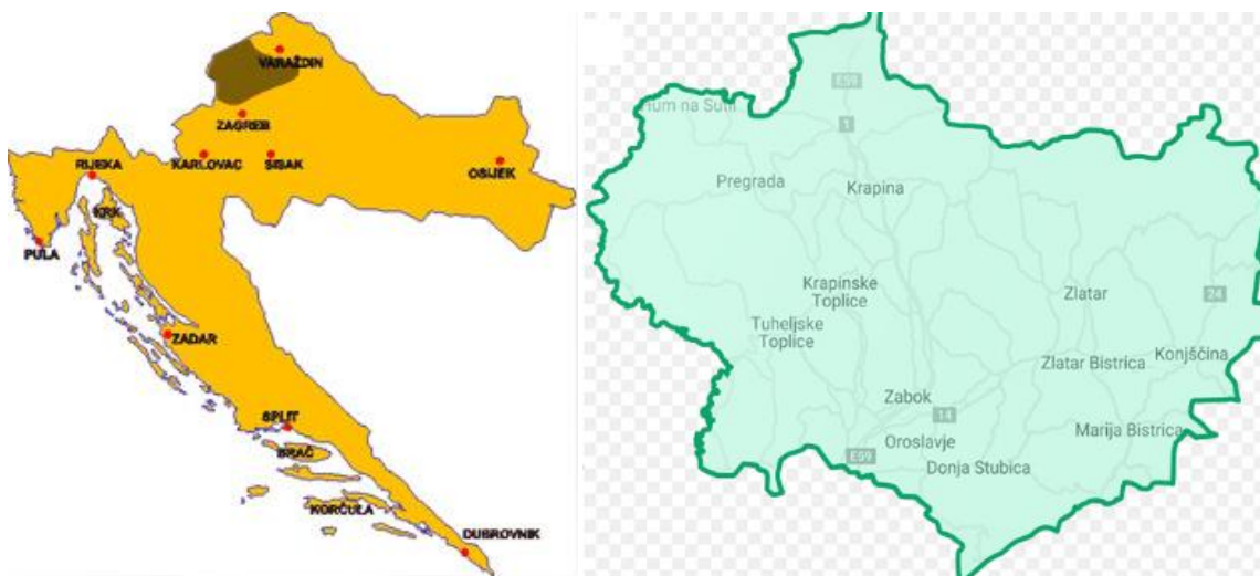
Slika 1. Hrvatsko zagorje, prikaz teritorija

Hrvatsko zagorje (Slika 1.) smješteno je u sjeverozapadnoj Hrvatskoj, prostire se na otprilike 1.900 km 2 i obuhvaća županije: Krapinsko-zagorsku (1.229 km 2 ), Varaždinsku i Zagrebačku. Kroz njegov teritorij prolaze rijeke Sutla, Krapina i Bednja, a područje je i brojnih niskih gora uključujući Ivančicu, Strahinčicu, Desiničku goru i Brezovicu. 16 Najveći gradovi su Ivanec, Krapina, Lepoglava, Bedekovčina, Oroslavlje i Zlatar. 17