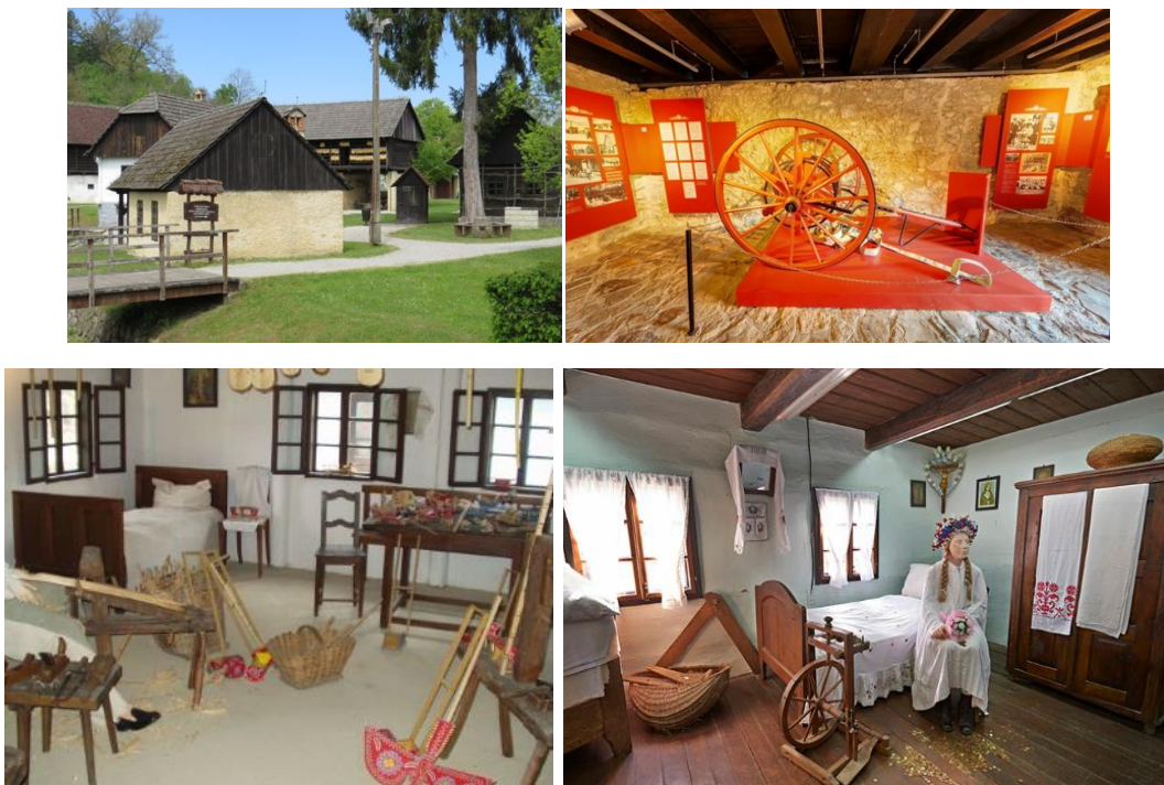
Slika 5. Muzej "Staro selo" Kumrovec

Priča o razvoju Muzeja "Staro selo" u Kumrovcu seže u 1947. godinu kada su ljudi iz svih dijelova bivše države dolazili razgledavati rodno mjesto i kuću Josipa Broza Tita. Tada se po prvi puta pojavila ideja o poduzimanju mjera zaštite ovog prostora, a istovremeno je počeo i infrastrukturni rast Kumrovca. Podignut je hotel "Kumrovec", postavljen spomenik Brozu Titu, a njegova kuća pretvorena je u etnografski muzej. Naknadno je, prema konzervatorsko muzikološkim principima izrađen katalog očuvanja ukupno 61 objekta u Kumrovcu i obližnjem naselju Lončari, a 1961. godine Regionalni zavod za zaštitu spomenika kulture upisuje "Staro selo" Kumrovec u Registar spomenika kulture prve kategorije. 30