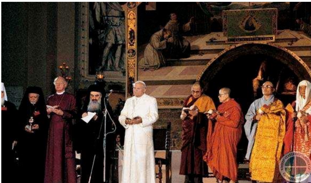
Slika 4. https://narod.hr/kultura/27-listopada-1986-assisi-zajednicka-molitva-za-mir-12-vjera-svijeta christorchaos.com

Doprinos pape Ivana Pavla II. u promicanju međureligijskog dijaloga iznimno je velik i ostat će nezaobilazna referenca na koju će se još dugo moći pozivati katolički i drugi vjernici angažirani na tom području. Upravo u tu svrhu 2010. osnovan je Centar Ivan Pavao II. za međureligijske studije ( St. John Paul II Center for Interreligious studies ) pri Papinskom sveučilištu Sv. Tome Akvinskog u Rimu. Svrha tog Centra je nastavljati graditi mostove između kršćana i pripadnika drugih religijskih tradicija te formirati buduće generacije vjerskih lidera i aktera koji će razumijevati međureligijski dijalog i znati ga implementirati kako u teologiji, tako i u svakodnevnom životu i pastoralnoj praksi (Crkva u multikulturalnoj i multireligijskoj Bosni i Hercegovini: 2019). Da međureligijski dijalog Katoličke Crkve neće utihniti i prestatimogu nam posvjedočiti i aktivnosti današnjeg Pastira Crkve pape Franje koji neumorno nastavlja tamo gdje su njegovi prethodnici stali. Papa tvrdi sljedeće: „U današnjem nesigurnom svijetu dijalog među religijama nije znak slabosti, jer vjernici su čimbenik mira za ljudska društva“. 26 Svi svjetski mediji prenijeli su vijest o prvom papi koji je posjetio Irak. Papa je u Iraku u svom govoru na međureligijskom susretu u Abrahamovom Uru Kaldejskom poručio: „Neprijateljstvo, ekstremizam i nasilje se ne rađa iz pobožnog srca, nego je to izdaja vjere te da vjernici ne mogu šutjeti kada terorizam zloupotrebljava vjeru“. 27