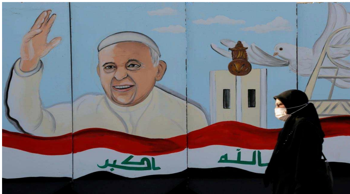
Slika 5