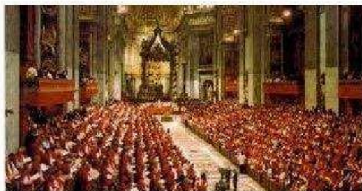
Slika 1 , Drugi vatikanski koncil, papa Ivan XXIII.